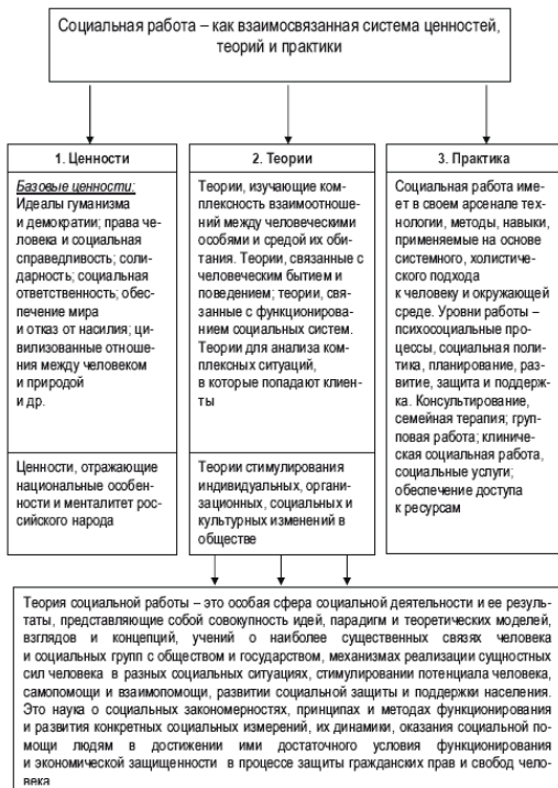
Схема 1. Методология теории социальной работы. Социальная работа как наука