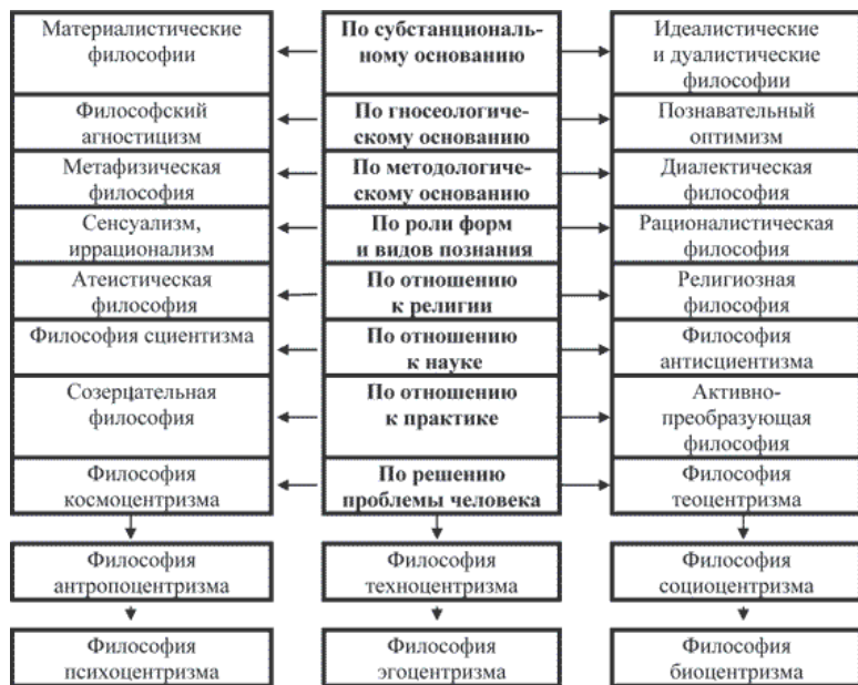
Схема 4. Проблемная классификация философских систем.

Проблемно-ментальные типы философствования в известной мере носят «сквозной» (воспроизводящийся) характер.