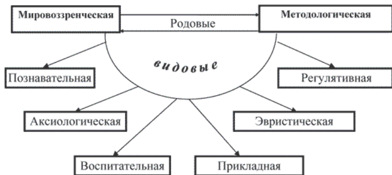
Схема 2. Социальные функции философии.

ли философского знания – философия политики, философия права, философия морали, философия культуры, философия религии, философия искусства, философия социальной работы и другие. Постигание данных отраслей научного знания позволяет усвоить наиболее общие проблемы познавательной и практической деятельности специалистов определенного профиля.