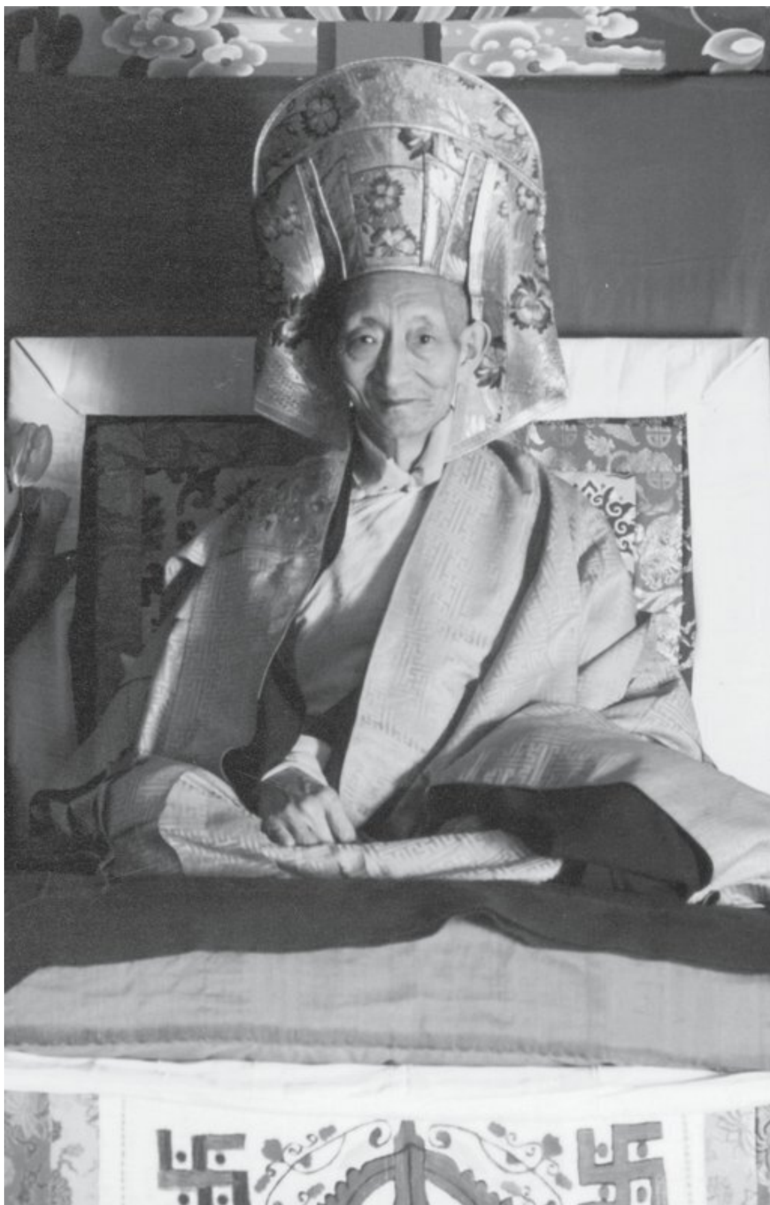
Калу Ринпоче на ритуальном троне