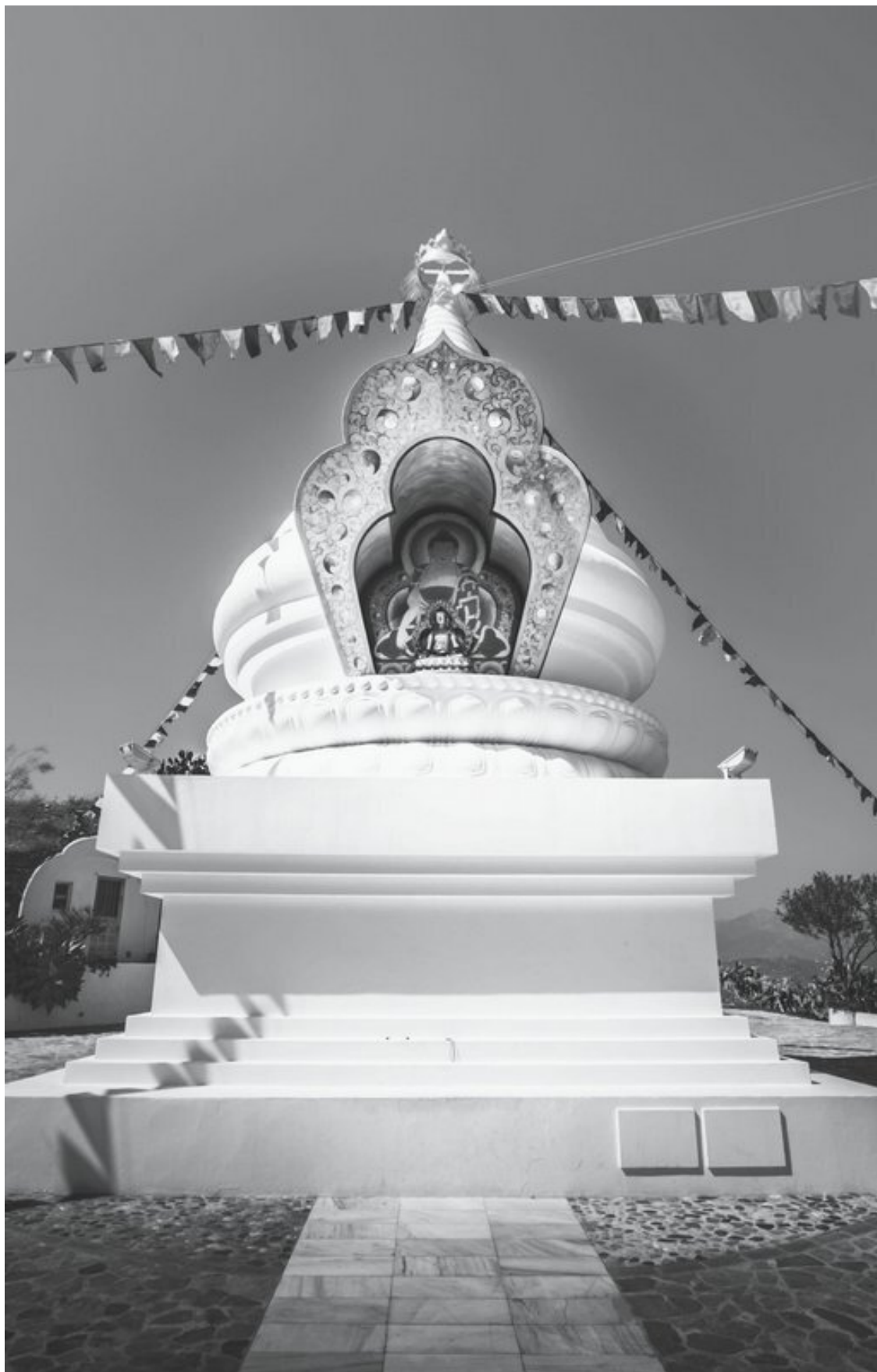
Ступа в Карма-Гёне, Испания