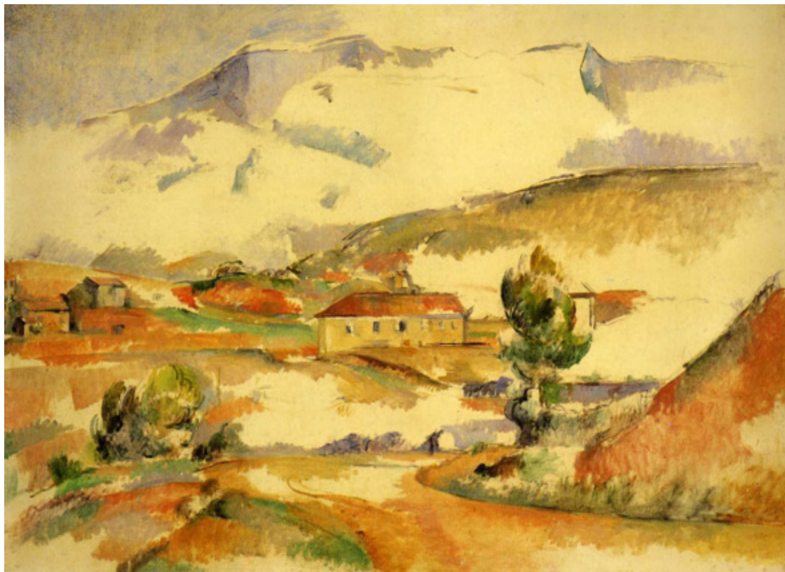
Поль Сезанн. Плоскогорье горы Сент-Виктуар

Яркой неадаптивной личностью был, например, Поль Гоген. Он презирал тех, кто его окружал. Он был нищ и не признан, художники же, работавшие в традиционной манере, щеголяли в дорогих костюмах и выставляли свои работы на каждом Салоне. Но Гоген держался как пророк, и молодежь, искавшая себе кумиров, шла за ним – от него исходило почти мистическое ощущение силы. Шумный, решительный, грубый, отличный фехтовальщик, прекрасный боксер, он говорил окружающим прямо в лицо то, что о них думал, и при этом не стеснялся в выражениях. Искусством для него было то, во что верил он сам. К 47 годам за его спиной остались разрушенная жизнь и разбитые надежды, – осмеянный современниками художник, отец, о котором забыли собственные дети 76 . При жизни его картины стоили 25—30 франков, через двадцать лет они стали стоить тысячи франков, а теперь это один из самых дорогих художников мира.