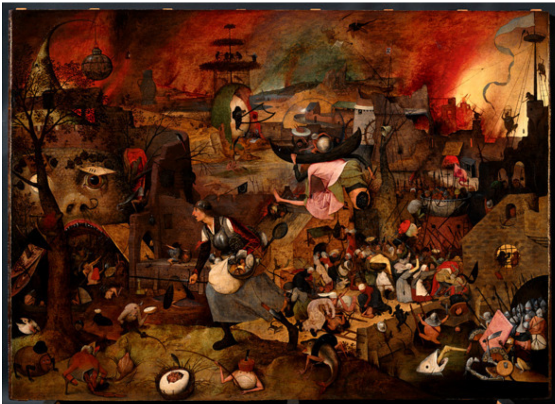
Питер Брейгель Старший. «Безумная Грета». 1563 г.

дало повод Дега с горечью заметить: «Нас расстреливали, но при этом обшаривали наши карманы» 21 .