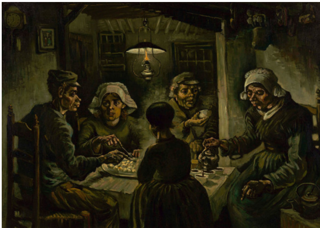
Винсент Ван Гог. Едоки картофеля. 1885 г.

Ван Гог начал свой путь с компании «Гупиль», продававшей картины, и работал в ее отделениях в Гааге, Лондоне и Париже, пока в 1876 не был уволен за некомпетентность (!). В 1877 Ван Гог приехал в Амстердам изучать богословие, но, провалившись на экзамене, поступил в миссионерскую школу в Брюсселе и стал проповедником. В это время только (в 23 года) он и начал учиться рисовать 24 .