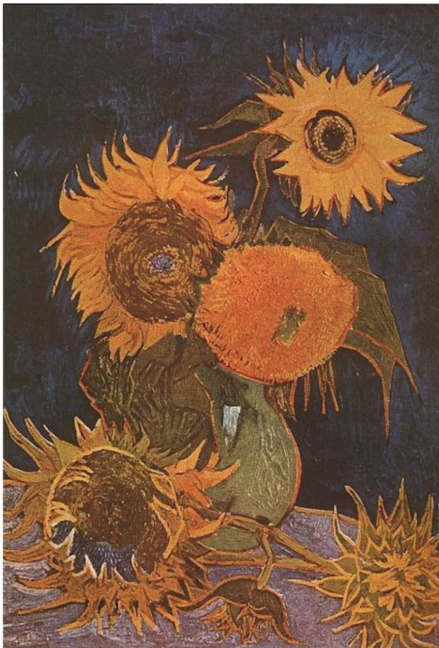
Винсент Ван Гог. Ваза с пятью подсолнухами. 1888 г.

«... Само творчество – есть феномен абсурда . Произведение не служит отдушиной для болезни духа. Напротив, оно один из признаков этой болезни, накладывающий отпечаток на все мышление человека. Но оно выводит дух вовне и помещает его перед другими людьми – не для того чтобы повергнуть их в растерянность, а чтобы точно указать тот безысходный путь, по которому мы все движемся» 67 .