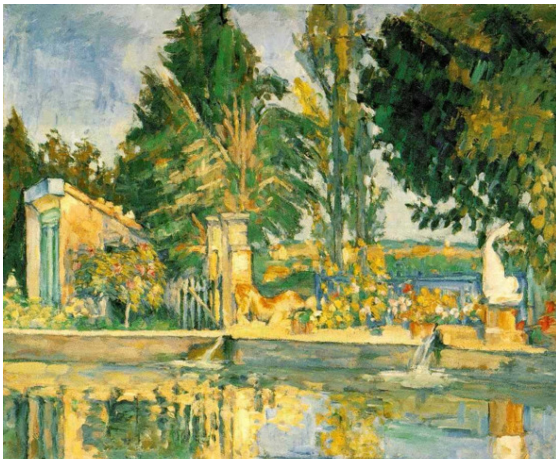
Поль Сезанн. Бассейн в Жа де Буффане. 1876

Поля Сезанна не избежала участь отвергнутого коллективными представлениями художника. Каждый год он представлял картины в Салон – выставку современного искусства, находившуюся под покровительством Французской Академии изящных искусств, бывшей главным арбитром общественного вкуса. И каждый год все без исключения работы Сезанна признавались не годными. Причина этого проста. Члены жюри Салона предпочитали картины на исторические и литературные темы, натуралистически выписанные. Осмеянный критикой и презираемый публикой, Сезанн глушил свое разочарование тяжелой работой 75 .