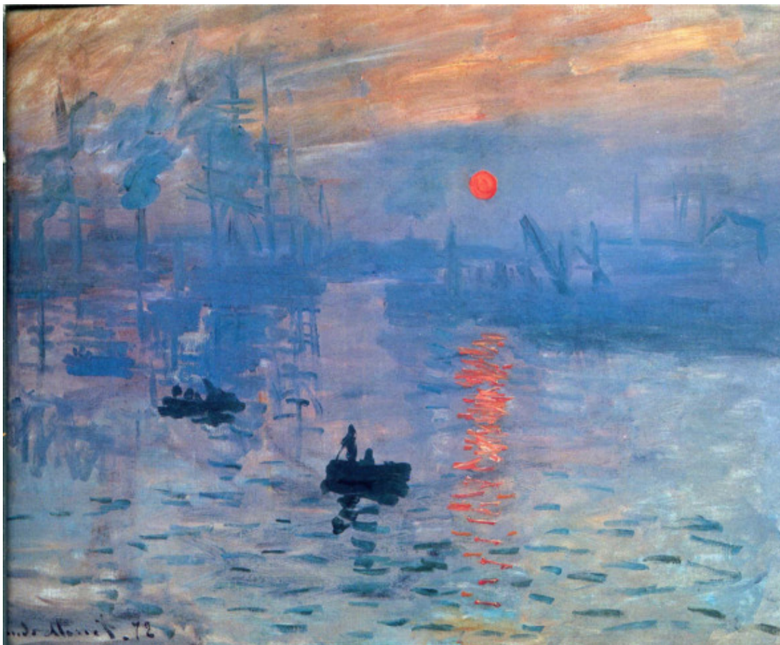
Клод Моне. Впечатление. Восходящее солнце. 1872 г. Картина, давшая название направлению Импрессионизм

Первым серьезным выступлением против тиранической власти Академии явилось открытие в мае 1863 года знаменитого Салона отверженных. Эта выставка была разрешена Наполеоном III как ответ на растущее в художественных кругах недовольство сдерживающей развитие искусства политикой официального Салона.