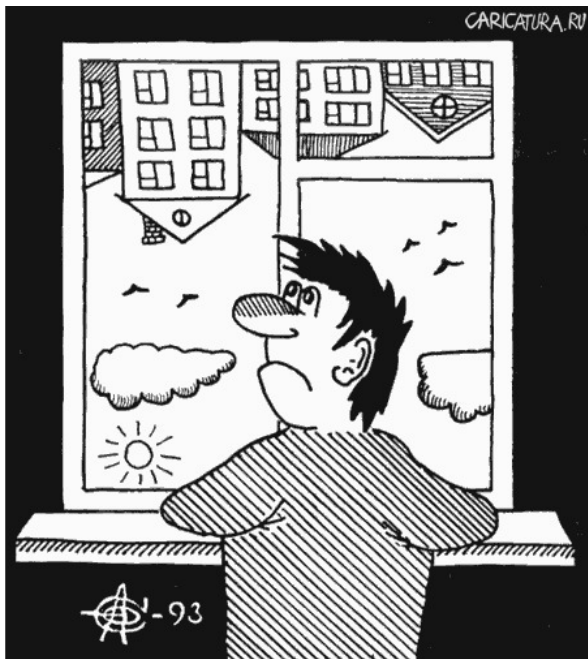
Тоска. О. Сыромятников