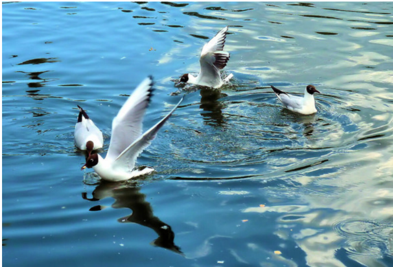
Чайки сели в воду