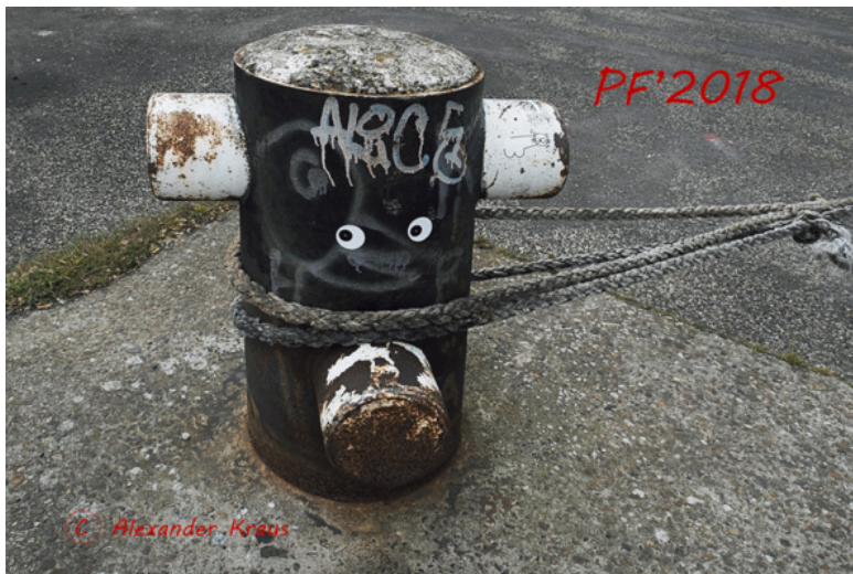
Живописный кнехт.