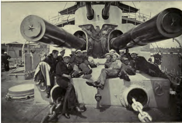
Матросы на баке