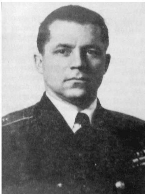
Контр-адмирал Бекренёв Леонид Константинович

Каждый военный знает, что боеспособность и возможности любого подразделения во многом зависят от личных качеств командира и уровня подготовки личного состава. Впрочем, эта истина ясна не только военным, но, отличие от гражданских есть. Военные, в большинстве случаев действуют в экстремальных условиях, когда времени на подбор и подготовку кадров практически нет. Поэтому формирование подразделения водолазов-разведчиков, по возможности, не должно быть спешным.