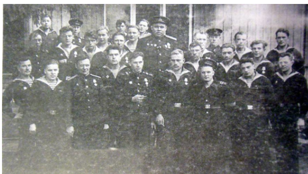
Бойцы Роты особого назначения.