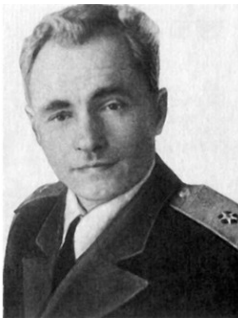
Контр-адмирал Крылов Фотий Иванович (1943г.)

В конце июля 1941 года начальник ЭПРОНа контр-адмирал Крылов Ф. И., докладывая представителю Верховного Главнокомандующего заместителю наркома ВМФ адмиралу Исакову И. С. об эвакуации водолазной школы из города Выборга в город Ленинград, высказал мнение о целесообразности создания специального отряда водолазов-разведчиков (ВР) на базе хорошо подготовленных водолазов школы.