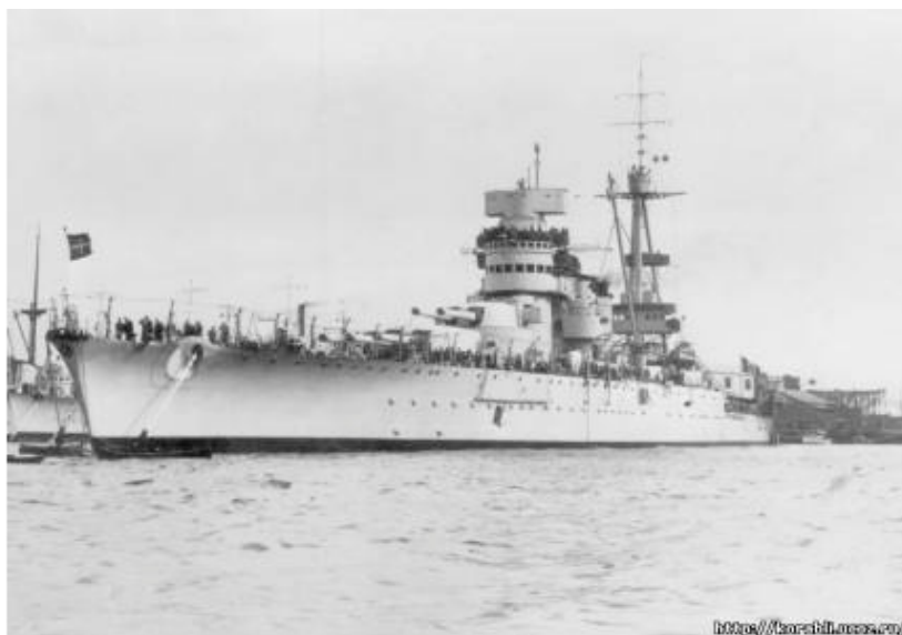
Линкор «Новороссийск» в Севастополе.

Дождавшись сигнала, «Пикколо» вновь пришла в бухту, откуда боевые пловцы, на буксировщиках со взрывчаткой, двинулись к причальной бочке «Новороссийска».