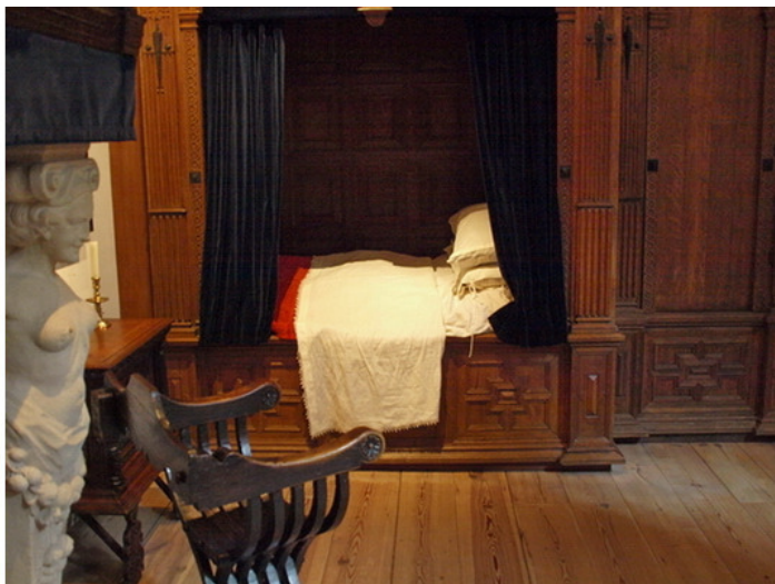
Альков в доме-музее Рембрандта в Амстердаме

ная во все любовные тайны хозяйки... всё современнику Ребрандта было привычно и понятно. Именно это его и окружало.