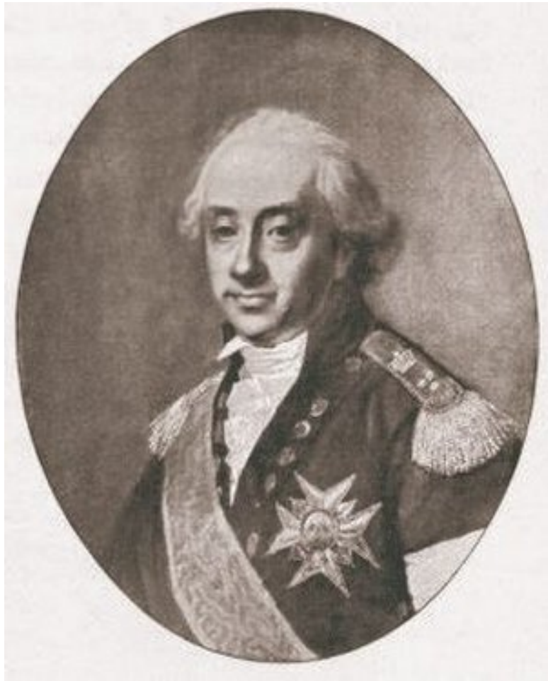
Карл Август Эренсверд