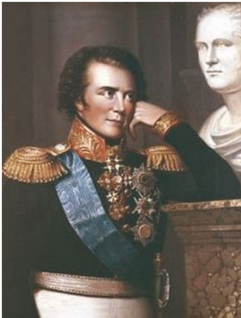
Густав Мориц Армфельт