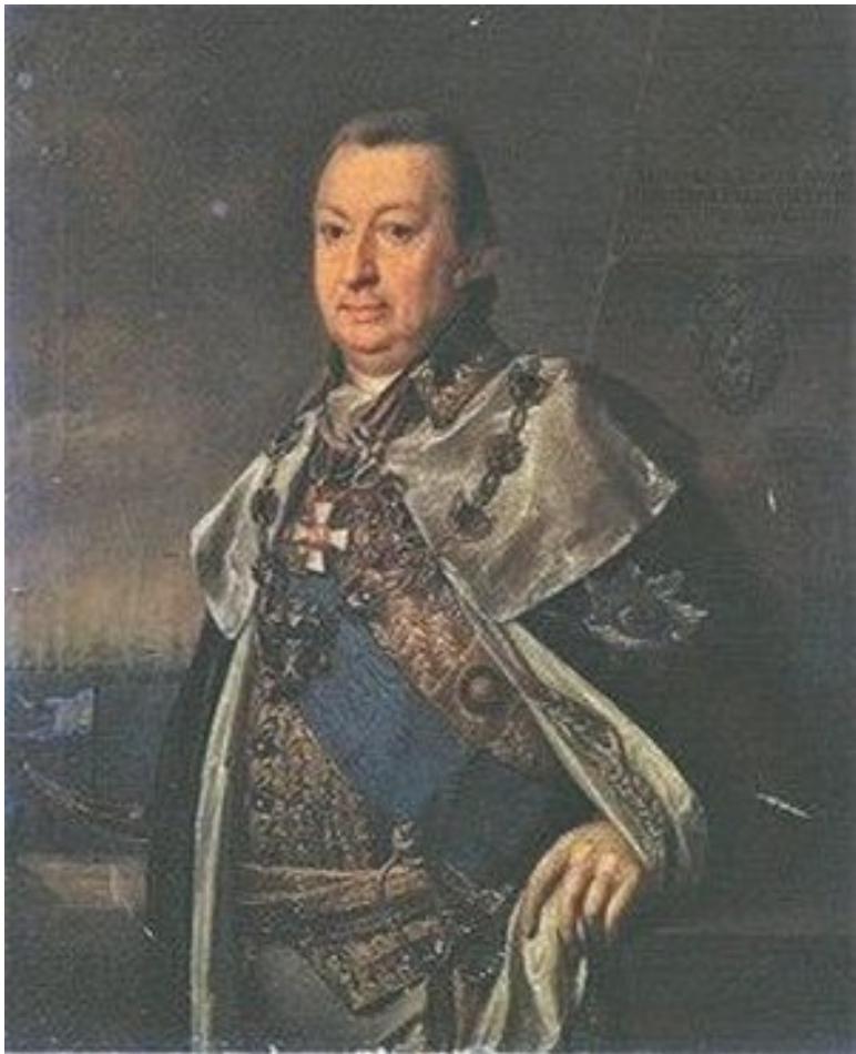
Александр Иванович фон Круз