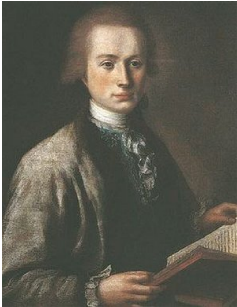
Алексей Григорьевич Спиридов