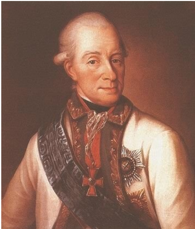
Адмирал Чичагов П.В.