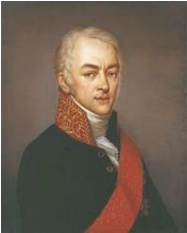
Алексей Кириллович Разумовский