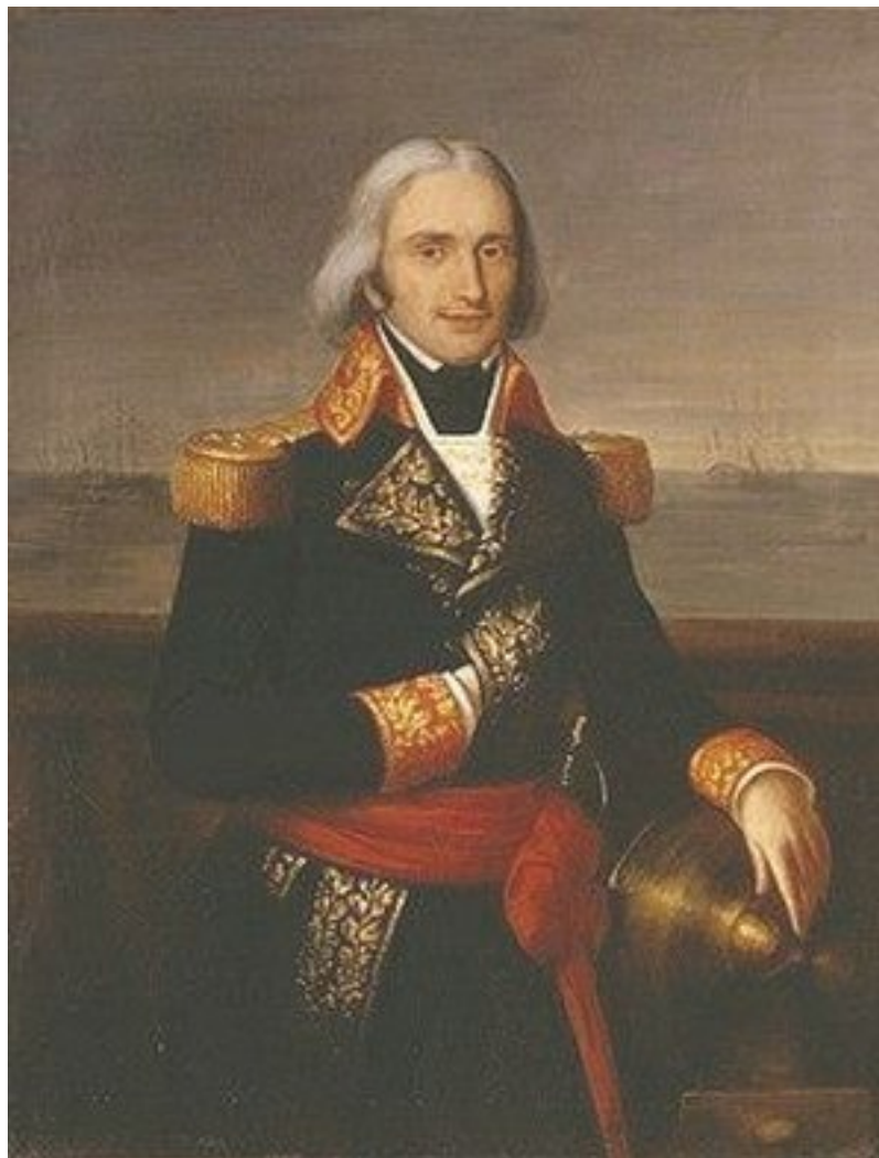
Франсуа-Поль Брюейс д'Эгалле

– Греков бери, сколько хочешь! А солдат не дам ни одного! – ответил тот. – У меня сейчас нет и полутора тысяч, а местные разбойники только и ждут случая, чтобы изрубить нас в куски!