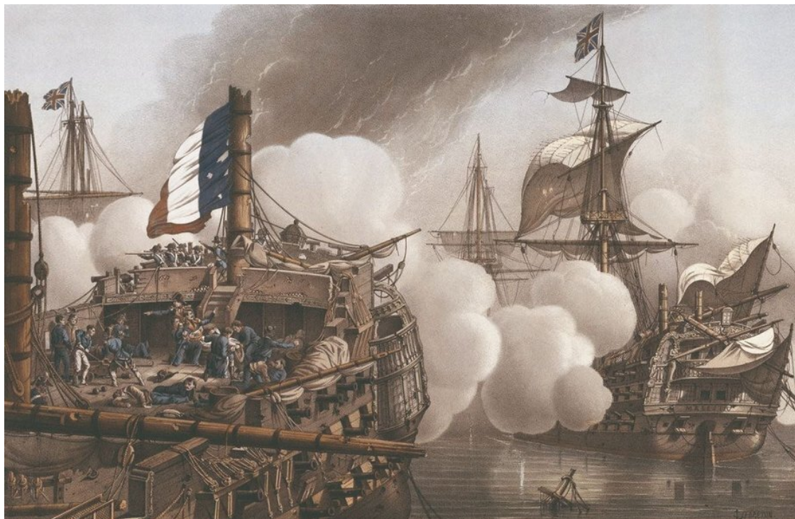
«Тоннанта» во время битвы на Ниле