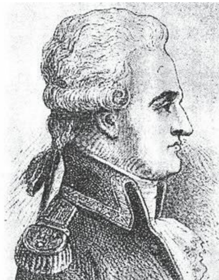
Пьер-Шарль-Жан-Батист-Сильвестр де Вильнёв