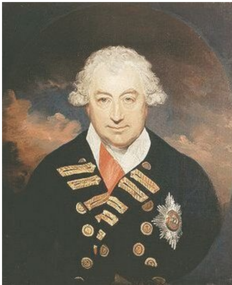
Джон Джервис, 1-й граф Сент-Винсент

Так как отказать герою в сложной политической ситуации было нельзя, Нельсон вскоре и получил назначение одним из младших флагманов на флот адмирала Джервиса (ставшего после одержанной победы графом Сент-Винсентом). Его флот должен был осуществлять блокаду Кадиса и крейсировать по Средиземному морю.