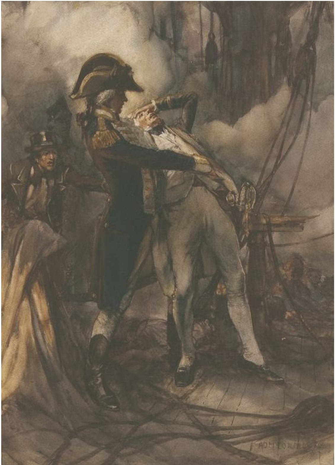
Ранение Нельсона в сражение в битве при Абукире

На протяжении четырех убийственных для французов часов их арьергард только видел и слышал происходящее рядом с ним, но не предпринял даже попытки поддержать своих изнемогающих в неравной битве товарищей. Один лишь «Тимoleon», поставив марсели, напрасно ждал сигнала к съемке с якоря, но такового ему так никто и не дал.