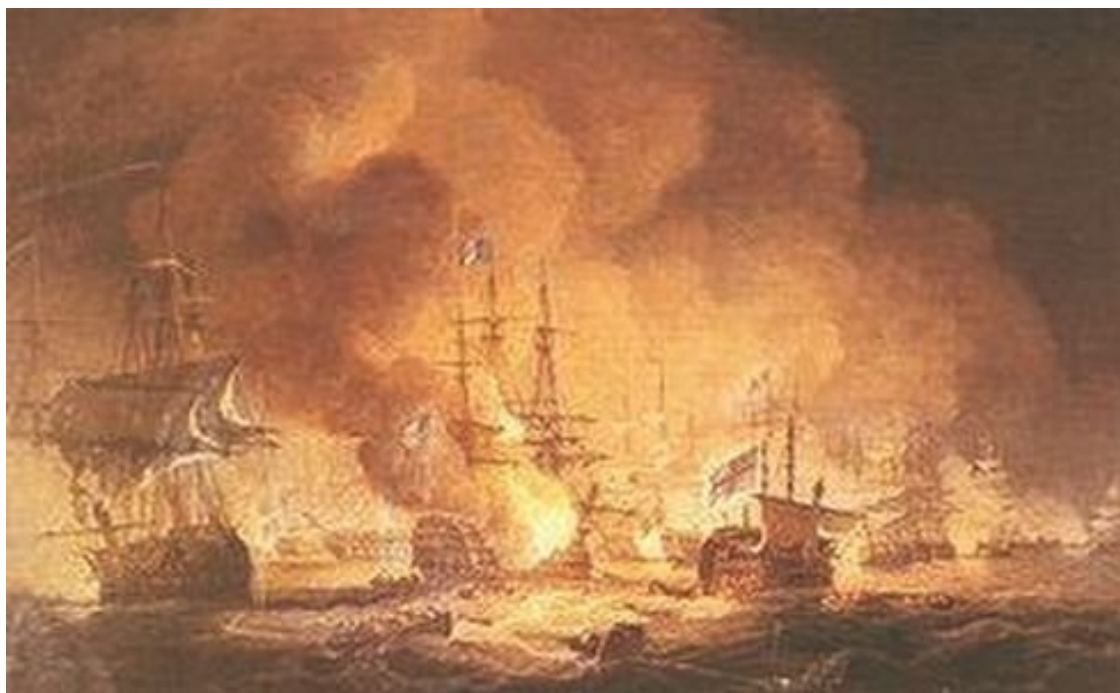
Морское сражение при Абукире

Следующий во французской линии корабль «Спартанец» сошелся в поединке с «Тезеем». Однако вскоре с правой стороны его атаковал еще и «Вэнгард». В довершение всего огонь по «Спартанцу» из своих кормовых орудий открыл и «Минотавр». А едва сдался «Конкеран», как в «Спартанец» полетели ядра и с «Одасьеза». Выстоять в таком огне было просто невыносимо. Некоторое время «Спартанец» кое-как держался, но затем потерял все мачты, большую часть команды и вынужден был также спустить свой флаг.