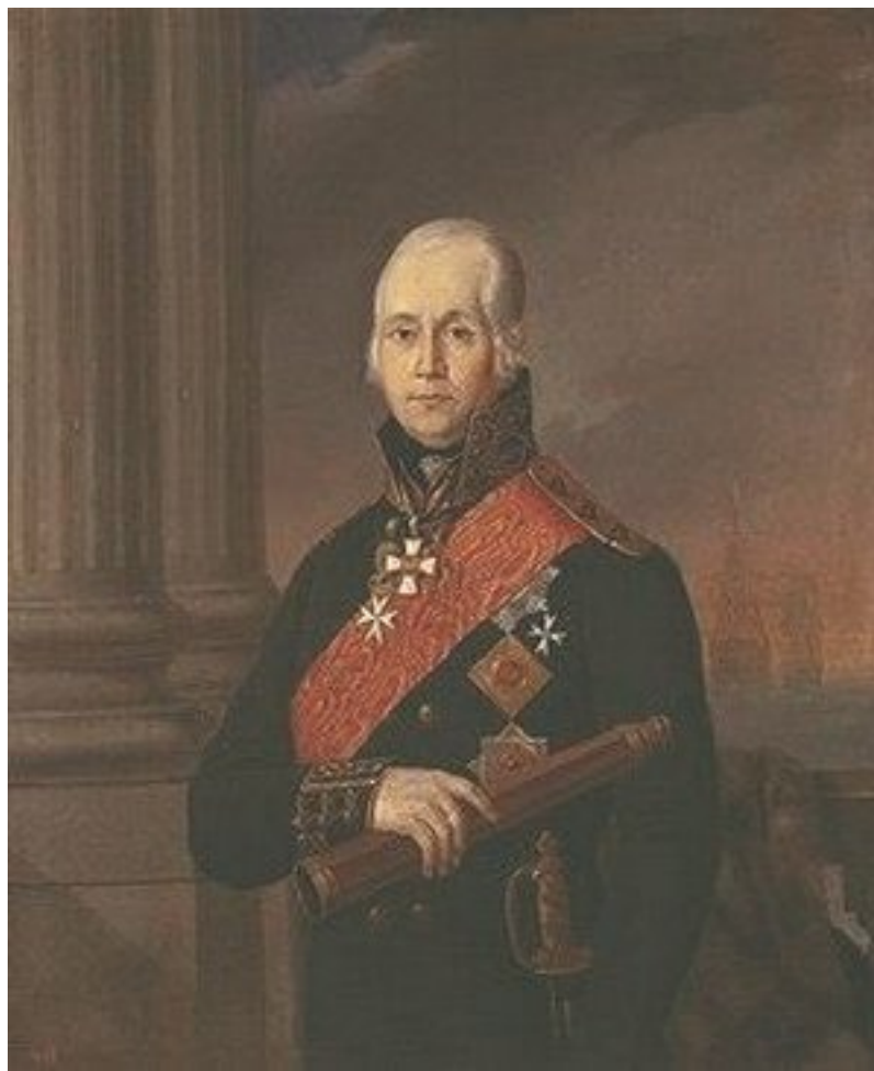
Фёдор Фёдорович Ушаков

Между тем лавина слухов нарастала. В начале апреля пришло сообщение, повергшее всех в смятение – французский флот уже втягивается в Мраморное море! Загоня лошадей, в Севастополь помчались фельдъегери. Император требовал: «Вследствие данного уже от нас вам повеления о выходе с эскадрой линейного флота в море и занятии позиции между Севастополем и Одессой, старайтесь наблюдать все движения как со стороны Порты, так и французов, буде бы они покусились войти в Черное море или склонить Порту к каковому-либо покушению».