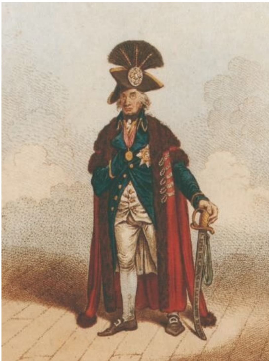
Нельсон – герой битвы при Ниле. Народный лубок

Всего бой длился шесть часов. За время боя «Леандр» потерял трех мичманов и более трех десятков матросов, почти шестьдесят человек было ранено. Позднее англичане писали, что французы потеряли сотню убитыми и две сотни ранеными, но эти цифры сильно завышены. Вряд ли потери на «Женере» были больше, чем у англичан.