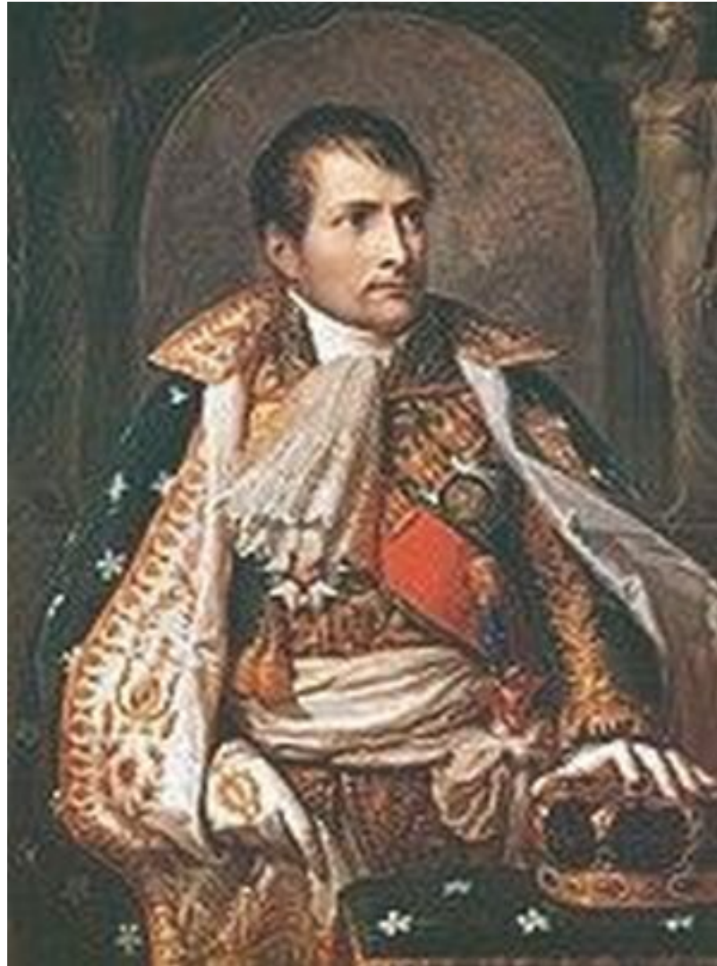
Наполеон I Бонапарт

От внимания Бонапарта они, разумеется, не ускользнули. Командующий итальянской армией мгновенно оценил их стратегическую выгоду.