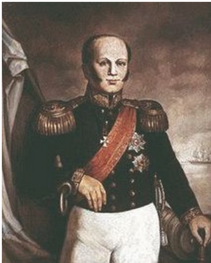
Дмитрий Николаевич Сенявин

Вторым новостроенным линейным кораблем «Святой Петр» командовал самый молодой из капитанов I ранга 36-летний Дмитрий Сенявин, бывший генеральс-адъютант Потемкина, герой набега на Синоп, любимец Мордвинова и недруг Ушакова. Впрочем, при всем этом Сенявин был выдающимся моряком и честным человеком. Отметим и то, что и Ушаков, и Сенявин, при всей личной антипатии друг к другу, признавали профессионализм и талант друг друга. Как известно, на такое способны весьма немногие!