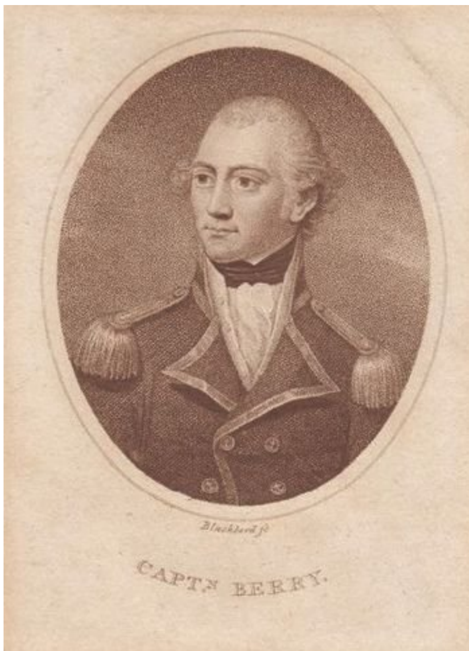
HMS Agamemnon HMS Captain Контр-адмирал сэр Эдвард Берри

В целях сохранения тайны корабли Нельсона отделились от основного флота глубокой ночью. Вскоре они уже миновали Гибралтар. Затем сразу повернули на норд-ост к южным берегам Франции. Здесь англичанам не повезло. На них обрушился жесточайший шторм. Поменявшийся норд-вестовый ветер отнес корабли Нельсона от французского побережья и разбросал по морю. «Вэнгард» потерял в битве со стихией фок-мачту и две стены. Ни мастерство флаг-капитана Берри, ни опыт самого Нельсона, сутками не сходившего с четвердека, не могли исправить ситуации.