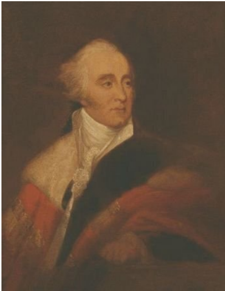
Лорд Гилберт Минто

На следующий день в кабинете лорда Спенсера был уже и сам Нельсон. Первый лорд объяснил контр-адмиралу все тонкости его назначения. Затем выразил надежду, что граф Сент-Винсент использует Нельсона именно так, как планирует адмиралтейство. После этого первый лорд перешел уже непосредственно к разъяснению задачи.