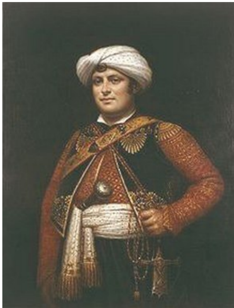
Мамлюк-армянин Рустам Раза, телохранитель и оруженосец Наполеона Бонапарта.

А затем двадцать тысяч французов разом закричали, что было мочи. Еще бы, на фоне восходящего солнца они увидели все четыреста каирских минаретов! Это значило конец изнурительного похода и богатую добычу.