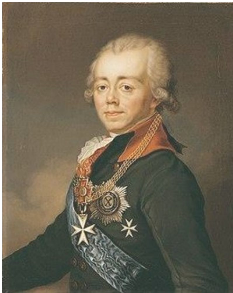
Павел I Петрович

К исходу 1797 года Виктор Павлович Кочубей осторожно, но откровенно внушил великому визирю и капудан-паше мысль об опасности владычества французов в Адриатике. При этом существовала опасность, что турки, объединившись с французами, направят объединенный флот в Черное море.