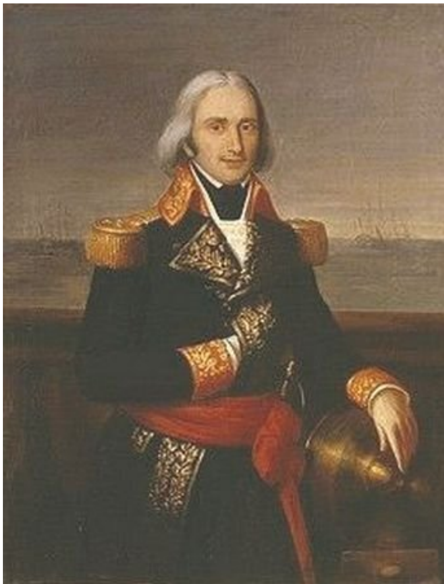
Адмирал Франсуа Поль Де Брюе

– Не ясно, кто горит, но ясно, что ему конец! – мрачно констатировал Нельсон, наблюдая за полыхающим в ночи гигантским костром.