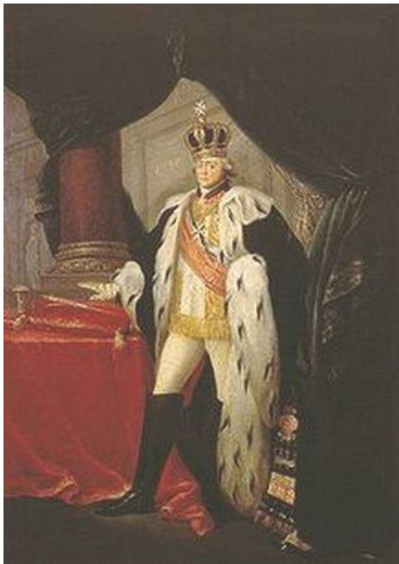
Портрет Павла I в одеянии гроссмейстера Мальтийского ордена