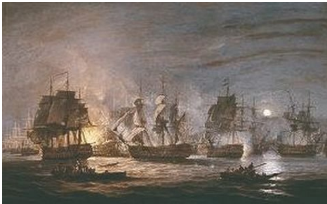
Битва у Нила

Попал в хорошую переделку «Белерофон». Он неудачно занял боевую позицию против 120-пушечного «Орента» и поплатился за это. Французы быстро сбили ему вначале бизань-, а потом и грот-мачту. По всей палубе полыхали пожары, выглядевшие на фоне ночного неба особенно зловеще. Наконец, к половине девятого вечера «Белерофон» не выдержал огня, обрубил канат и с помощью вспомогательного паруса-блинда, который кое-как укрепили под огрызком бушприта, начал выходить из зоны огня. Но и здесь «Белерофону» не повезло, беспомощно дрейфуя вдоль линии сражения, он поочередно попал в начале под огонь «Тоннанта», а затем еще и «Эре». Когда кораблю все же удалось выбраться в сторону от боя, на его борту было уже две сотни убитых и раненых. На этом участие «Белерофона» в сражении завершилось. Состояние линейного корабля было такое, что с ним шутя теперь бы расправился последний фрегат.