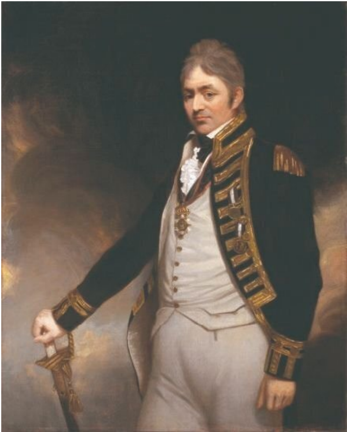
Контр-адмирала Томас Трубридж

И снова эскадра Нельсона спешит на всех парусах, чтобы перехватить и уничтожить французов.