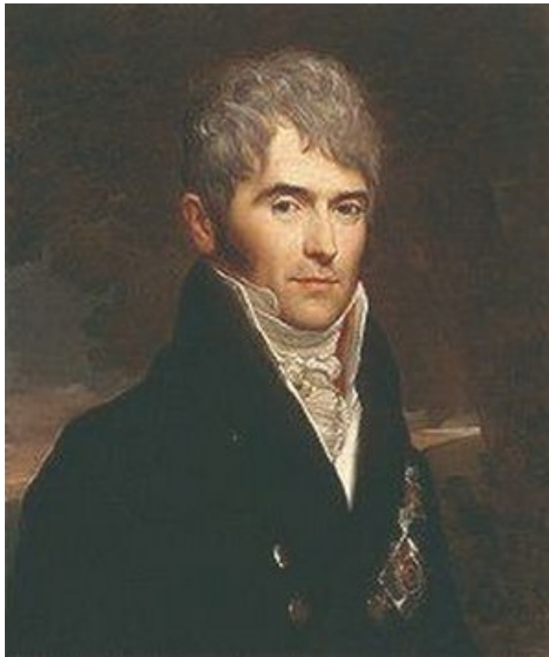
Виктор Павлович Кочубей

– Мы надеемся на лучшее, но готовиться следует к самому худшему! – внушал императору канцлер Безбородко. – Кроме этого надо провести и рокировку послов в Константинополе. Кочубей хорош, но сейчас там нужна новая фигура. Дружбу с турками следует начинать с чистого листа!