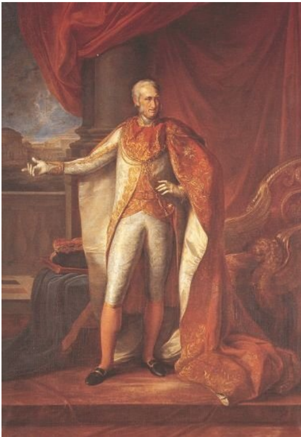
Король Неаполя Фердинанд IV

– Впрочем, по Неаполю ходят непроверенные слухи, что французы отправились на захват Мальты! – завершил свой доклад Трубридж.