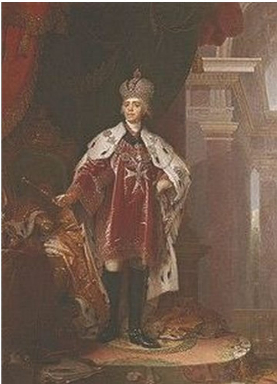
Павел I в короне, далматике и знаках Мальтийского ордена.

– Неслыханная наглость! – кричал он канцлеру Безбородко. – Этот выскочка Бонапарт не мог не знать, что я покровительствую ордену.