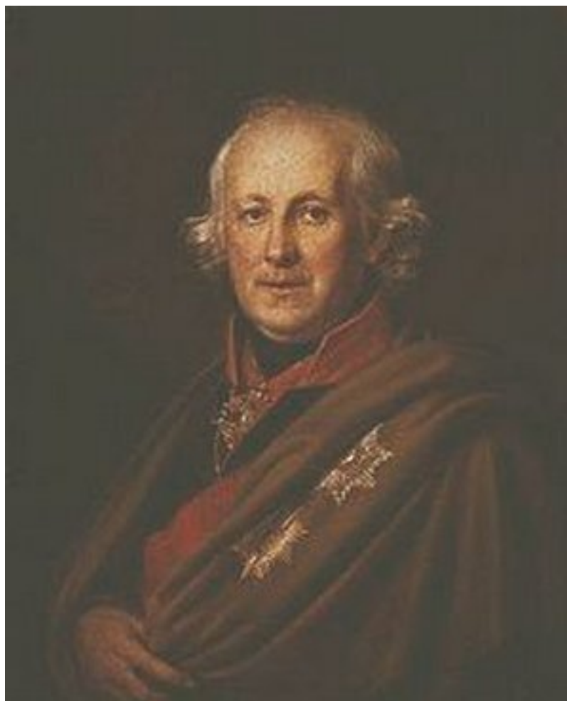
Николай Семёнович Мординов

Личность адмирала Николая Семеновича Мордвинова вообще весьма примечательна. В прошлую войну с турками он показал себя как совершенно никчемный флотоводец и был отрешен от командования кораблями. На берегу Мординов чувствовал себя уверенней. Он любил заниматься хозяйственными делами, считался просвещенным экономистом, слыл либералом и значился масоном. Уже много лет спустя масоны-декабристы будут именно его прочить в масонское правительство России. А потому частный, на первый взгляд, конфликт между русофилом Ушаковым и масоном-англоманом Мордвиновым на самом деле имел весьма серьезную подоплеку.