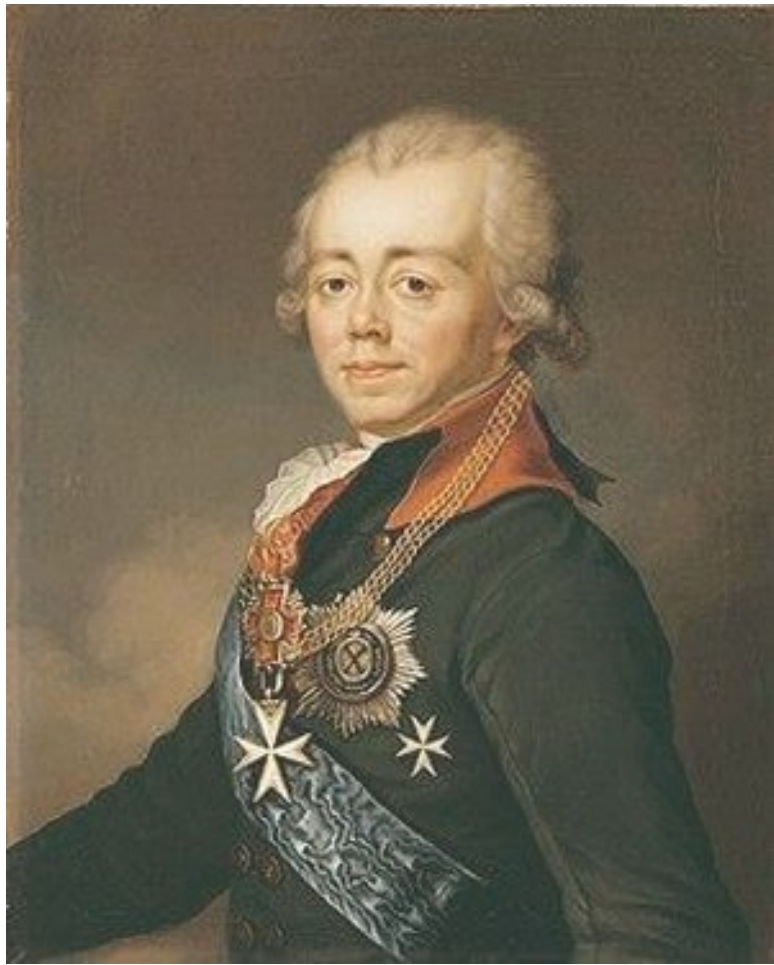
Павел I Петрович