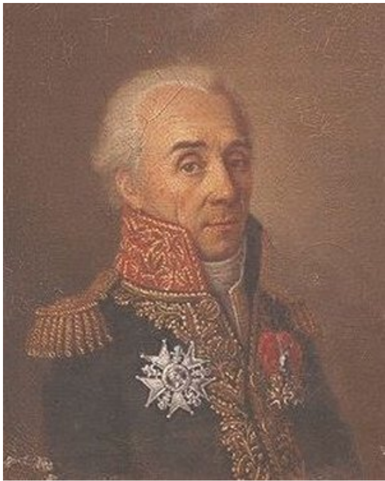
Луи Франсуа Жан Шабо