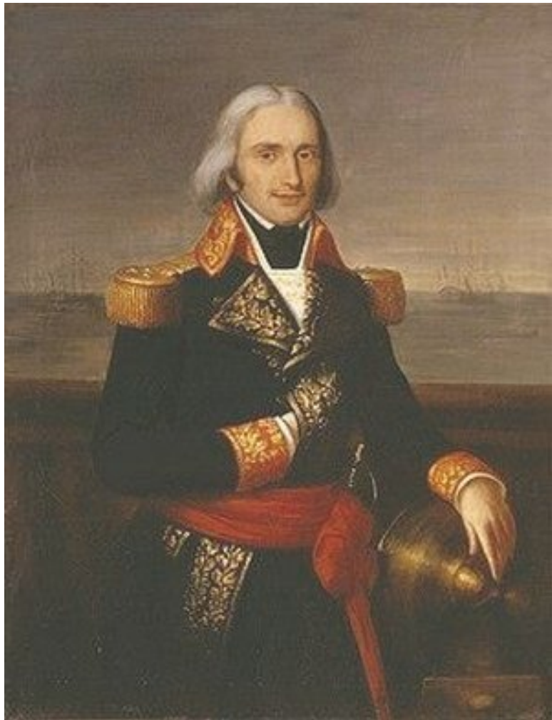
Франсуа-Поль Брюейс д'Эгалъе