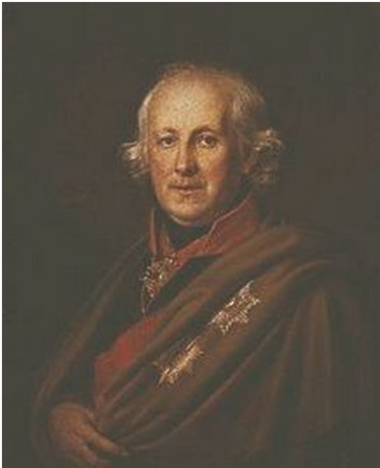
Николай Семёнович Мордвинов