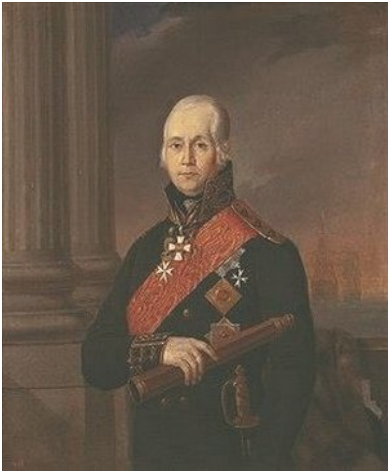
Фёдор Фёдорович Ушаков

Между тем лавина слухов нарастала. В начале апреля при-