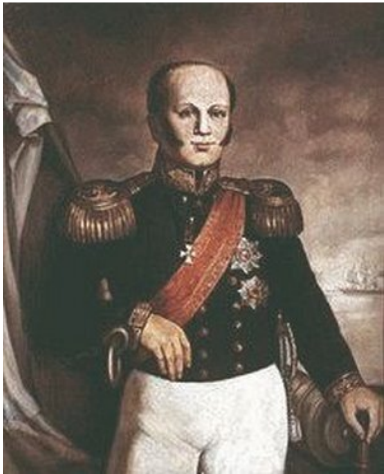
Дмитрий Николаевич Сенявин