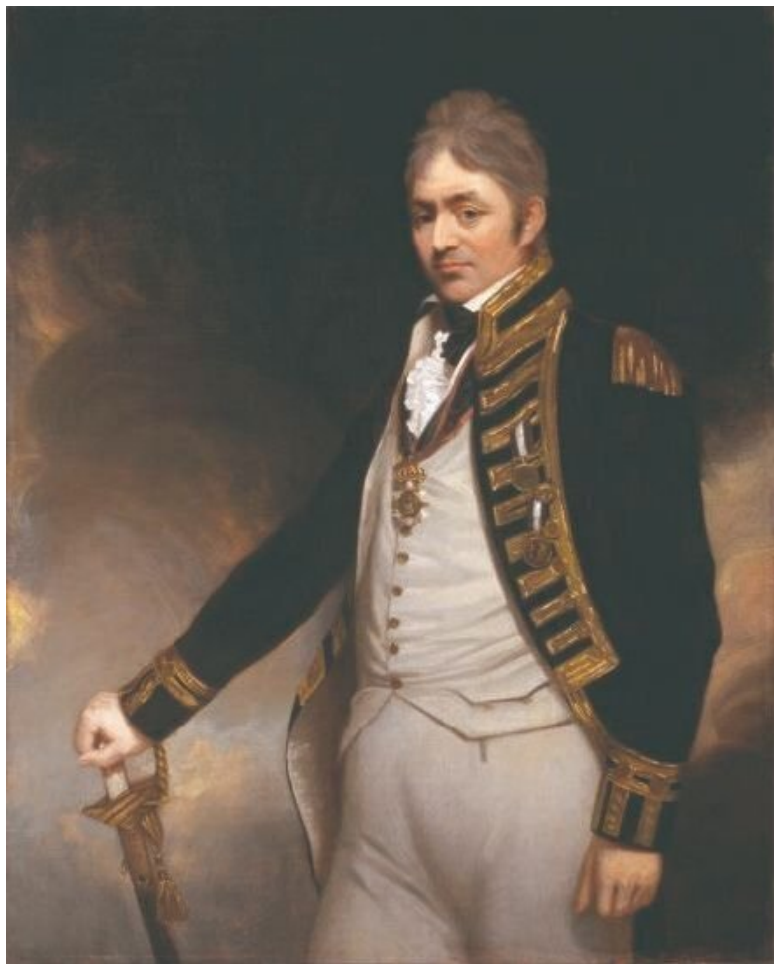
Контр-адмирала Томас Трубридж