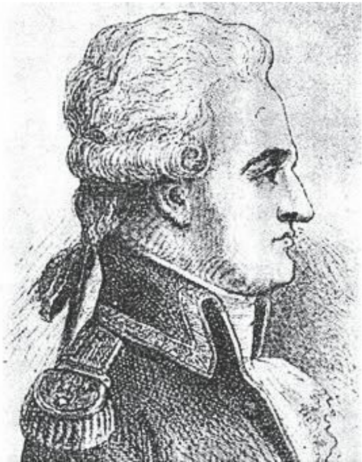
Пьер-Шарль-Жан-Батист-Сильвестр де Вильнёв