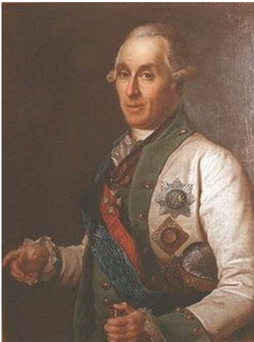
Самуил Карлович Грейг