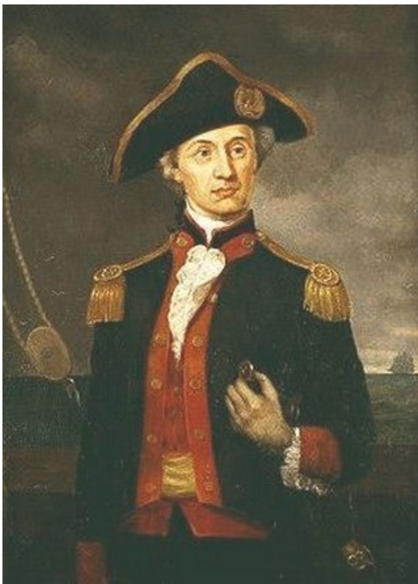
Джон Пол Джонс

О нем писали Александр Дюма, Теккерей и Фенимор Купер, он был дружен с Суворовым и Бенджаменом Франклиным, в его честь учреждали медали, а именем пугали детей. Он был проклят на родине и стал посмертным национальным героем на другом конце света. Редьярд Киплинг посвятил ему свою знаменитую «Балладу о трех капитанах», излив там всю злобу на изменника: