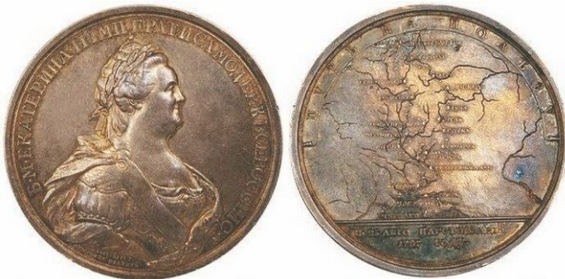
Медаль в память путешествия Императрицы Екатерины II в Крым. 1787 г.

Однако с Екатериной австрийский император более уже никогда не встретится. Иосиф Второй скоропостижно умрет несколько месяцев спустя. Но главное он все же успеет сделать: обеспечить союз двух держав в начавшемся противостоянии с Турцией.