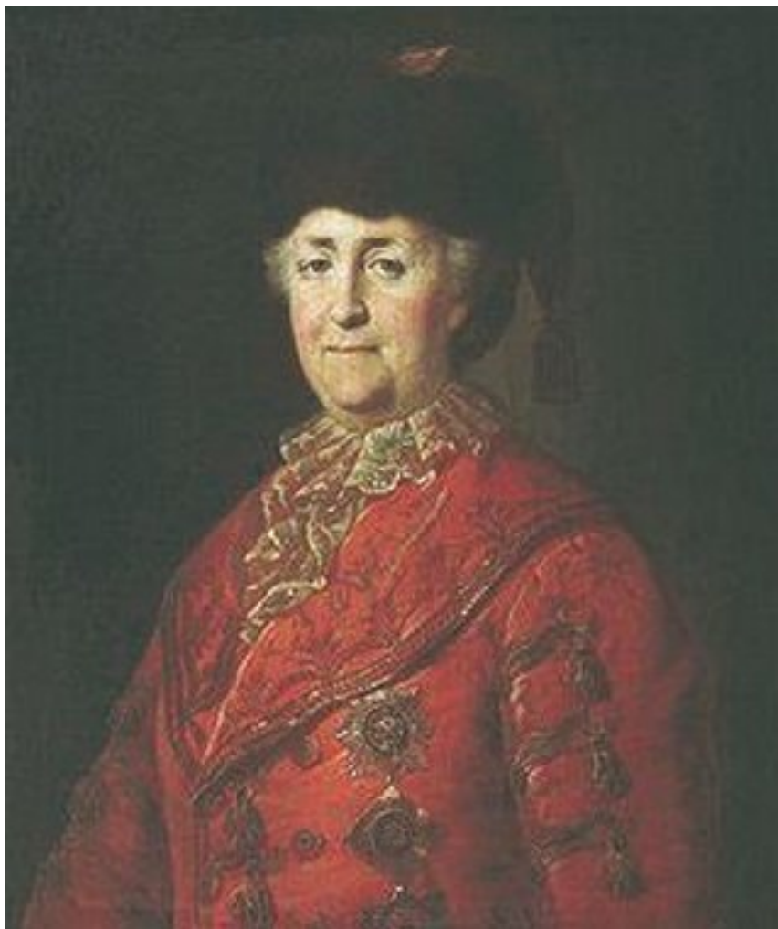
Екатерина Вторая в дорожном костюме, 1787.

Из Херсона навстречу Екатерине Второй уже спешил австрийский император Иосиф. Предстоящая встреча должна была решить будущую совместную политику на их южных рубежах. Именно поэтому Екатерина пригласила Иосифа посетить вместе с ней свои причерноморские владения. Австрийский император приглашение принял и выехал навстречу российской императрице под именем мифического графа Фалькенштейна.