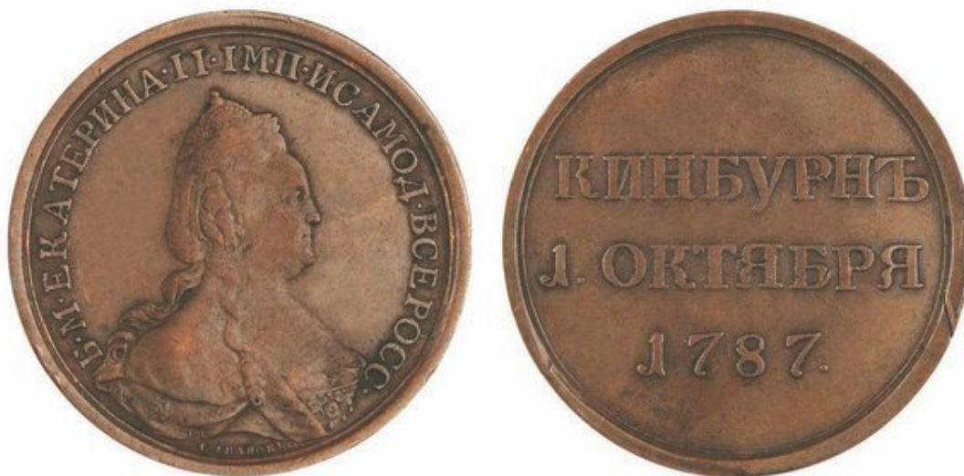
Медали с надписью: «Кинбурн 1 октября 1787»