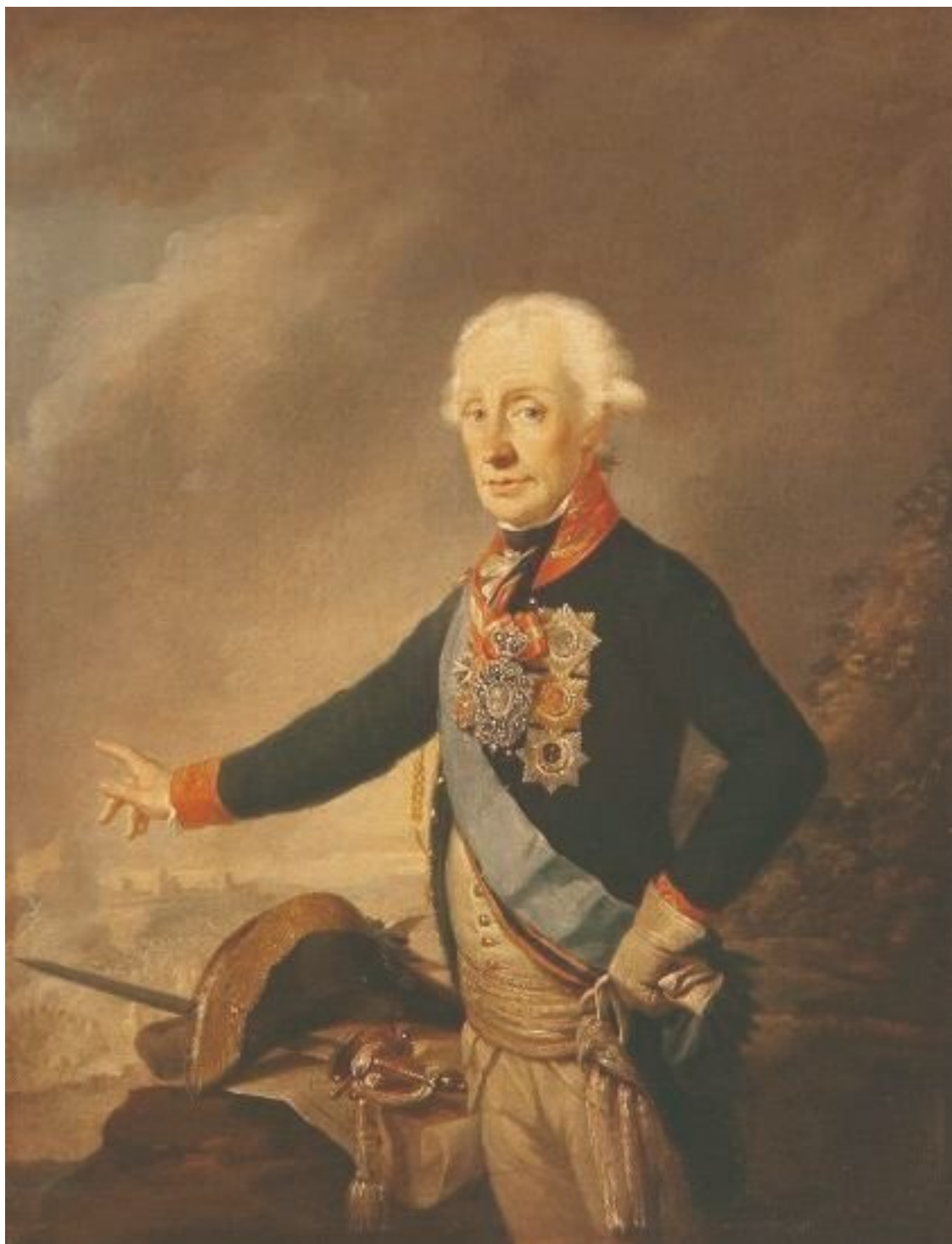
Александр Васильевич Суворов

Затем Екатерина с Иосифом отправились смотреть корабельные верфи. Императрица при этом, сообразно моменту, была в белом флотском мундире, Иосиф – в темно-зеленом армейском. Снова гремела музыка. По смазанным салом полозьям один за другим величаво съехали и закачались на пологой днепровской волне 80-пушечный линейный корабль «Иосиф», 70-пушечный «Владимир» и 50-пушечный «Александр». Тут же Потемкин представил Екатерине и генерал-аншефа Суворова, о котором уже шла слава, как о первом полководце империи.