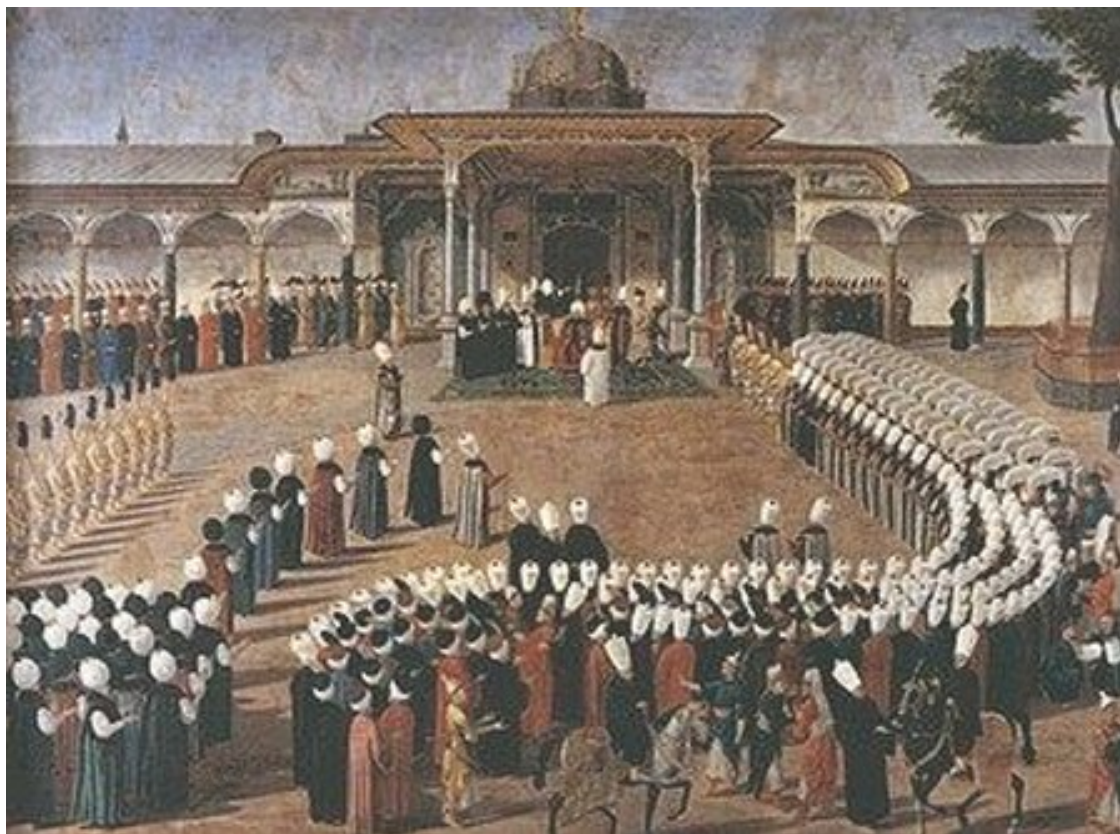
Селим III принимает сановников во дворе Дворца Топкапы.

Для того чтобы выслать в море хотя бы пять линейных кораблей понадобился личный приезд в Константинополь великого визиря, пригрозившего в случае отказа перевешать капитанов на реях.