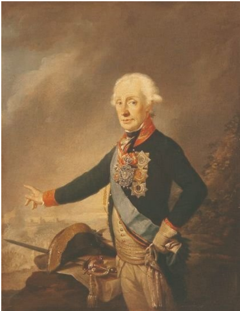
Александр Васильевич Суворов