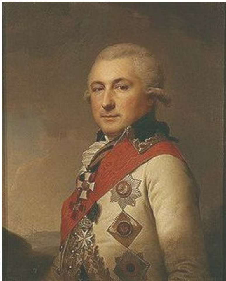
Иосиф Михайлович де Рибас