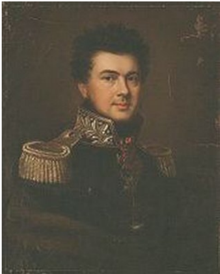
Портрет И. И. Сабира