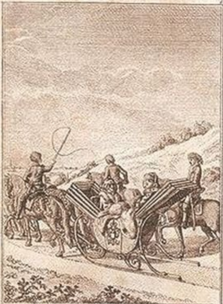
Reise der Kaiserin nach Cherson.