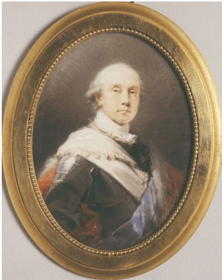
Нассау-Зиген принц Карл-Генрих-Николай-Оттон