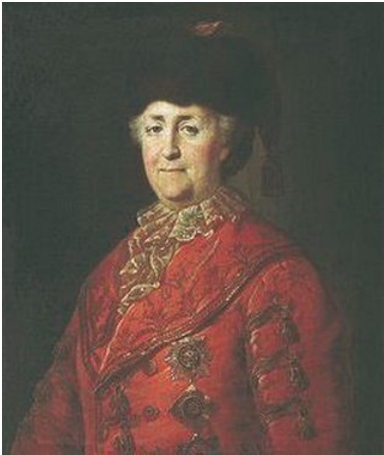
Екатерина Вторая в дорожном костюме, 1787.

Из Херсона навстречу Екатерине Второй уже спешил ав-