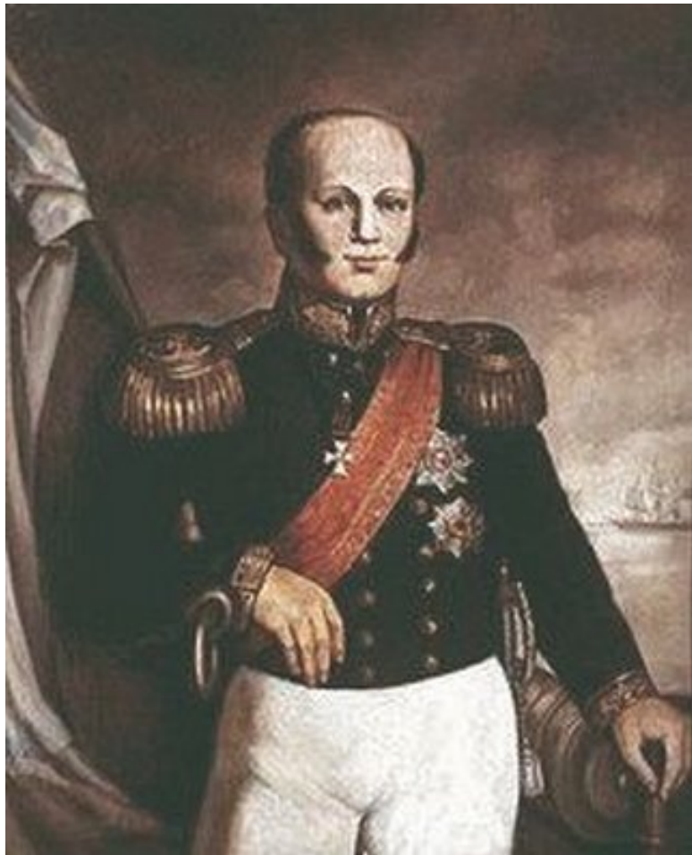
Дмитрий Николаевич Сенявин