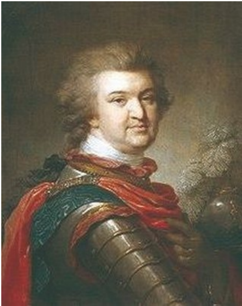
Потёмкин незадолго до смерти, апрель 1791 года