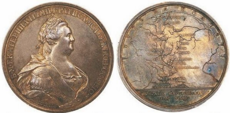
Медаль в память путешествия Императрицы Екатерины II в Крым. 1787 г.

Путешествие Екатерины по южным окраинам империи имело характер политической демонстрации, и эта демонстрация получилась весьма впечатляющей. Европа с удивлением узнала, что в русском Причерноморье уже выстроены города и крепости, созданы армия и флот. Однако было очевидным, что полного господства над северными берегами Черного моря Россия еще не имела. Турция сохранила там все свои важные крепости. Решить окончательный вопрос господства на этих берегах могла только новая война. Российскую партию войны возглавлял Потемкин.