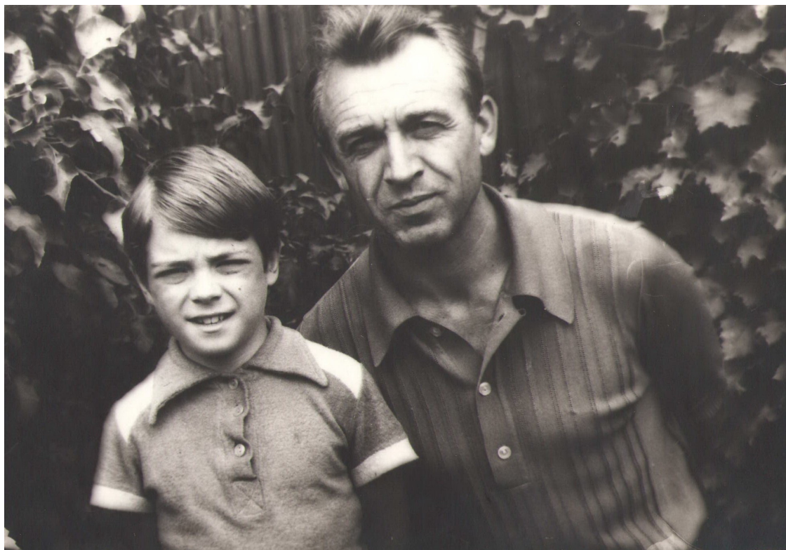
Я с папой в саду в нашем доме в Урюпинске. Лето 1980 года.