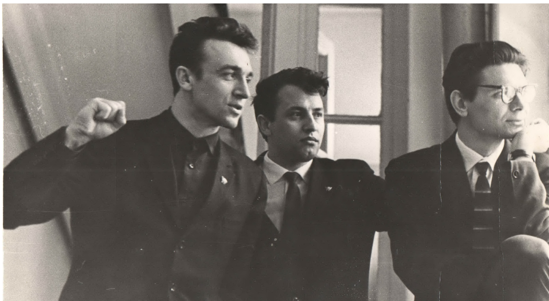
Папа – второй секретарь Волгоградского обкома ВЛКСМ, середина 1960-х годов (первый слева).