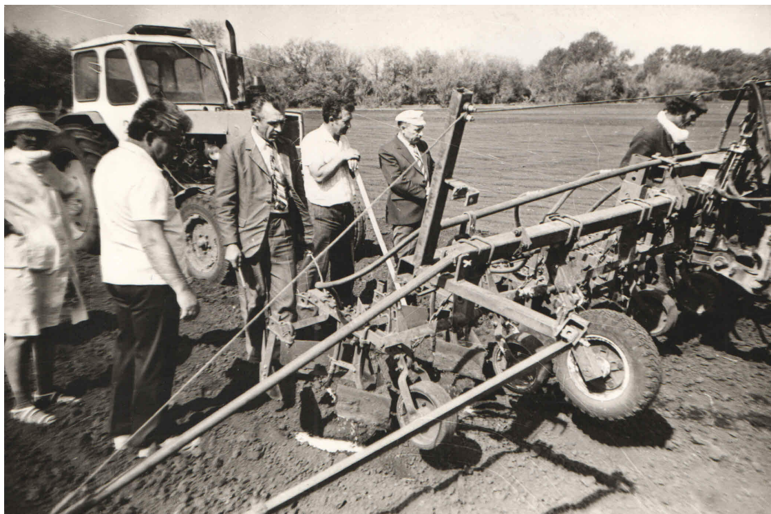
Будни первого секретаря Урюпинского горкома КПСС. Папа в центре за плугом.

мы пили пиво и говорили часами. Нам было интересно друг с другом. Мне было важно понять его переживания тогда, оценки о том времени и о его работе. Папа довольно часто вспоминал эти два пленума – 1975 и 1984 гг. Он как-то мне сказал: «Понятно, что мнение первого секретаря обкома было решающим, но первого секретаря райкома или горкома – члена обкома – нельзя было просто так освободить от работы за конструктивную критику. Тем более, что уставу партии это не противоречило и формально ты ничего не нарушал. Но были, конечно, неписанные правила... Ты знаешь, меня иногда просто брала злость на неприкрытый идиотизм, и я выступал – как мог максимально критично».