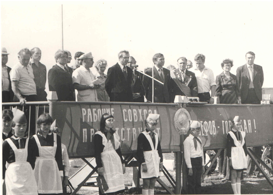
Открытие улицы только что построенных домов хозспособом в одном из совхозов Урюпинского района. Папа у микрофона на трибуне. 1983 год.