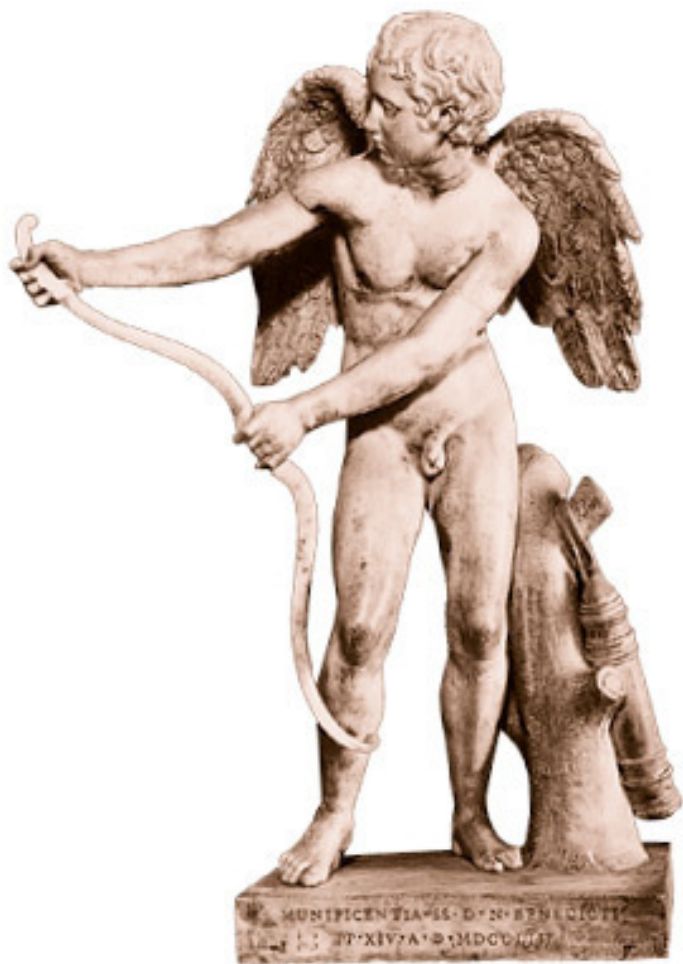
Эрос и его лук