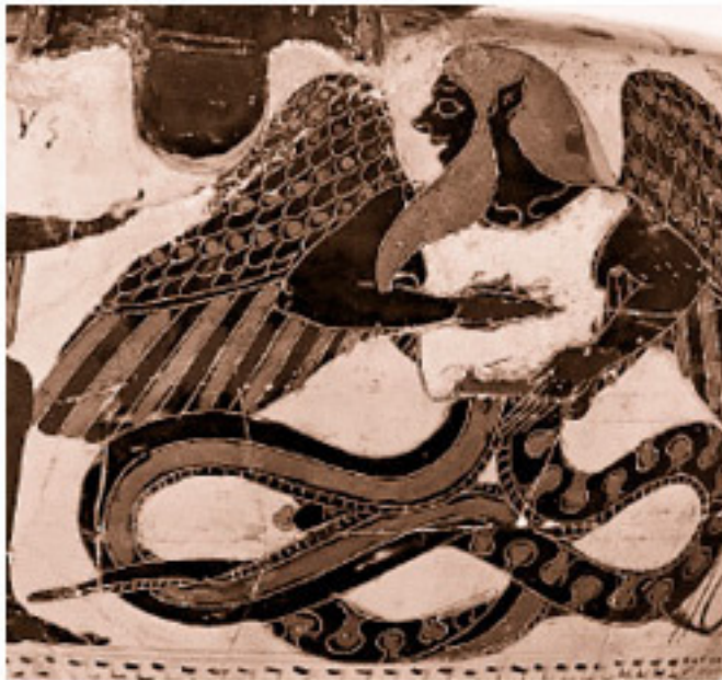
Тифон, пораженный молнией Зевса (деталь)