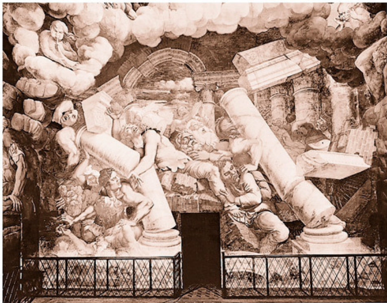
«Война на небесах»: фреска Джулио Романо

Последним и самым страшным соперником, бросившим вызов власти Зевса, стал Тифон – стоглавый, ураганный, дышащий огнем. Тифон был младшим сыном Геи, и ему почти удалось обеспечить силам беспорядка и тьмы победу. Но Зевс поразил Тифона молниями, которые сделали для него циклопы, и сбросил его на землю, под гору Этна на Сицилии. Отсюда Тифон все еще время от времени изрыгает