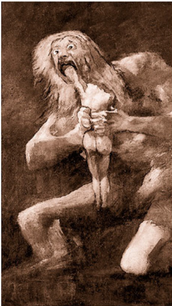
Кошмарное изображение Кроноса у Гойи