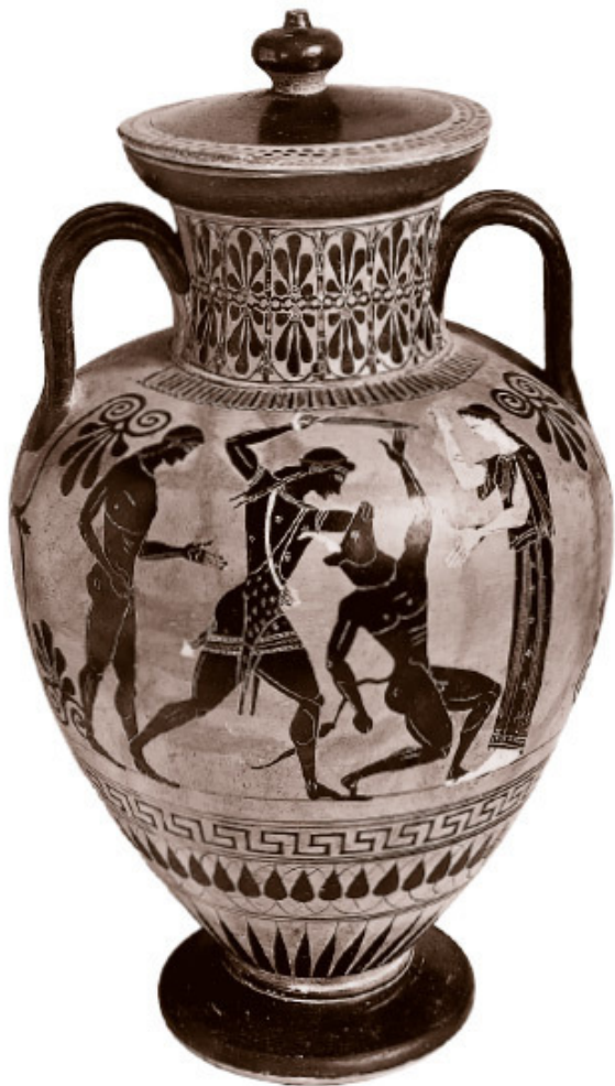
Тесей убивает Минотавра