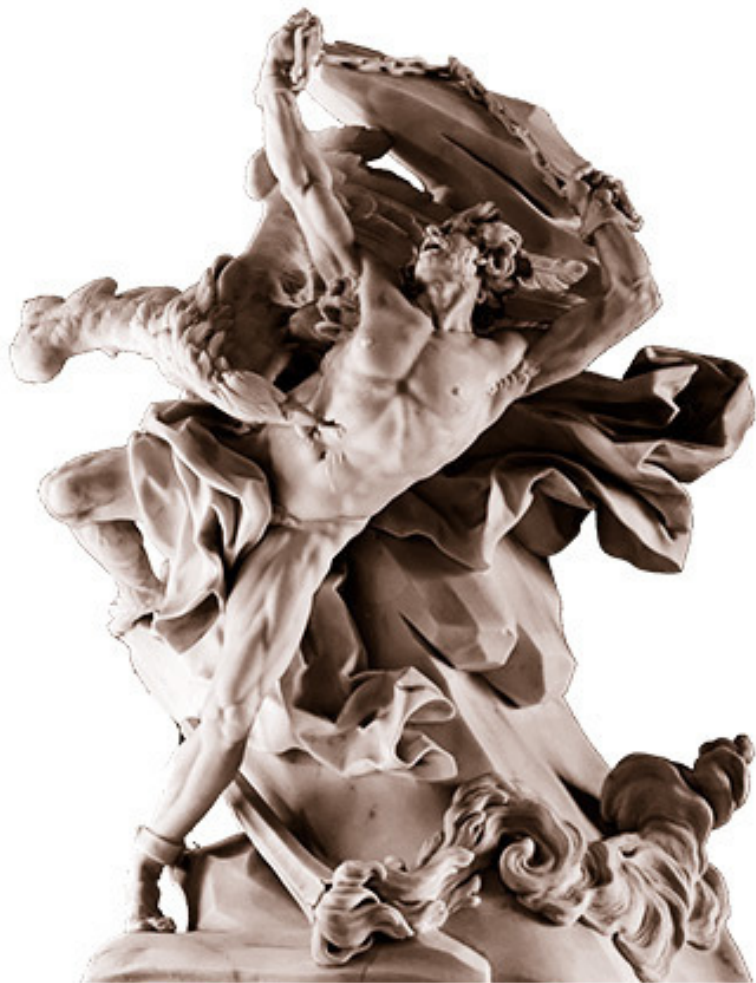
«Закованный Прометей»: над этой скульптурой Адам ра-