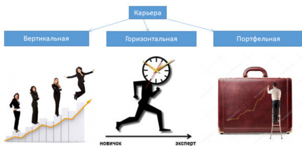
Рисунок 2. – Виды карьеры

Эксперты в сфере управления персоналом выделяют три вида карьеры (они характерны для любой профессиональной сферы): вертикальная, горизонтальная и портфельная (см. рисунок 2).