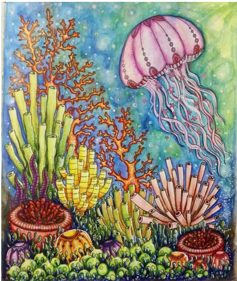
рис. Ханни Карлзон

На морском дне было темно и холодно, поэтому, немного