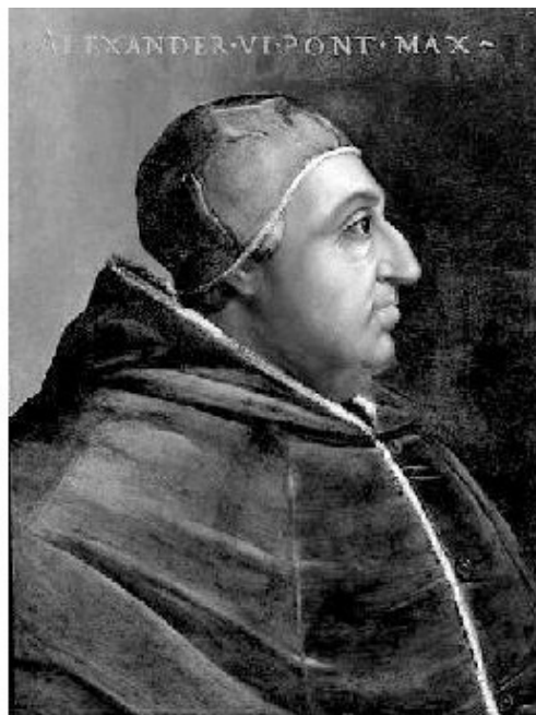
Папа Александр VI