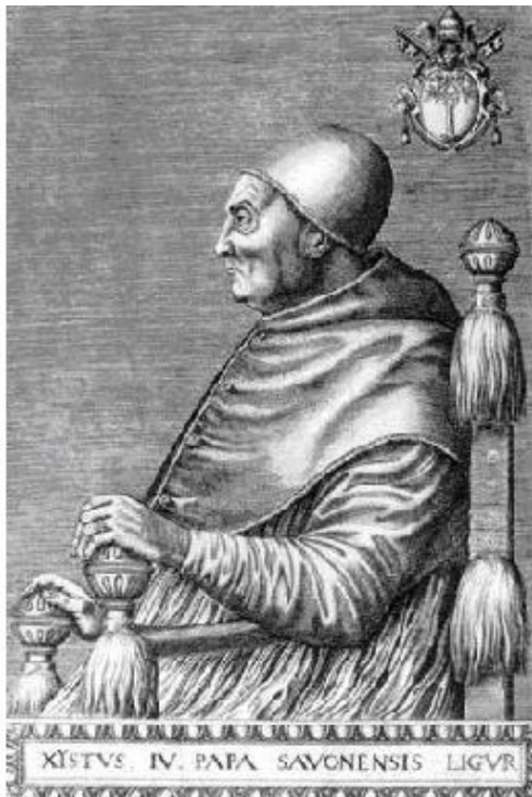
Сикст IV (Гравюра из коллекции Онуфрио Панвинио, 1568)

После этого Родриго широко расправил плечи и вышел из комнаты, где лежал умерший. Всем вдруг показалось, что он внезапно вырос. Его глаза сверкали победным огнем.