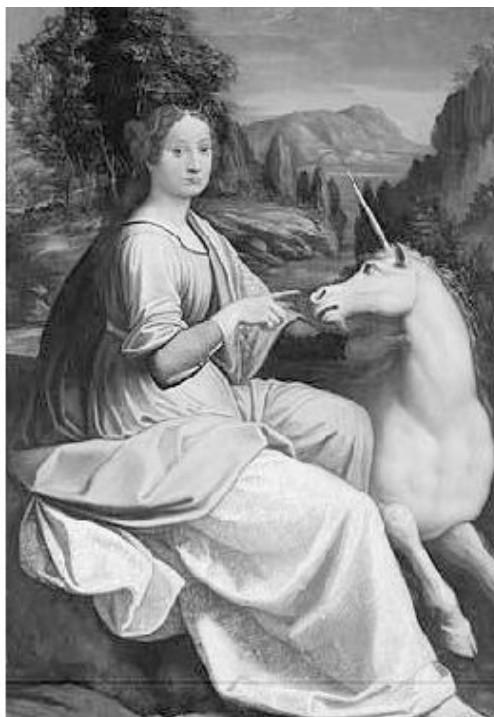
Женщина с единорогом (Лука Лонги, предполагаемый портрет Джулии Фарнезе)

Сам же Александр Борджиа потерял веру в мандрагору и решил в будущем верить только в себя самого.