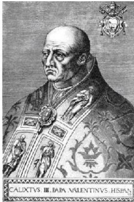
Каликст III ( Гравюра из собрания Онуфριο Панвинио, 1568 )

Родриго Борджиа приблизился к нему на шаг, так что тот почти испугался.