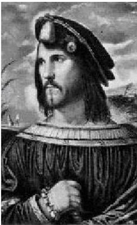
Чезаре Борджиа в Каррара (приписывается Джорджоне)

Папа был в восторге. Он одержимо захлопал в ладоши, а за ним и все трибуны взорвались аплодисментами.