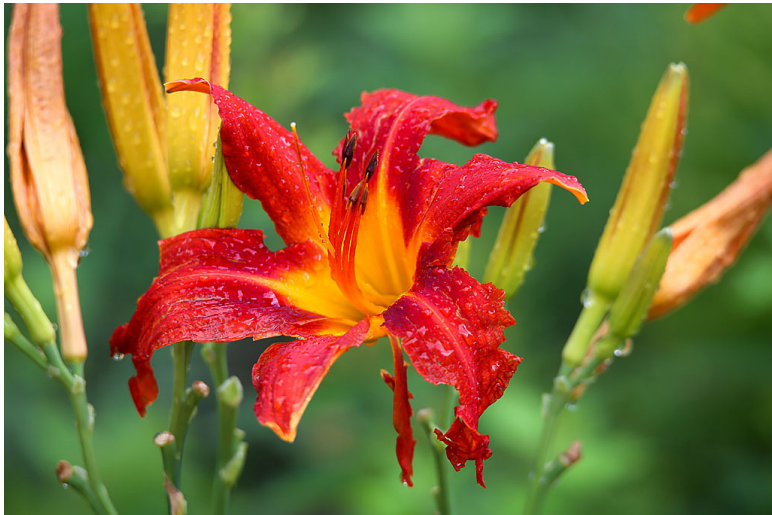
Фото 15, 16 и 17.