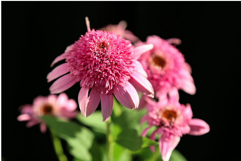
Фото 9 и 10. Максимальное приближение к цветку.