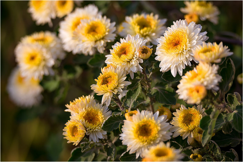
Фото 13 и 14.

резкости. Результат может выглядеть впечатляюще (фото 13,14).