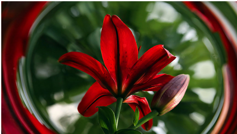
Фото 21. Отражение красной лилии в черной глянцевой тарелке.

Я и моя тень – съемка в помещении. Красный амариллис, который расцвел в горшке на подоконнике, я установила на столе напротив однотонной бежевой стены у себя на кухне. Взяла обычный фонарик и навела луч света на цветок. Свет от фонаря сделал цветок объемным и создал интересный художественный эффект с тенью. Объектив 24-105 мм, ISO 400, f/4, 1/60 с. Эти настройки для данной фотографии. Они зависят от освещения в комнате, а так же насколько чётким вы хотите получить фон на фотографии. Чем ближе источник света к объекту, тем жёстче получаются тени (фото 22).