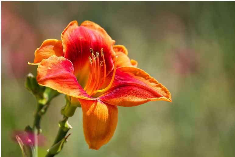
Фото 7 и 8. Съемка телеобъективом, размываем задний фон.