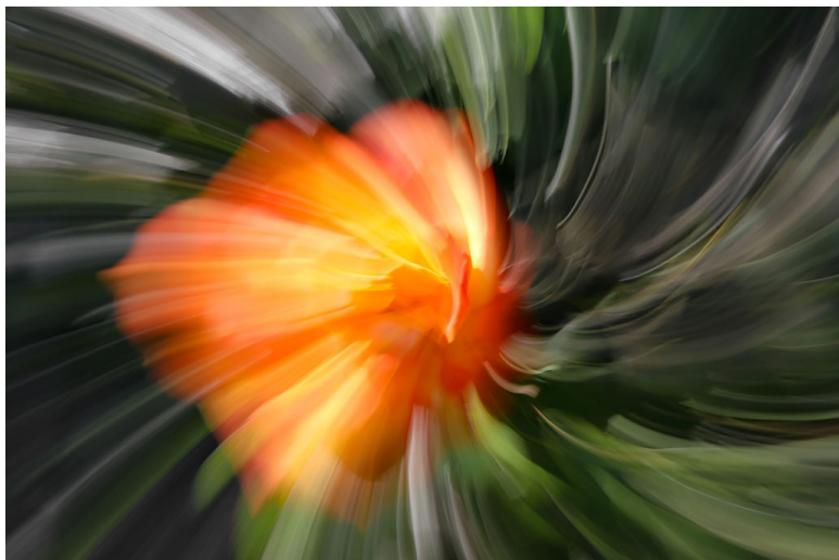
Фото 19. Динамичная роза.

мм. Т. к. выдержка 1/8 с, проделывала это очень быстро. Без использования штатива.