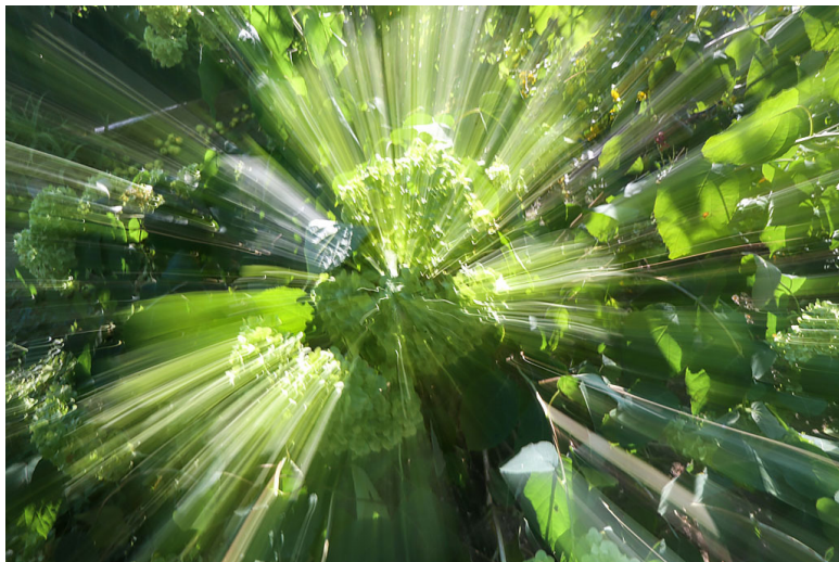
Фото 20. Взрывная гортензия.

Интерес состоит в том, чтобы получить абстрактную фотографию цветка без вмешательства графического редактора. Проявить свою фантазию, а так же узнать технические возможности камеры, ну и, конечно же, похвастаться результатом перед друзьями.