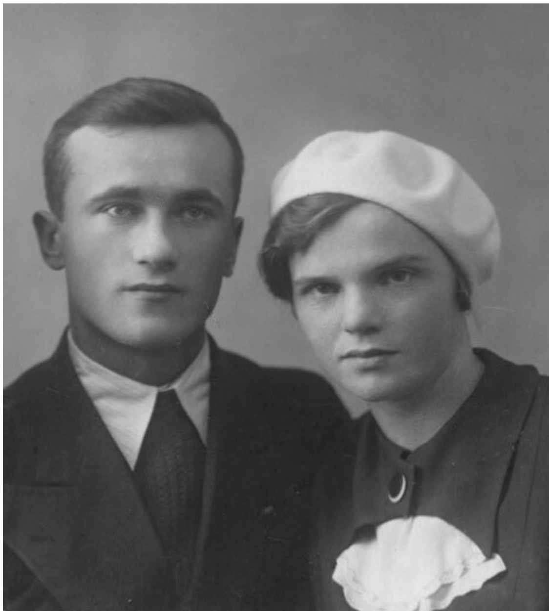
Мама с отцом. Молодые специалисты. 1940 г.