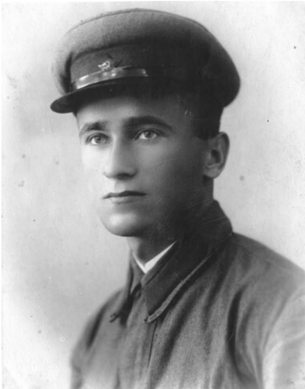
Отец – рядовой 674 СП 150 СД 1941 г.

жителей местечка Белгородка Изяславского района Каменец-Подольской, ныне Хмельницкой, области. Сообщил адрес: Действующая Кр. Армия, военно-почтовая сортировочная база «Т», полевая почтовая станция № 73, 674 стр. полк. Комендантский взвод. Больше писем не было. За время Войны 150 стрелковая, пережила второе и третье формирования, заслужила орден Кутузова II степени и почетное наименование Идрицкая. Бойцы дивизии – по официальной версии Егоров и Кантария, водрузили над Рейхстагом Знамя Победы. Дошел ли до Берлина кто-нибудь из бойцов 1-го формирования, не известно.