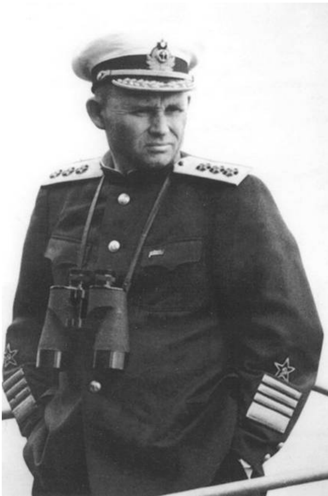
Командующий Черноморским флотом в 1939–43 и 1944–48 гг. Ф.С. Октябрьский