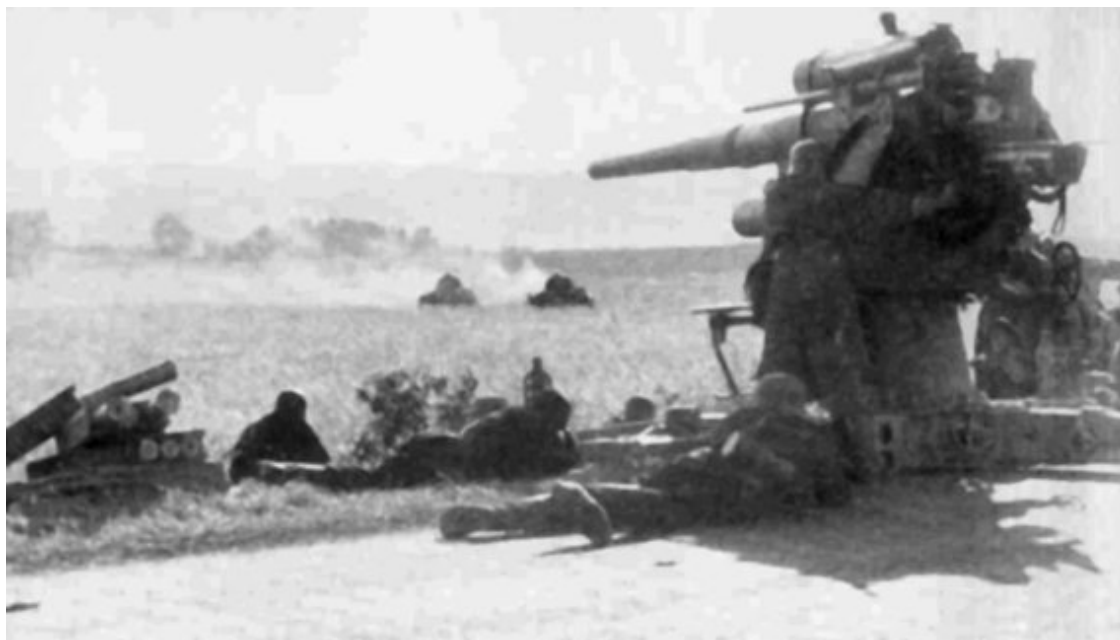
Немецкое 88-мм зенитное орудие ведет огонь по советским танком в районе Расейняй – Василишкис

Как бы там ни было, стреляли немцы с достаточно близкого расстояния и весьма точно. Огонь был метким, удалось добиться восьми попаданий. И когда уже казалось, что все кончено, орудие танка медленно повернулось, тщательно прицелилось и методичным огнем уничтожило обе новенькие пушки. При взрыве боеприпасов, сложенных у одного из орудий, погибло два артиллериста, один был ранен.