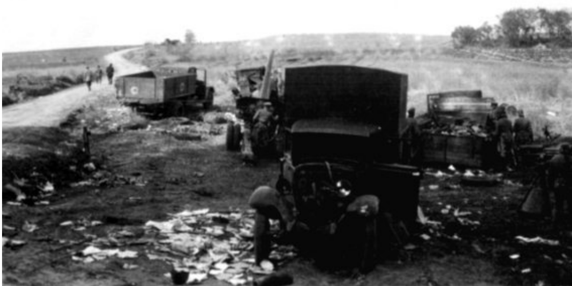
Разбитые советские грузовики в районе Расейня