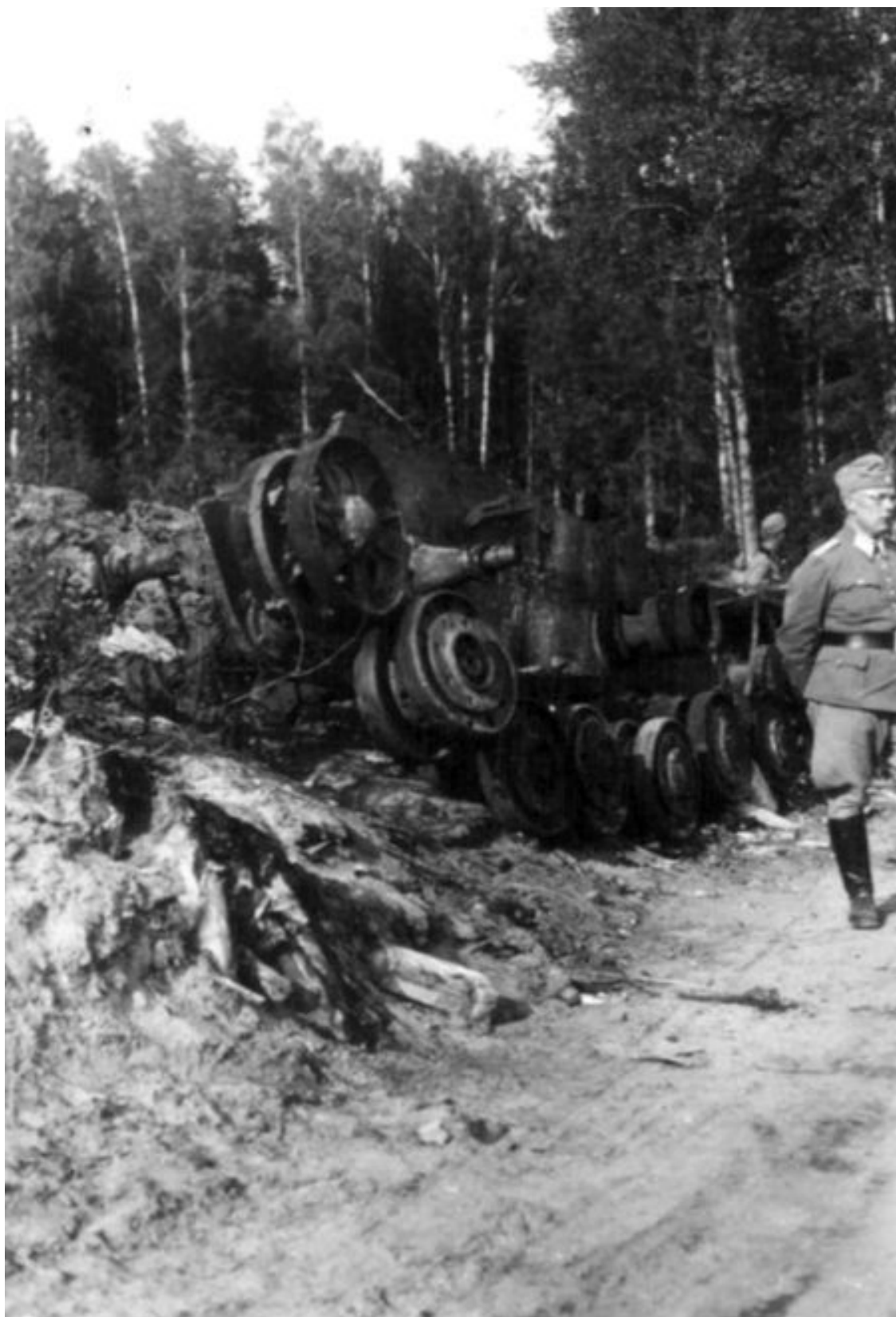
Еще один КВ, уничтоженный в районе Расейня