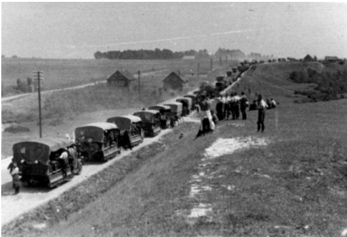
Немецкая автомобильная колонна в районе Расейня

Плетенберга, умерли, не получив вовремя необходимой помощи. Со стороны Расейня также остановилась колонна грузовиков с боеприпасами и продовольствием. Несколько из них (большинство авторов упоминает 12, в журнале боевых действий говорится о двух) танк уничтожил огнем своего орудия. Попытки объехать танк полями также не удались. Объезжая с одной стороны, автомобили застревали в песке, по другую сторону дороги местность была заболоченной, поэтому здесь объехать было вообще невозможно. Требовалось срочно изыскать средства для устранения преграды.