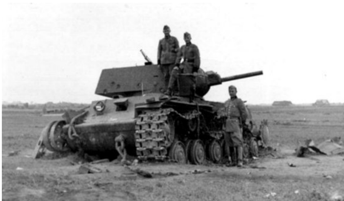
Подбитый советский танк КВ.

На этом можно было бы закончить нашу историю, однако остается один невыясненный вопрос – какова была модель танка? Все исследователи соглашались с тем, что это была машина КВ. Но, как мы знаем, в начале войны на вооружении Красной Армии находились танки КВ двух модификаций: КВ-1 и КВ-2. Вот тут мнения разделяются. Аргументы за то, что это был КВ-1, следующие: так танк называет в своих мемуарах Э. Раус; силуэт КВ-1 выбит на памятной доске у могилы танкистов в Расейняе на воинском кладбище; КВ-1 имел значительно больший, чем у КВ-2, боекомплект – а ведь одиночному танку, как мы знаем, пришлось немало стрелять, уже стоя на дороге, да и в бою, произошедшем до этого, его пушка тоже наверняка, не молчала.