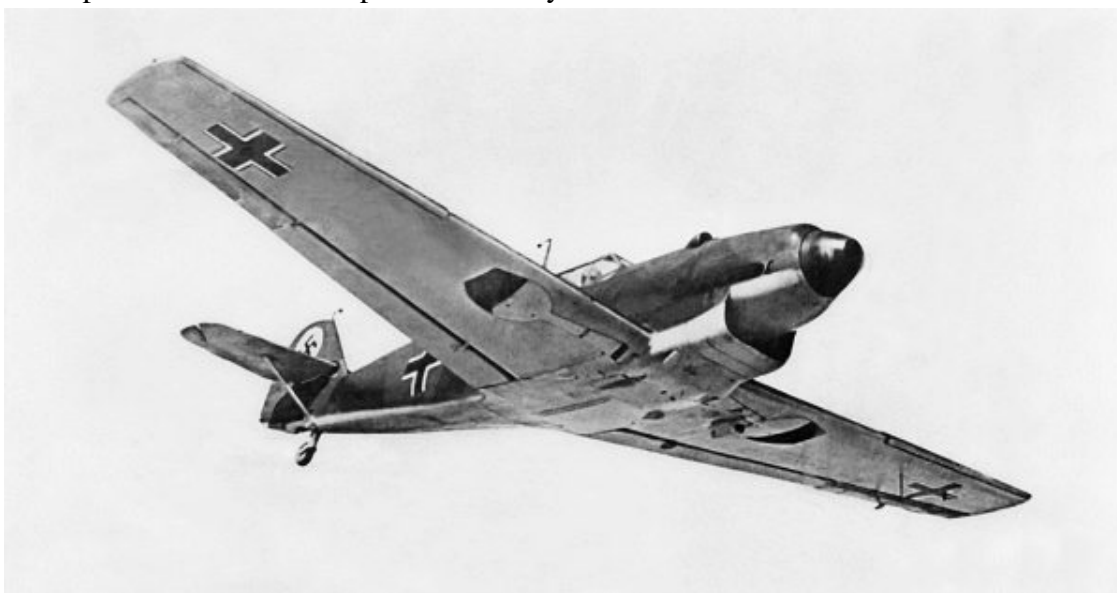
Истребитель «Мессершмитт» Vf 109В

Первые наброски будущего истребителя ЛаГГ-3 были сделаны, как вы уже знаете, предположительно в конце 1938 года, когда стали известны результаты исследований в СССР немецкого истребителя Vf 109В. Появление самолета в Советском Союзе связано с гражданской войной в Испании, когда в самый ее разгар на территории, контролируемой республиканцами, произвели вынужденные посадки два (как минимум) Vf 109В, построенных в 1937 году. Один из них со временем передали в Советский Союз. Но прежде самолет обследовали испанские специалисты: на заводе компании «Испано-Сюиза» «сняли» характеристики мотора Jumo-210 и совершили во Франции пять полетов общей продолжительностью 3 часа 45 минут. Лишь в марте 1938 года «мессершмитт» поступил в НИИ ВВС.