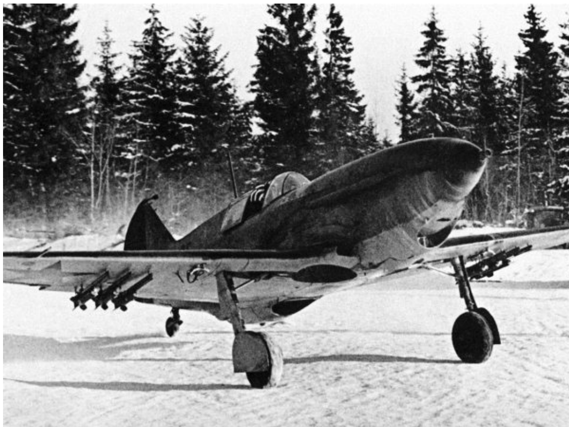
ЛаГГ-3 с реактивными снарядами РС-82 под крылом