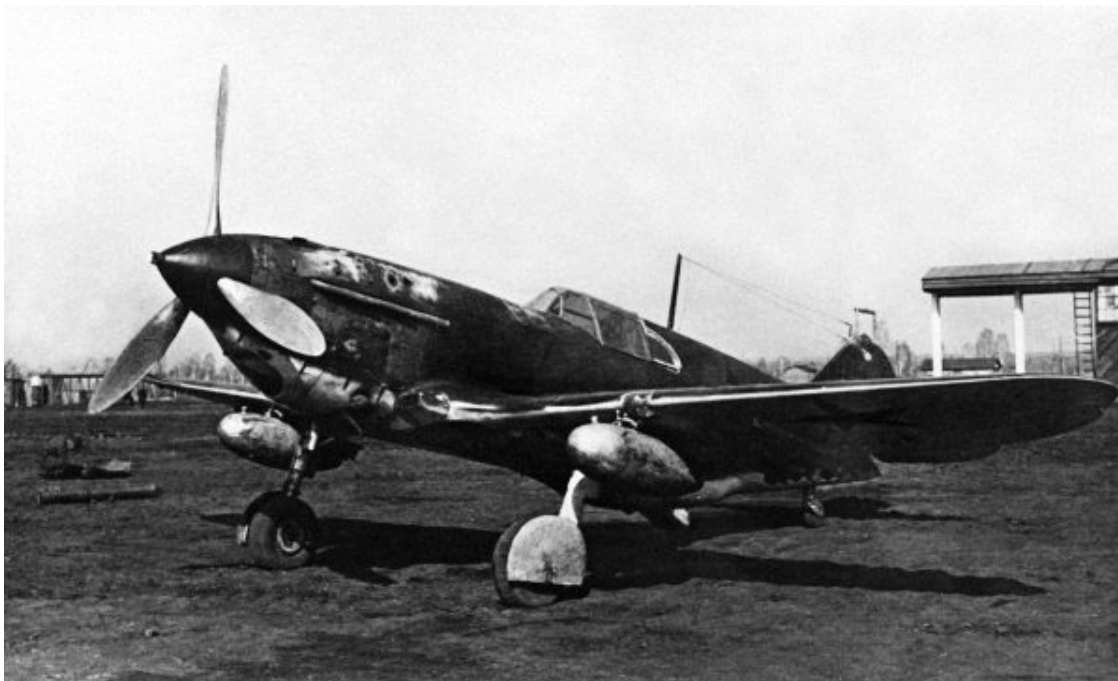
ЛаГГ-3 с подвесными топливными баками