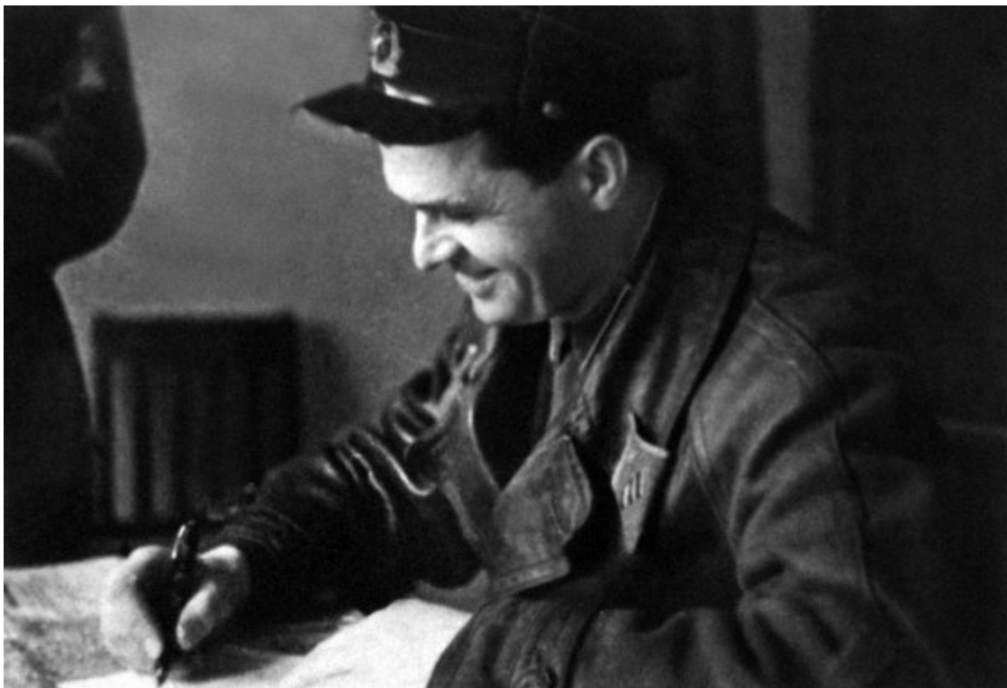
Летчик-испытатель НИИ ВВС С.П. Супрун

Такая комбинация конструкционных материалов и дала выигрыш в весе истребителя. Внесло свою лепту и крыло (сэкономили около 50 кг), которое вопреки требованиям ВВС сделали неразъемным. Последнее обстоятельство не позволяло перевозить «яки» по железной дороге, а в случае аварийной посадки и перевозки поврежденной машины на большие расстояния требовало более значительных усилий наземных специалистов. Да и вооружение И-26 было слабее.