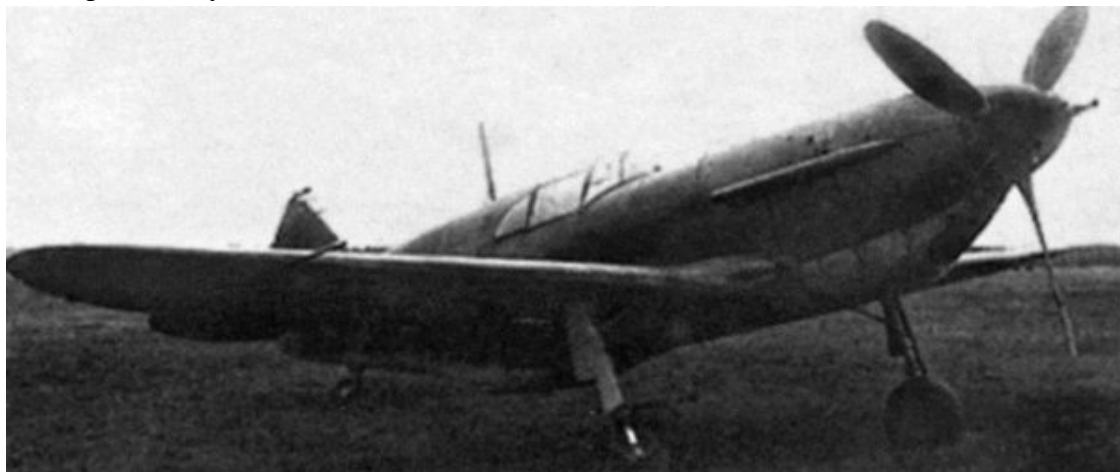
ЛаГГ-3 с пушкой НС-37