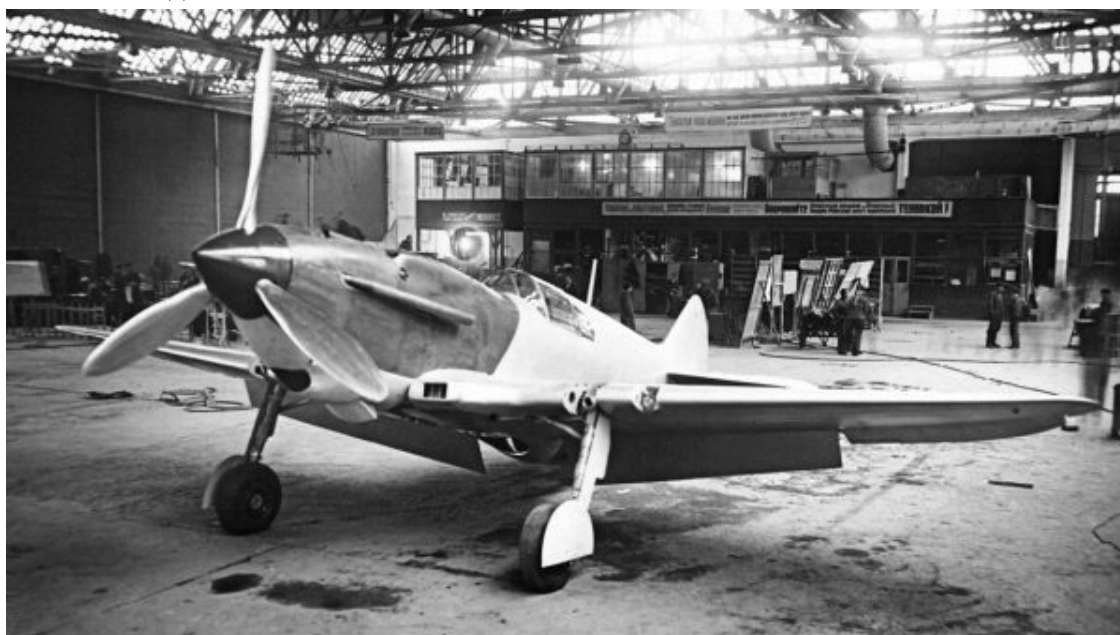
Первый, еще не окрашенный ЛаГГ-3 в сборочном цехе завода № 31

Первым осваивать серийное производство И-301 начал ленинградский завод № 23, куда, как уже говорилось, направили Лавочкина. На декабрь 1940 года предприятию запланировали построить пять истребителей ЛаГГ-1. Но серийные машины стали покидать заводские цеха лишь в следующем году и в варианте ЛаГГ-3. До эвакуации ленинградцы смогли сдать заказчику лишь 65 истребителей. С января 1941 года производство ЛаГГ-3 развернулось заводом № 21 в Горьком, ставшем головным, через месяц к выпуску истребителя подключились заводы № 31 в Таганроге и № 165 в Ростове, а с мая и 153-й завод в Новосибирске. В марте нарком Шахурин предложил развернуть изготовление ЛаГГ-3 на заводе № 600 в Китае, но по непонятным причинам эта идея не нашла поддержки в правительстве. В 1942 году производство, параллельно с ремонтом ЛаГГ-3, освоил и 301-й завод. А дельта-древесину изготавливали восемь заводов.