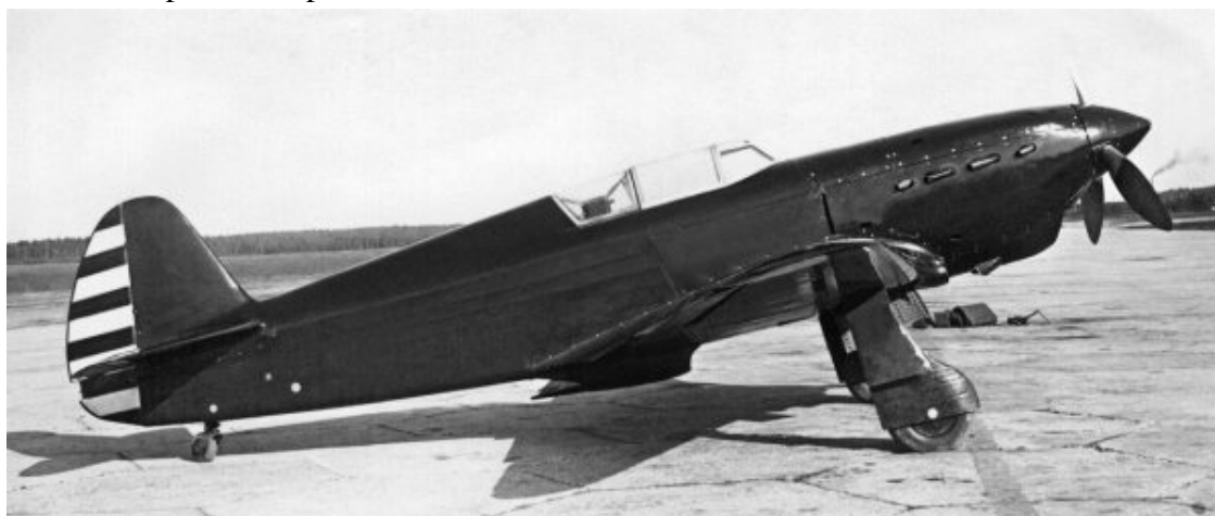
Истребитель И-26 (Як-1)

Чтобы понять события, происходившие на заводе № 21 с конца 1930-х годов, следует сделать небольшой экскурс в историю предприятия. Долгие годы ОКБ-21, дислоцировавшееся на территории серийного завода № 21, возглавлял Н.Н. Поликарпов. В 1939 году, несмотря на неудачи с истребителем И-180, начали строить три его эталона, необходимые для серийного производства. Эта машина, фактически ставшая развитием И-16, была приспособлена под технологический процесс Горьковского завода.