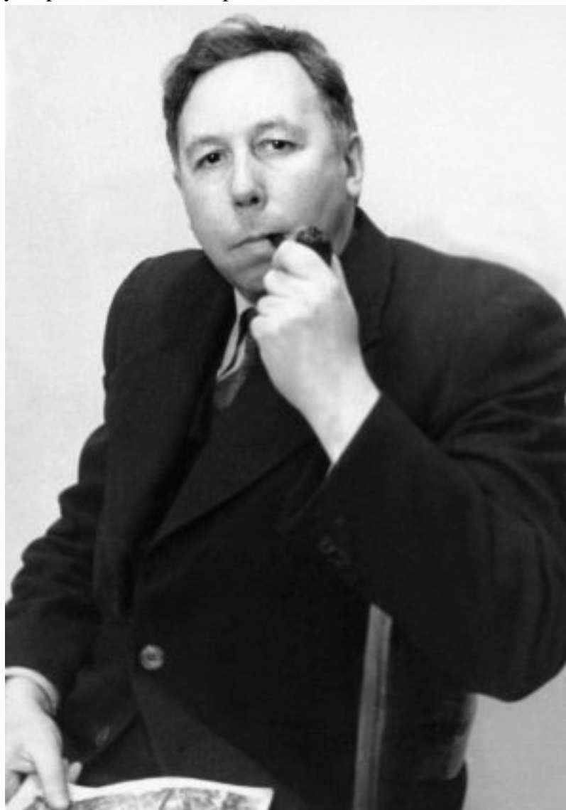
Семен Алексеевич Лавочкин

Пожалуй, одним из самых привлекательных экспонатов музея ВВС, расположенного в подмосковном Монино, по праву считается самолет-истребитель Ла-7 трижды Героя Советского Союза И.Н. Кожедуба. На эту машину-легенду, созданную под непосредственным руководством С.А. Лавочкина, нанесены ряды красных звездочек, каждая из них означает победу над противником. Ла-7 по своим летным данным и вооружению по праву считается одним из лучших истребителей Второй мировой войны. Но мало кто догадывается, что от первых замыслов конструктора до создания истребителя Ла-7 лежит дистанция длиной в пять лет.