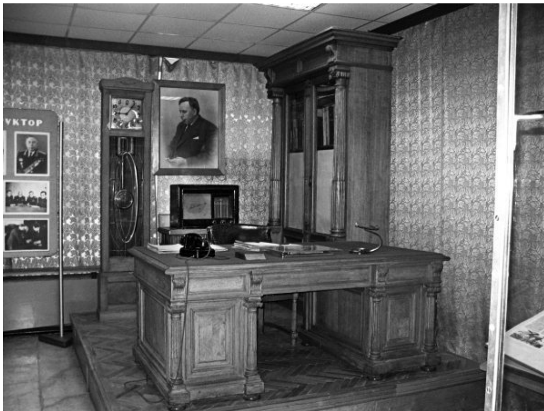
Фрагмент рабочего кабинета С.А. Лавочкина в музее НПО имени С.А. Лавочкина

После перевода БОКа в Смоленск Лавочкин оказался у Д.П. Григоровича, а затем, в 1935 году, – в подмосковных Подлипках «под крылом» создателя динамо-реактивных пушек Л.В. Курчевского. Об этом периоде деятельности Лавочкина следует рассказать подробнее, поскольку он впервые стал главным конструктором завода № 38, но не авиационного, а... артиллерийского.