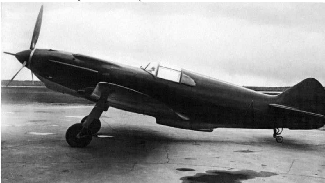
Истребитель К-37 с пушкой калибра 37 мм, переделанный из ЛаГГ-3 завода № 23