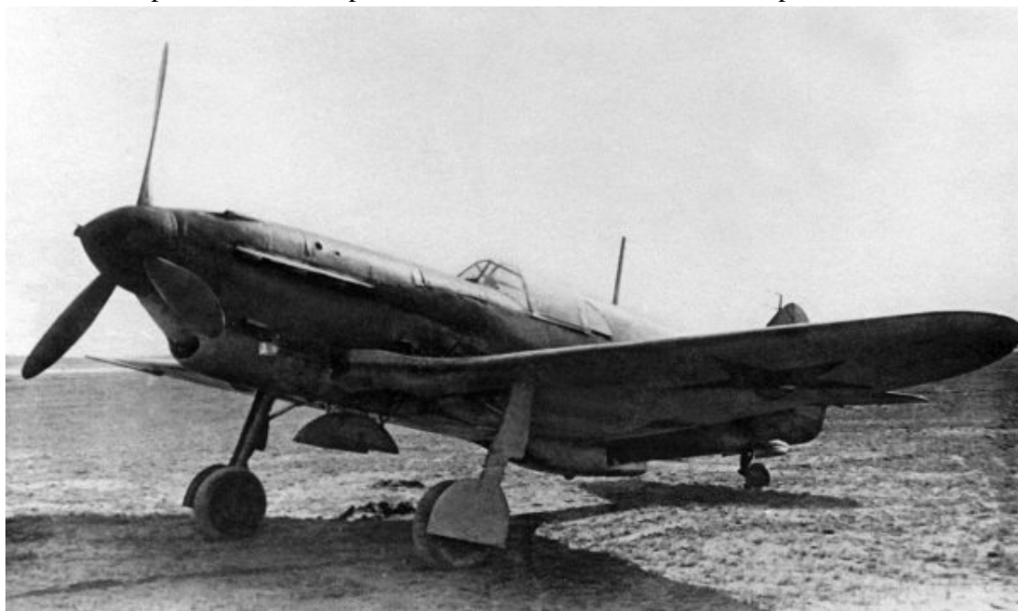
ЛаГГ-3 первых серий с убирающимся хвостовым колесом