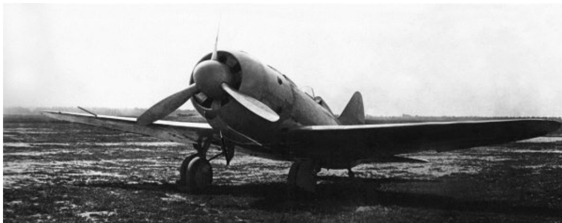
Опытный истребитель И-180

Высотный ЛаГГ-3 построили к лету 1941 года, но испытания его сопровождали неудачи, а тут – война. Двадцать восьмого июня заместитель наркома авиационной промышленности предложил начальнику ЛИИ М.М. Громову отправить эту машину для окончания летных испытаний на завод № 21.