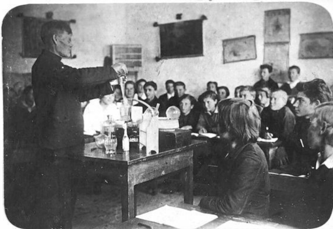
Дети трудпоселенцев на уроке химии в Новосёловской семилетней школе. Нарымский край

Тем не менее, процесс освобождения бывших кулаков продолжался. Так, как видно из приведённых таблиц, в 1934–1938 гг. 31 515 человек были освобождены как «неправильно высланные», а 33 565 – переданы на иждивение. Тысячи людей были освобождены в связи с направлением на учебу, вступлением в брак с нетрудоселенцами и по другим причинам.