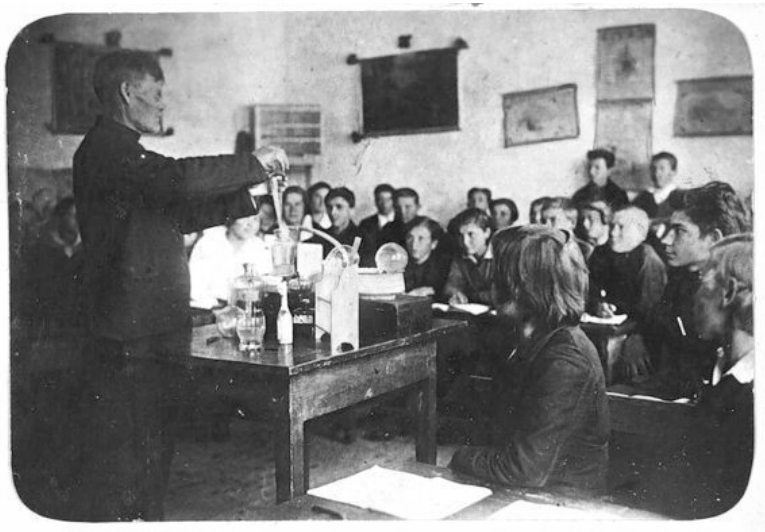
Дети трудпоселенцев на уроке химии в Новосёловской семилетней школе. Нарымский край

в 1934–1938 гг. 31 515 человек были освобождены как «неправильно высланные», а 33 565 – переданы на иждивение. Тысячи людей были освобождены в связи с направлением на учебу, вступлением в брак с нетрудноселенцами и по другим причинам.