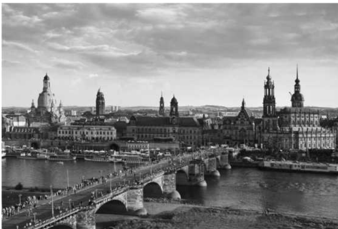
Дрезден, «Флоренция на Эльбе»