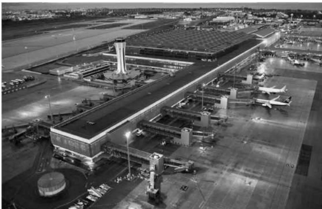
Аэропорт Малаги «Коста дель Соль»

Через несколько дней, ближе к обеду, с инвалидной тростью в правой руке, целлофановым пакетом в левой и небольшой, но достаточно дорогой барсеткой на перевес, где была ксива и лопатник – этакий поросенок 36 , забитый до предела, я спускался по крытому трапу, который был только что доставлен к брюху пузатого Boeing 747 в аэропорту Малага Коста дель Соль. Андалусия встречала пассажиров легким ветерком, от чего выглянувшее из-за горизонта солнце не доставляло дискомфорта. Воздушная гавань оказалась большим аэропортом (четвертый по своим размерам и пропускной способности самолетов в Испании) и находилась в 8 километрах от города Малага.