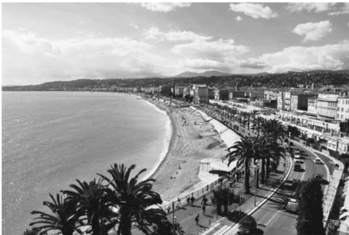
Ницца, Лазурный берег

За окном нашего выдавшего вида Volkswagen'a стояла весна – самое замечательное время для посещения Ниццы. Именно в это время здесь не сильно жарко и не холодно, приятная температура и фантастический воздух. Именно в это время в Ницце мало туристов, обычно основная масса туристов приходится на лето, но все зависит от того, с какой целью вы сюда приехали. Ницца – это невероятный, красивейший курорт Лазурного берега юга Франции. Здесь интересная архитектура, прекрасные виды и море – синее-синее, как в песне, вот только пляж, увы, каменистый. Манул уже бывал в этих местах, поэтому, поставив машину на стоянку, мы поднялись на холм Шато – потрясающую смотровую площадку, откуда открывается вид на весь город, – уютно расположились в кафе и просто молча созерцали окружающее нас великолепие. Быть в Ницце и не быть на этом холме равносильно тому как быть в Париже и не побывать на Эйфелевой башне.