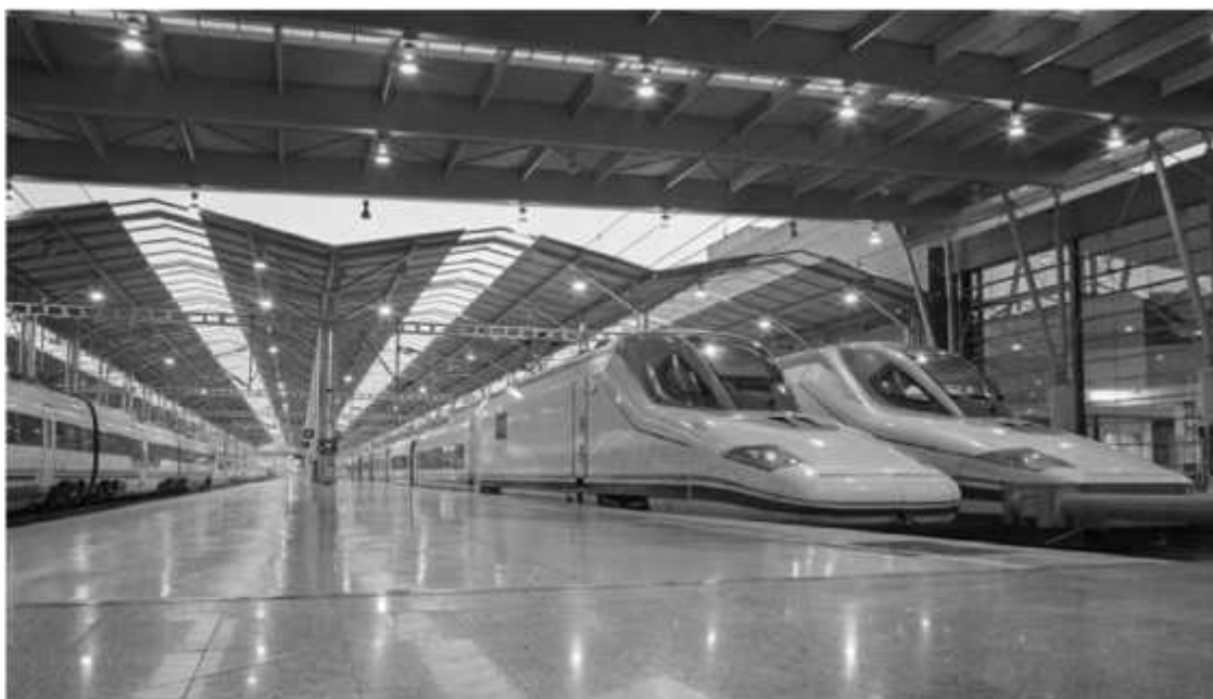
Вокзал Malaga Maria Zabrano

В то время не было интернета в том виде, который существует сегодня, поэтому точно знать что, где, как и почему я не мог, довольствуясь лишь скухими рассказами Жофрея. Но многолетняя практика подобного рода походов сразу раскрывала предо мной завуалированные особенности, независимо от того, был ли это аэропорт Коста дель Соль или Пулково. Проще сказать, все аэропорты мира по своей сути одинаковы. Главное было на лицо: consigna, то бишь камеры хранения багажа, в аэропорту не было. Не скрою, такое я встречал впервые. Но уже непосредственно в Малаге, не на станции электричек, куда я прибыл примерно через час после прилета, а именно на ж/д вокзале Malaga Maria Zabrano , где ходили междугородние поезда, они имелись. Но и здесь были свои особенности. Камеры хранения на многих вокзалах в Испании служат для хранения вещей лишь в течение текущих суток. После 12 часов ночи надо или оплачивать хранение заново, или забирать вещи. Никто дольше этого времени ваши вещи хранить не будет. Кстати, там на ячейках об этом написано. На испанском, я, естественно, прочесть не мог, но, как говорят у нас в России, «язык до Киева доведет».