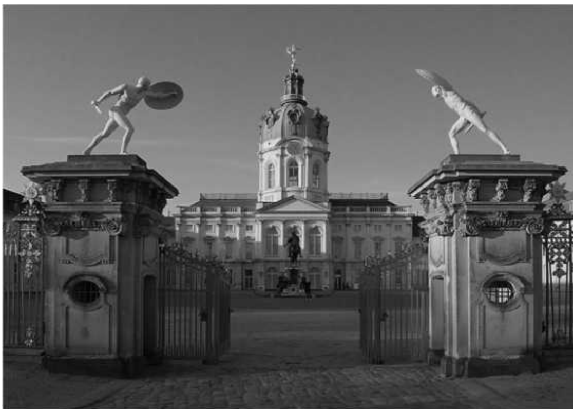
Берлин, замок Шарлоттенбург

За многие годы скитаний, отсидок, лежа на больничных койках и в иных жизненных обстоятельствах я иногда шел на разного рода авантюры, которые в большинстве своем предполагали преодоления поставленных задач, порой даже немислимых. И во всех случаях я всегда шел до конца. В большинстве своем проигрывал схватку с жизнью, но шел до конца. У меня были хорошие учителя в раннем возрасте, которые говорили: «Лучше иди до конца и проиграй, зато потом, лежа на нарах, на больничной койке или на смертном одре наконец, ты не будешь мучиться вопросом «а вдруг?..», «а если?..», «а может быть?..» и им подобными». Так что и в этот раз я решил рискнуть и снова не пожалел об этом, оставалось только посмотреть на конечный результат. И он не заставил себя ждать слишком долго. Не буду описывать во всех деталях свои действия, но в общих чертах все же поясню.