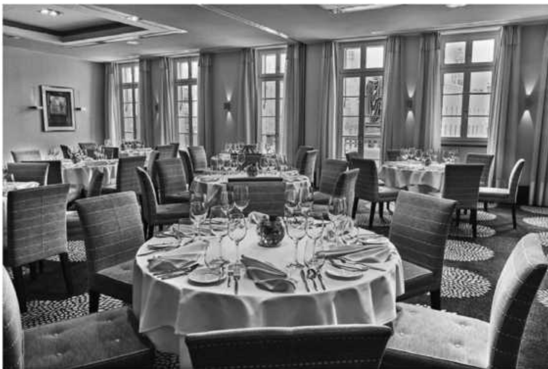
Дрезден, Restaurant Steigenberger Hotel de Saxe