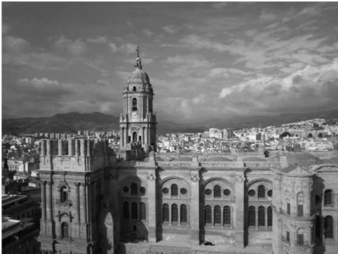
Кафедральный собор Малаги