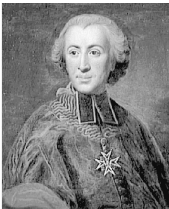
ЭТЬЕН ШАРЛЬ ДЕ ЛОМЕНИ ДЕ БРИЕНН. Портрет кисти Ж.Б. Дена

Вместо Калонна король поставил во главе правительства одного из главных его критиков – председателя собрания нотаблей, архиепископа Тулузы Этьена Шарля де Ломени де Бриенна. Выходец из старинного дворянского рода, Ломени де Бриенн избрал в юности духовную карьеру и теперь, в свои шестьдесят лет, принадлежал к числу высших иерархов католической церкви Франции. Это, впрочем, ничуть не мешало ему дружить с философами Просвещения и быть сторонником веротерпимости. Не принимая предложенный Калонном план преобразований, Ломени де Бриенн тем не менее прекрасно понимал, что фискальная система государства нуждается в серьезной модернизации. Отказавшись от идеи натурального налога, вызывавшей наибольшую критику, он предложил собранию нотаблей одобрить всеобщий поземельный налог в денежной форме. Нотабли новый налог не приняли, сослались на свою некомпетентность и посоветовали королю созвать Генеральные штаты, после чего и были распущены.