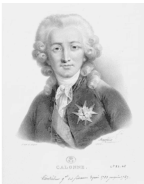
Шарль-Александр де Калонн. Эстамп с портрета кисти Э. Вижье-Лебрён

Точкой отсчета тут можно считать август 1786 года, когда возглавлявший правительство Шарль-Александр де Калонн познакомил короля с планом реформы, предполагавшей распространение поземельного налога на привилегированные сословия. Потомственный дворянин мантии, Калонн прекрасно проявил себя на различных административных постах, благодаря чему и получил в 1783 году должность генерального контролера финансов – высшую в министерской иерархии того времени. Первое время он, стараясь не раздражать короля, шел по протоптанной Неккером дорожке и покрывал дефицит финансов за счет государственных займов. Людовик XVI, вялый, апатичный и тяготившийся любыми мало-мальски конфликтными ситуациями, опасался резких действий после того, как в 1774–1776 годах финансовые реформы его министра Тюрго вызвали активное сопротивление аристократии с Парижским парламентом во главе. Однако зияющая дыра в бюджете вынуждала Калонна идти на решительные шаги, даже рискуя навлечь на себя ненависть привилегированных сословий.