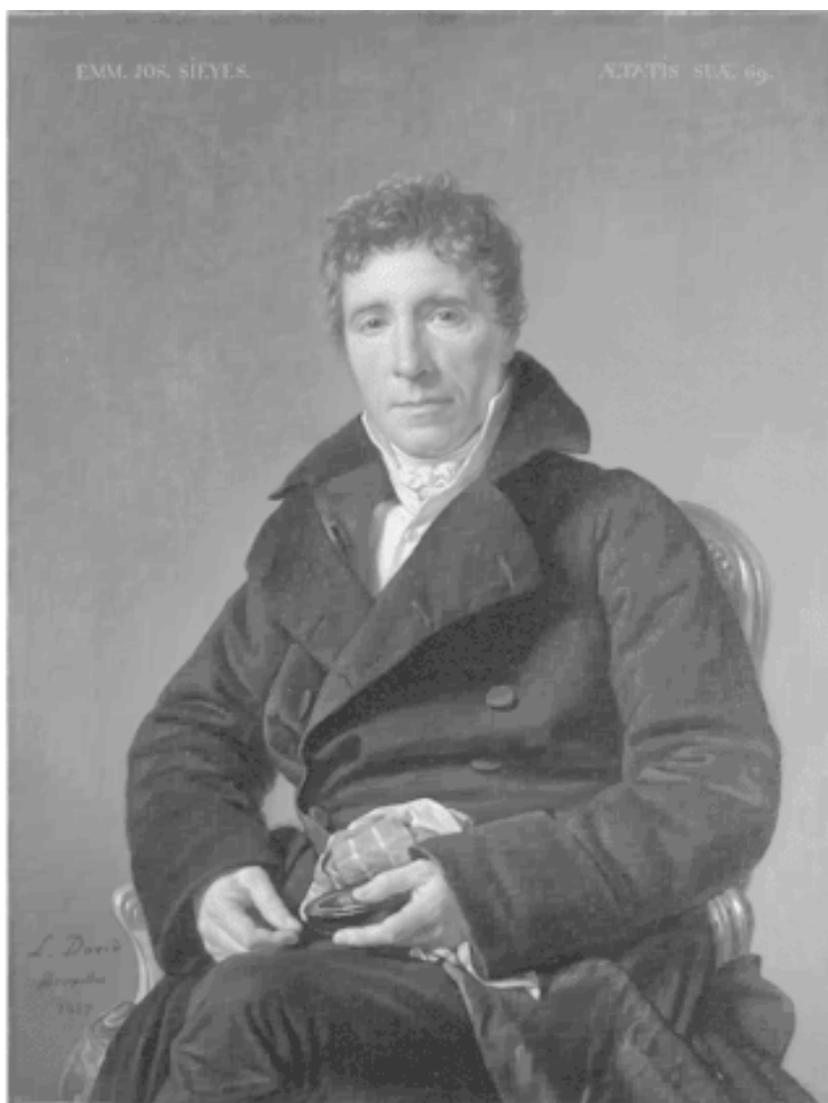
Эммануэль-Жозеф Сийес. Портрет кисти Ж.Л. Давида

«Патриотическая партия» тоже пыталась сыграть на социальном недовольстве и направить его против правительства и старых элит. В январе 1789 года вышел в свет и немедленно получил широчайшую известность памфлет члена Комитета тридцати, аббата Сийеса, «Что такое третье сословие?». На вынесенный в заголовок вопрос автор отвечал: «Всё!» – и далее продолжал: «А чем оно до сих пор было? – Ничем! – А чего оно требует? – Стать хоть чем-то». Несмотря на, казалось бы, скромные претензии, Сийес фактически противопоставил дворян всей остальной нации, отказав им в праве считаться ее частью. Подхватив и развив эту идею, публицистика «патриотов» принялась формировать в общественном сознании образ врага – аристократии, якобы виновной во всех бедах народа и плетущей против него заговор.