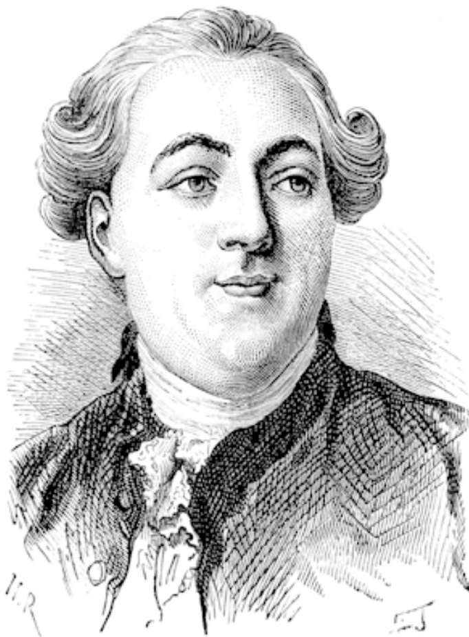
ЖАК НЕККЕР. Гравюра с портрета кисти Ж. Дюплесси

Эта новая оппозиция, отличная от прежней, аристократической, получила у современников название «патриотической партии». Ее неформальным координирующим центром стал так называемый Комитет тридцати, куда вошла целая плеяда ярких личностей, которые сыграют в Революции ведущие роли. «Герой Старого и Нового света», маркиз Лафайет, как уже отмечалось, завоевал огромную популярность, сражаясь добровольцем на стороне американских колонистов против Англии. Аббат Эммануэль Жозеф Сийес к тому времени уже проявил себя способным публицистом. Бонвиван и любимец либеральных салонов, епископ города Отён Шарль Морис Талейран был хорошо известен в свете как вольнодумец и тонкий политик. Советник Парижского парламента Адриен Дюпор проявил себя одним из наиболее активных противников правительства в борьбе судейской корпорации против министров.