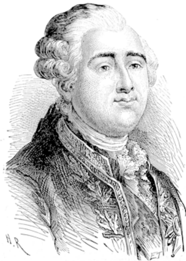
Людовик XVI. Гравюра Э. Тома с портрета работы А. Руссо

примеров заимствований образов и символов Франции конца XVIII столетия самыми разными странами, переживающими в наши дни радикальные перемены, не хватит и книги.