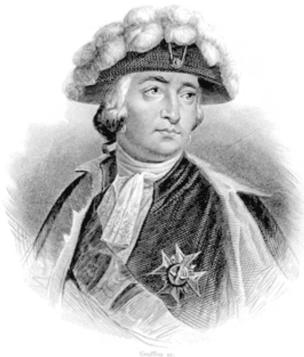
ГЕРЦОГ ОРЛЕАНСКИЙ. Гравюра Ш.М. Жофруа

Активную роль в организации этой памфлетной кампании играло также окружение герцога Филиппа Орлеанского. Этот принц крови имел одно из самых больших состояний во Франции. Принадлежность к правящей династии и богатство обеспечивали ему достаточно высокую степень независимости, чем он и пользовался, открыто фрондируя по отношению к короне. При Людовике XV герцог вслух порицал «революцию Мопу», за что был сослан в свое поместье. При Людовике XVI он в собрании нотаблей обрушился с критикой на Калонна и ратовал за созыв Генеральных штатов, за что опять отправился в ссылку. С 1771 года Филипп Орлеанский возглавлял «Великий Восток» – конфедерацию масонских лож Франции. Кроме того, вокруг него всегда в поисках заработка крутились многочисленные журналисты и памфлетисты. Через масонские ложи и прессу он мог исподволь оказывать серьезное влияние на общественное мнение. Осенью 1788 года «Орлеанская клика», как недруги обычно называли его окружение, активно агитировала в пользу организации Генеральных штатов на новых принципах.