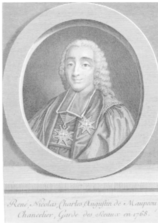
РЕНЕ НИКОЛЯ ДЕ МОПУ. Гравюра XVIII в.

Взошедший на трон внук покойного короля, 20-летний Людовик XVI не имел ни малейшего представления о том, как вести государственные дела, поскольку дед его к ним не допускал. Однако молодому королю очень хотелось заслужить любовь подданных, а потому, прослышав, что канцлера Мопу и его реформу очень ругают, он немедленно эту реформу отменил, а канцлера отправил в отставку. Тому ничего не оставалось, как заметить: «Я выиграл для короля процесс, продолжавшийся триста лет. Но если он хочет его проиграть, это его право». Одним росчерком пера юный монарх вернул на политическую арену самого опасного и могущественного противника модернизации государственного строя.