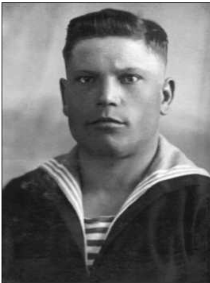
Автомеханик 12-й КОИАЭ