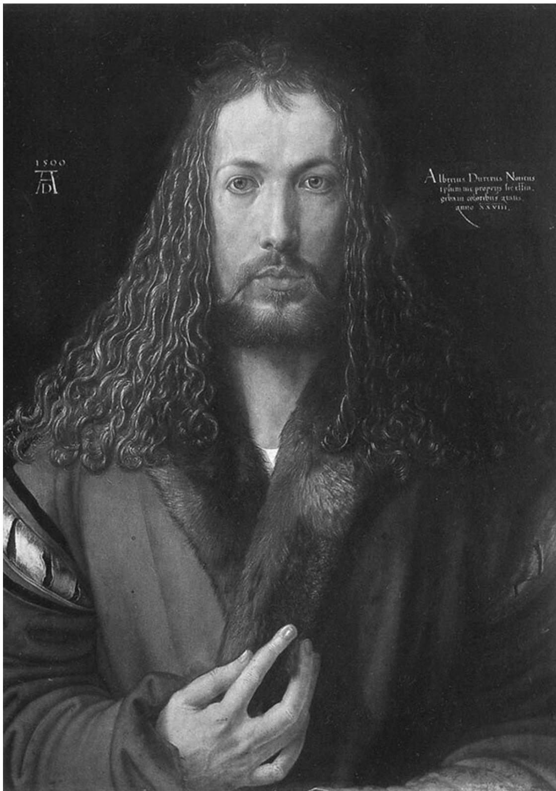
Автопортрет в шубе», 1500 г., дерево, масло, 67х49 см, Старая Пинакотека, Мюнхен