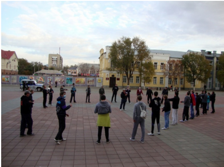
Ноябрь 2011г. забег «РУССКИЕ ЗА ЗОЖ»