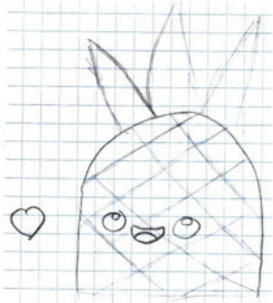
Коала Кола, рыбка Дори и Ананасик