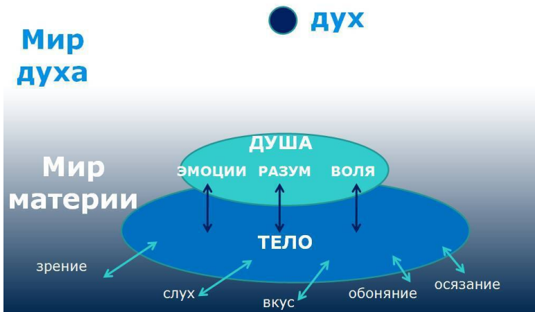
Рис. 1. Невозрожденный человек

Господь решил спасти падшего человека. Что мотивировало Его? Почему Бог еще до создания мира разработал и совершил план спасения? Некоторые думают, что Бог хотел, чтобы Его кто-то любил, но это не так. Троиственный Бог от вечности не нуждался ни в чем, в том числе, в любви и счастье, потому что поток чистейшей любви всегда тек между Отцом, Сыном и Духом. Кроме того, духовный мир наполнен Ангелами – светлыми созданиями, любящими Бога и служащими Ему.