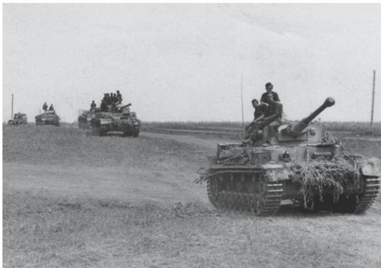
Немецкие танки в выгоревшей летней степи

23 июля в 09:00 (здесь и далее при описании действий немецких войск приводится берлинское время, а советских – московское, на час вперед) после скоротечного боя танки и мотопехота 3-й мд заняли станицу Клетскую. Оставив позади боевое охранение, колонна немецкой бронетехники повернула на юг, в направлении хутора Платонова, двигаясь фактически уже в тылу 192-й сд.