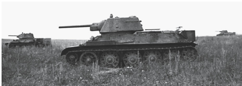
Советские танки Т-34 в степи