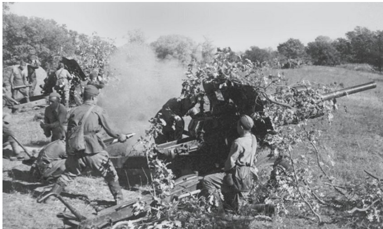
Расчеты 76-мм орудий УСВ образца 1939 года ведут огонь

Батареи 614-го иптап, разбросанные по высотам в районе совхоза «10 лет Октября», хуторов Плесистовский и Скворин, вступили в бой с боевыми группами моторизованных дивизий немцев. К вечеру артиллеристы отчитались, что разбили обоз, уничтожили самолет, шесть танков, пять минометов, три пулемета и до 75 солдат, но потеряли несколько орудий с тракторами, а потому были вынуждены отойти на юг.