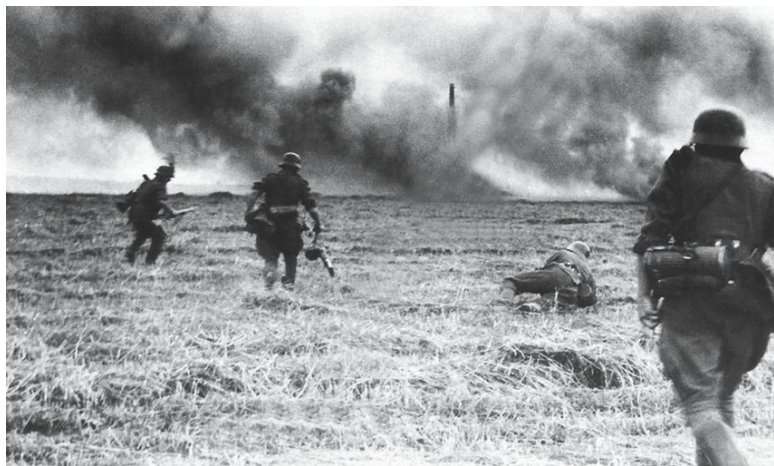
Немецкие пехотинцы идут в атаку