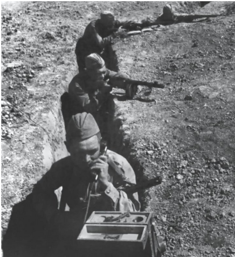
Красноармейцы в обороне, лето 1942 года