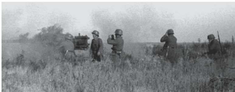
Расчет 75-мм противотанкового орудия Pak 40 из 113-й

На фронте 84-го гв. сп, через который прорвалась боевая группа 16-й тд, весь день гремел бой. Все три полка 113-й пд атаковали позиции гвардейцев, в штаб 14-го танкового корпуса шли доклады об упорном сопротивлении с хорошо подготовленных замаскированных позиций в районе юго-западнее Калмыкова и самом Калмыкове и о неприятеле, который окапывался на высотах севернее Манойлина. Дополнительно продвижению пехотинцев генерал-лейтенанта фон Арнима (Hans-Heinrich von Arnim) сильно мешала заминированная местность. Отметим немцы и три налета групп численностью по 10 одномоторных бомбардировщиков и истребителей с бомбами, которые обстреливали и бомбили колонны и позиции вдоль дороги от Перелазовского на совхоз Копанья.