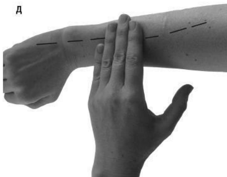
Фото 3 (окончание)

В активные точки меридианов можно втирать согревающие составы, о которых мы поговорим ниже.