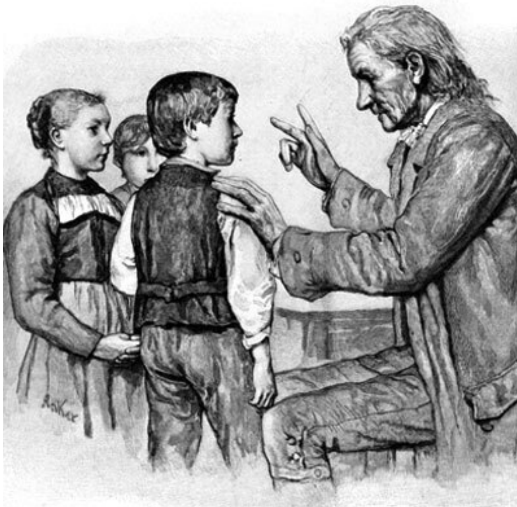
Песталоцци учит детей счёту. Рисунок Альберта Анкера

...Идея элементарного образования есть не что иное, как результат стремлений человечества оказать ходу природы в развитии и формировании наших задатков и сил такое содействие, какое способны оказать ему разумная любовь, развитой ум и хорошо развитые технические склонности.