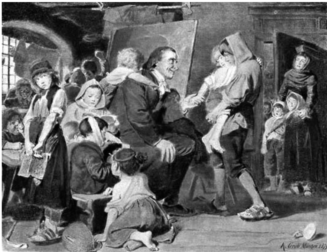
Песталоцци с сиротами в Стансе. Художник Конрад Гроб, 1879

...Не мечта ли идея элементарного образования? Является ли она основанием действительно выполнимого дела? Громко и со всех сторон до меня доносится вопрос: где она существует в действительности?