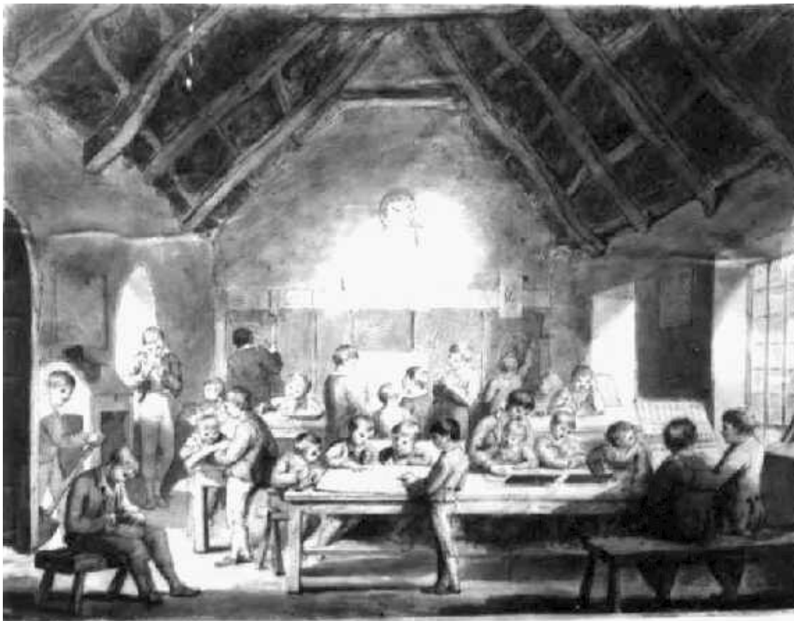
Школа Д. Синджа, последователя Песталоцци, в Раундвуде. Рисунок М. Тэйлор, 1825

чистых уз общественной жизни является неизбежным последствием непризнания этих принципов домашнего и общественного воспитания у всех сословий.