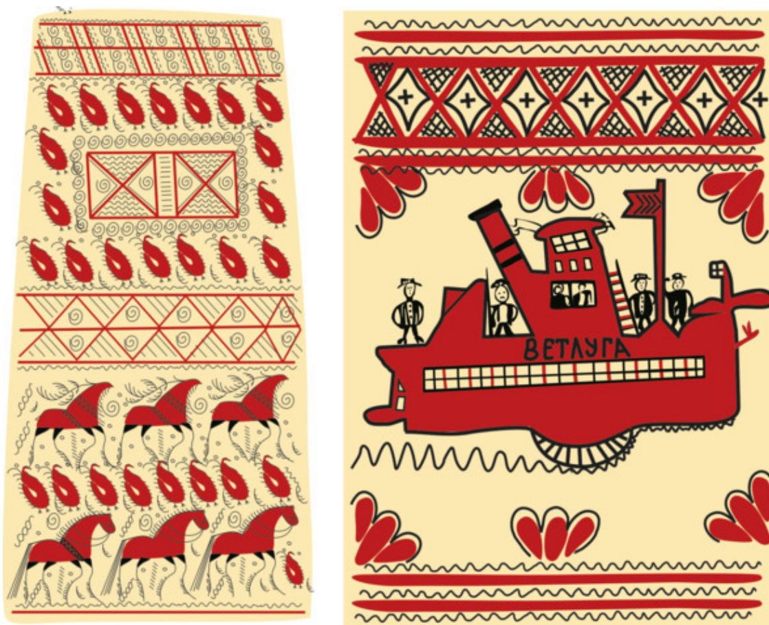
Рис. 17 Фрагменты мезенских прялок. Зарисовка

Расписанные вещи сушили в печах. Затем рисунок покрывали олифой с еловыми маслами, чтобы защитить его от истирания. Высыхая, она придавала фону солнечно-золотистый цвет. В старину олифу делали из конопляного семени, его сушили, толкли, месили и выжимали, а затем ставили на печь и доводили до готовности. Готовность определяли, бросая в состав глухаринное перышко. Свернется перо – готово. Затем рисунок сушили, оставляя на ночь в тёплой печке, а потом натирали до блеска. Поверхность приобретала приятный блеск, казалось, что от прялки или короба в избе даже становилось светлее и ярче.