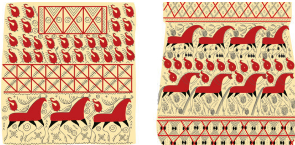
Рис. 15. Зарисовки фрагментов старинных палащельских прялок