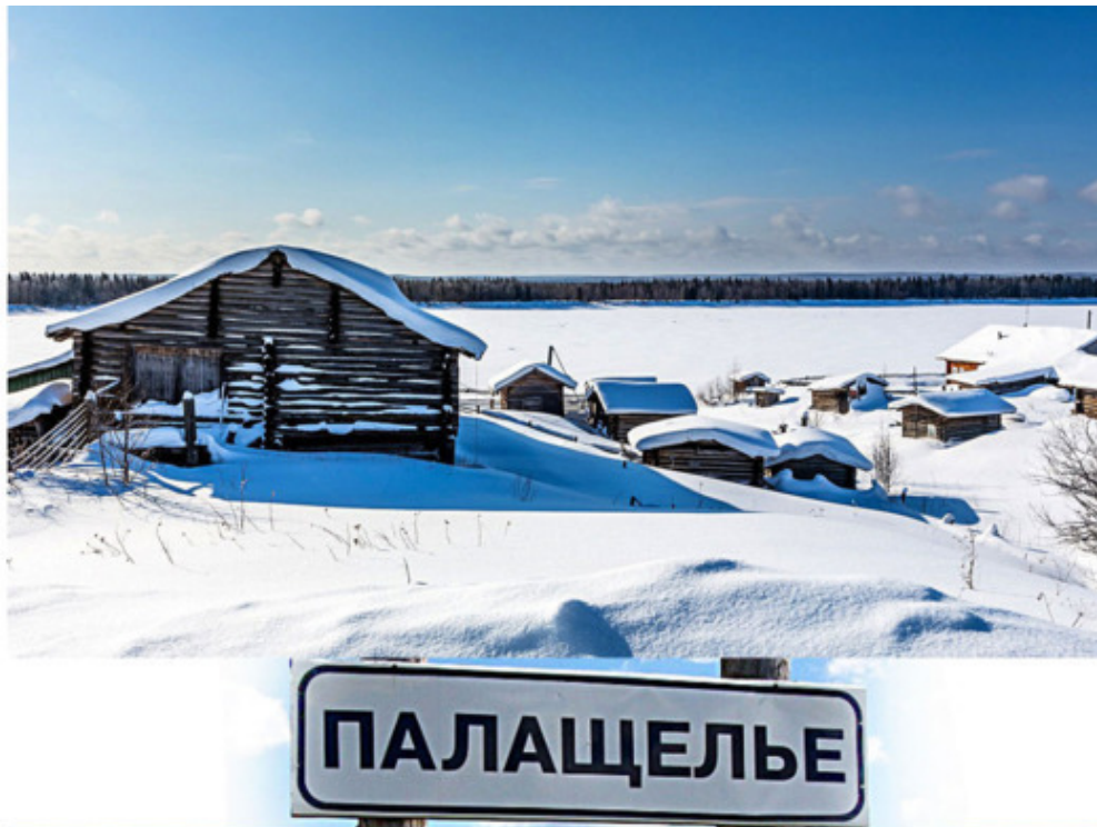
Рис. 12.

Говорят, что без прошлого невозможно понять и по достоинству оценить настоящего.