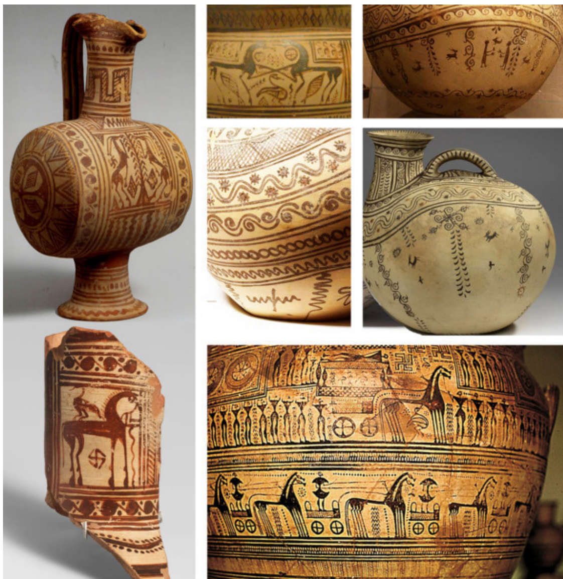
Рис. 9. Древняя греческая и этруская керамика

Мезенские кони и олени мне видятся более похожими на петроглифы Норвегии, писаницы верховьев реки Лены и Прибайкалья. Слабость этой версии в том, что христиане считали петроглифы «от беса», поэтому немного странно выглядел бы факт воспроизведения их на прялках и других повседневно используемых расписных изделиях.