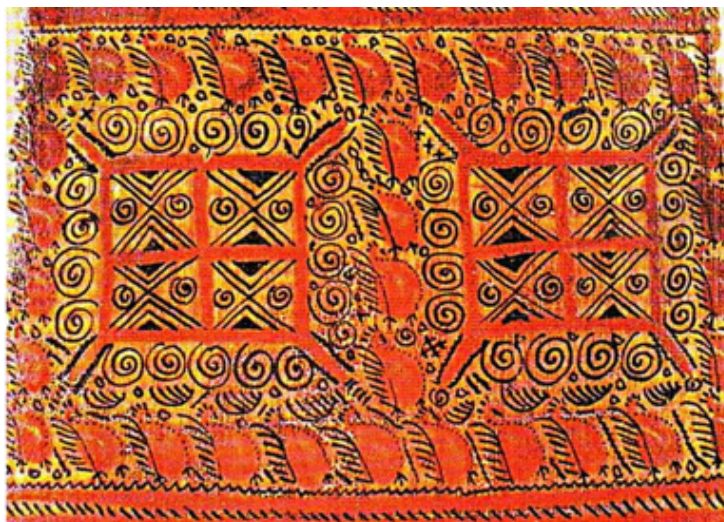
Рис. 2. Фрагмент оборотной стороны палащельской прялки. Конец XIX – начало XX в. Палащельская роспись. Каталог

Но все оказалось не так просто. Северное искусство изучено гораздо меньше, чем такие кистевые росписи, как гжель, хохлома и другие. В мезенской росписи очень много белых пятен, особенно в истории возникновения. Никто не может точно вспомнить, когда и с чего она началась. Скорее всего, мы так и не узнаем эту историю до конца.