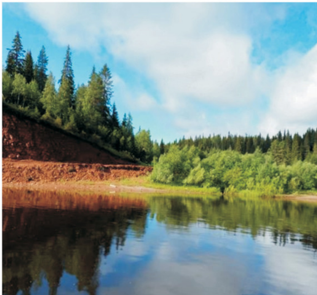
Рис. 3. Река Мезень.

Эта книга не для исследователей, краеведов и этнографов, а для тех, кто любит мезенскую роспись. Здесь собран материал из различных источников, которые автор попыталась собрать и систематизировать для себя, а, если вам это будет интересно, значит, и для вас.