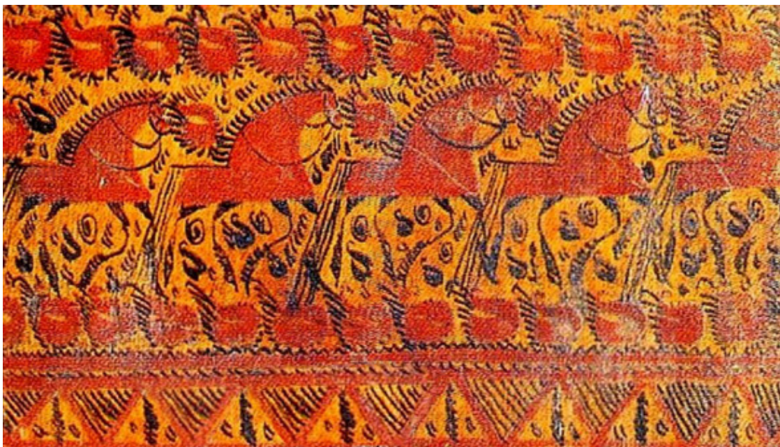
Рис. 1. Фрагмент росписи старинной мезенской прялки

Любить Отечество велят: Природа, Бог; А знать его – вот честь, достоинство и долг