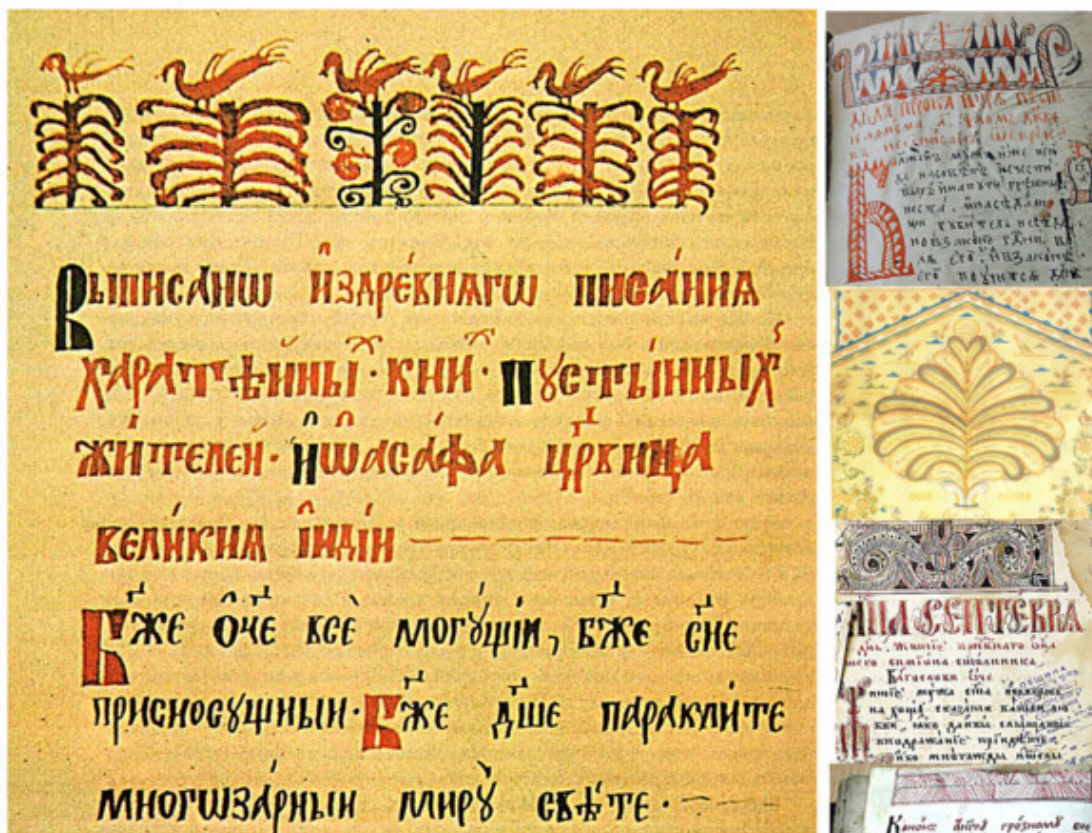
Рис. 7. Слева – заставка в древней рукописи Мезенского собрания в Пушкинском доме (Институт русской литературы Академии наук СССР) 1820 г., справа – фрагменты рукописных книг

Мезенская роспись считается самой молодой среди северных и в то же время имеет самые древние корни из известных русских росписей. Вот уж где можно смело сказать – мы знаем, что ничего не знаем о ней. Когда, как, из каких истоков возникла мезенская роспись, никто не может сказать точно. Элементы мезенских узоров очень архаичны и специалисты в один голос утверждают, что их корни скрыты во тьме веков. Серьёзных исследований о происхождении мезенской росписи практически нет, но есть множество теорий и версий. Какие-то на грани фантастики, какие-то вполне логичны, но имеют слабые места, одни дополняют друг друга, другие не стыкуются ни с чем. Рассмотрим основные версии.