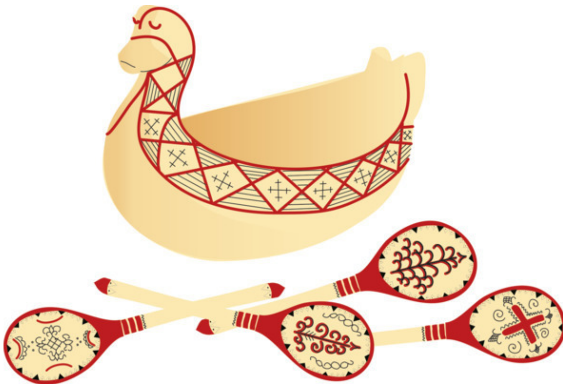
Рис. 14. Ковш. Конец XVIII – начало XIX века. Из «Палащельская роспись. Каталог». Палащельские деревянные ложки. Зарисовка