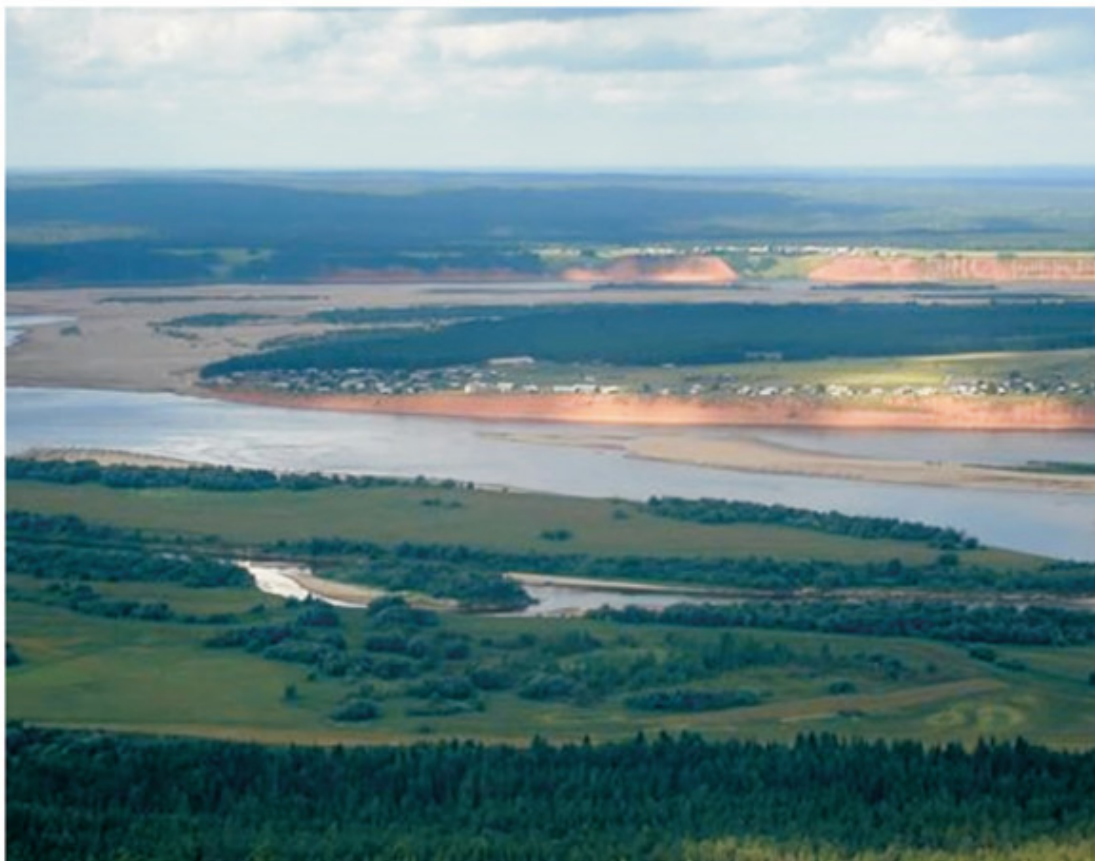
Рис. 5. Река Мезень.

Именно здесь в деревушке Палащелье, на высоком берегу реки Мезень, зародился знаменитый орнамент. Это река потрясающей красоты. Один берег пологий, другой высокий, обрывистый, красно-кирпичного цвета, местами до 30 м в высоту. Красная слоистая глина хорошо очищает воду. Местные кладут её прямо на дно сосудов, лучше любого фильтра работает.