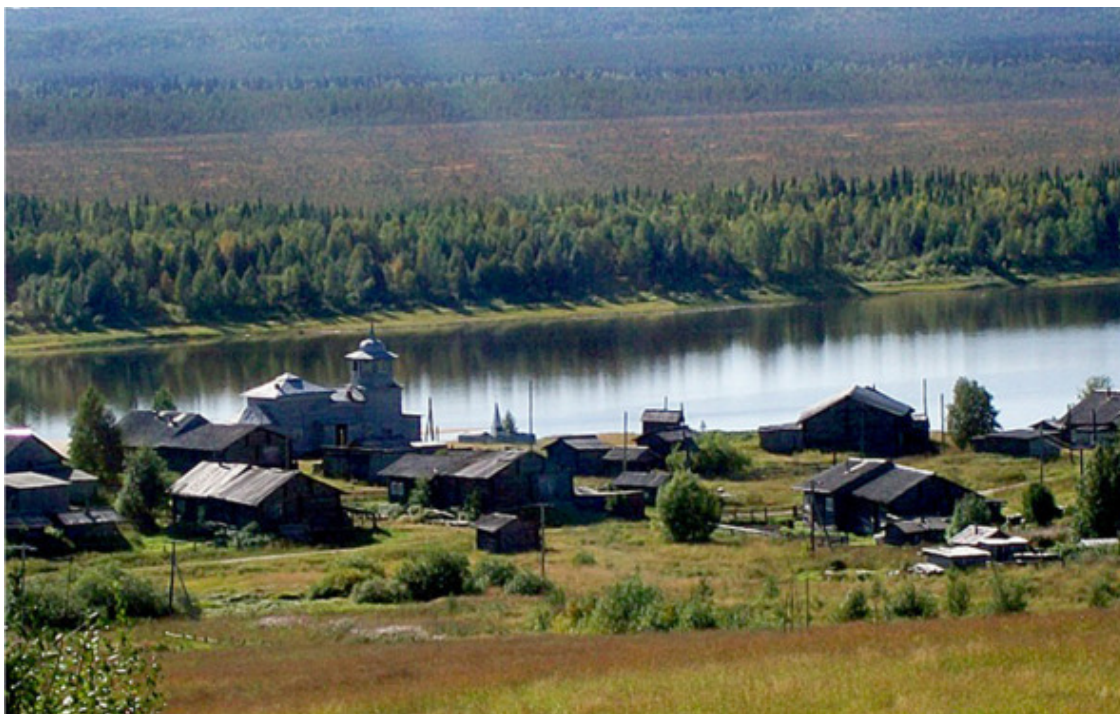
Рис. 13. Село Палащелье, 2009 г. Фото из свободных источников