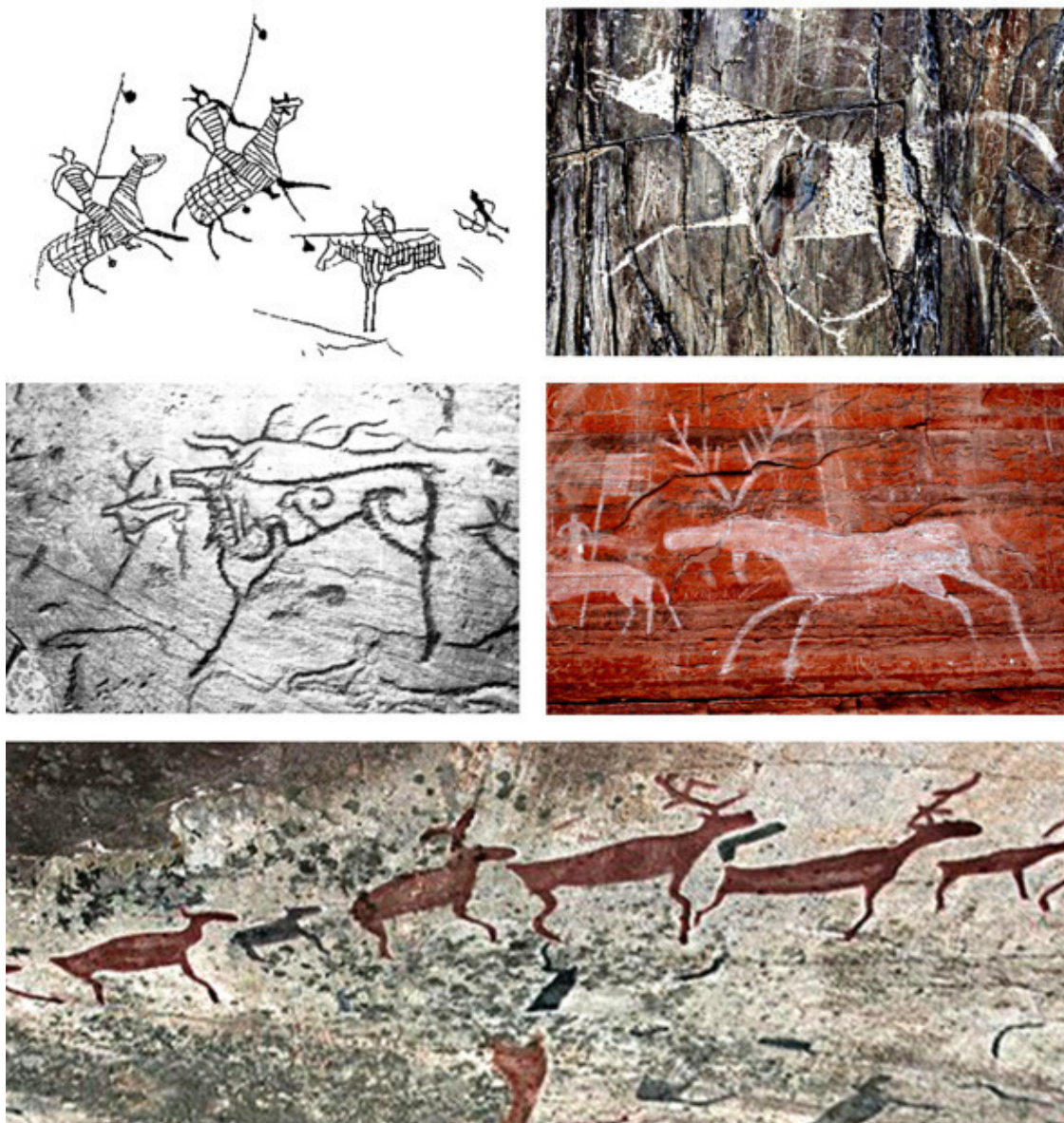
Рис. 8. Петроглифы

Графичность, такая лаконичность и даже примитивность рисунков, их цветовая сдержанность и чёткость линий навевают мысли о связи мезенской росписи с древними наскальными рисунками первобытных людей. Некоторые узоры напоминают петроглифы Заонежья, Белого моря и скандинавских стран. Там есть похожие олени, люди, лебеди, лодки. А лошадей нет. Лошади есть на Алтайских петроглифах. Зато в беломорских есть рыбы, а в Мезенской традиционной росписи их не рисовали совсем, хотя одним из популярных занятий мезенцев было рыболовство. Да и геометрический орнамент не блещет тем разнообразием, есть спирали, круги и полумесяцы, которые учёные трактуют как соляные и лунные знаки.