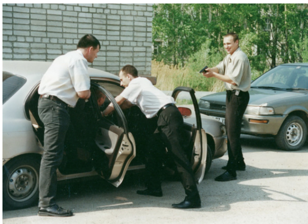
ДВ РУБОП 1997 год. Задержание.