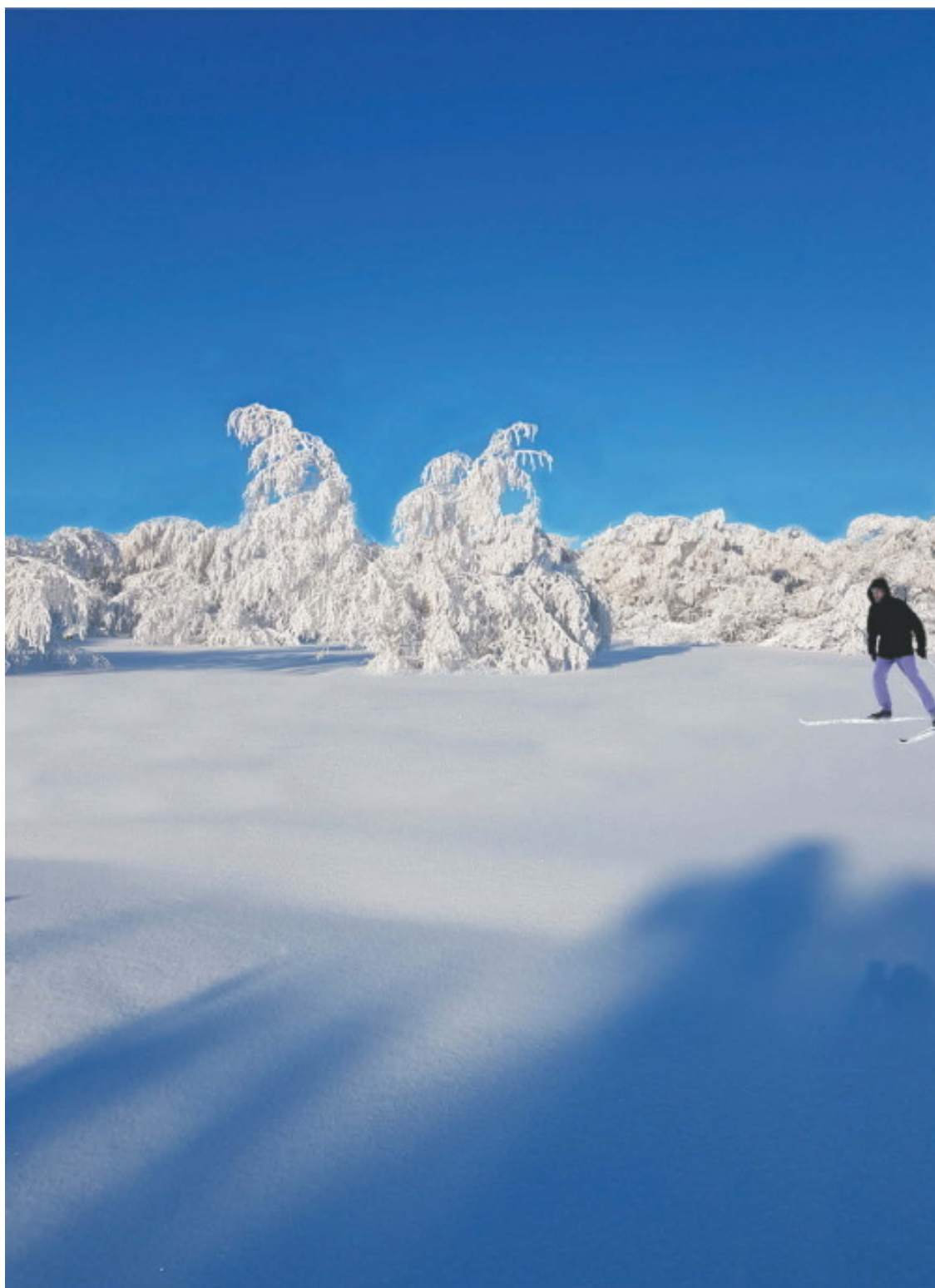
Саратов, янв., 2019 г.