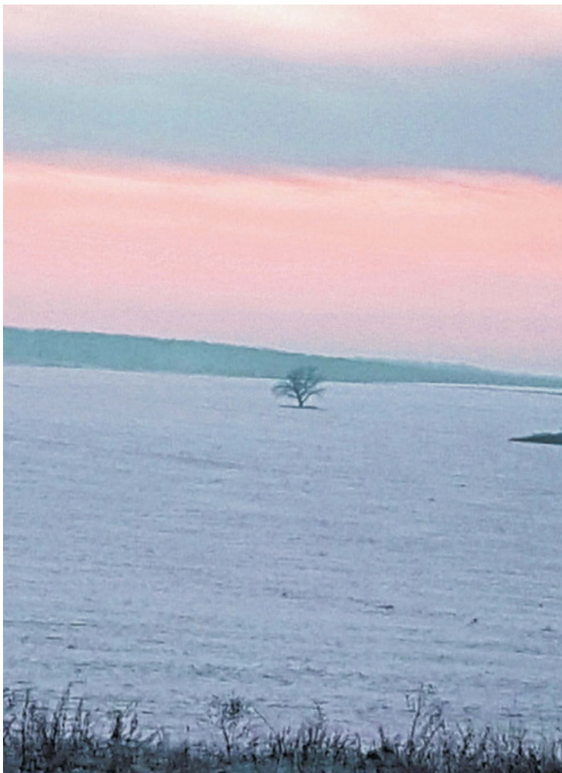
Саратовская обл., дек., 2018 г.