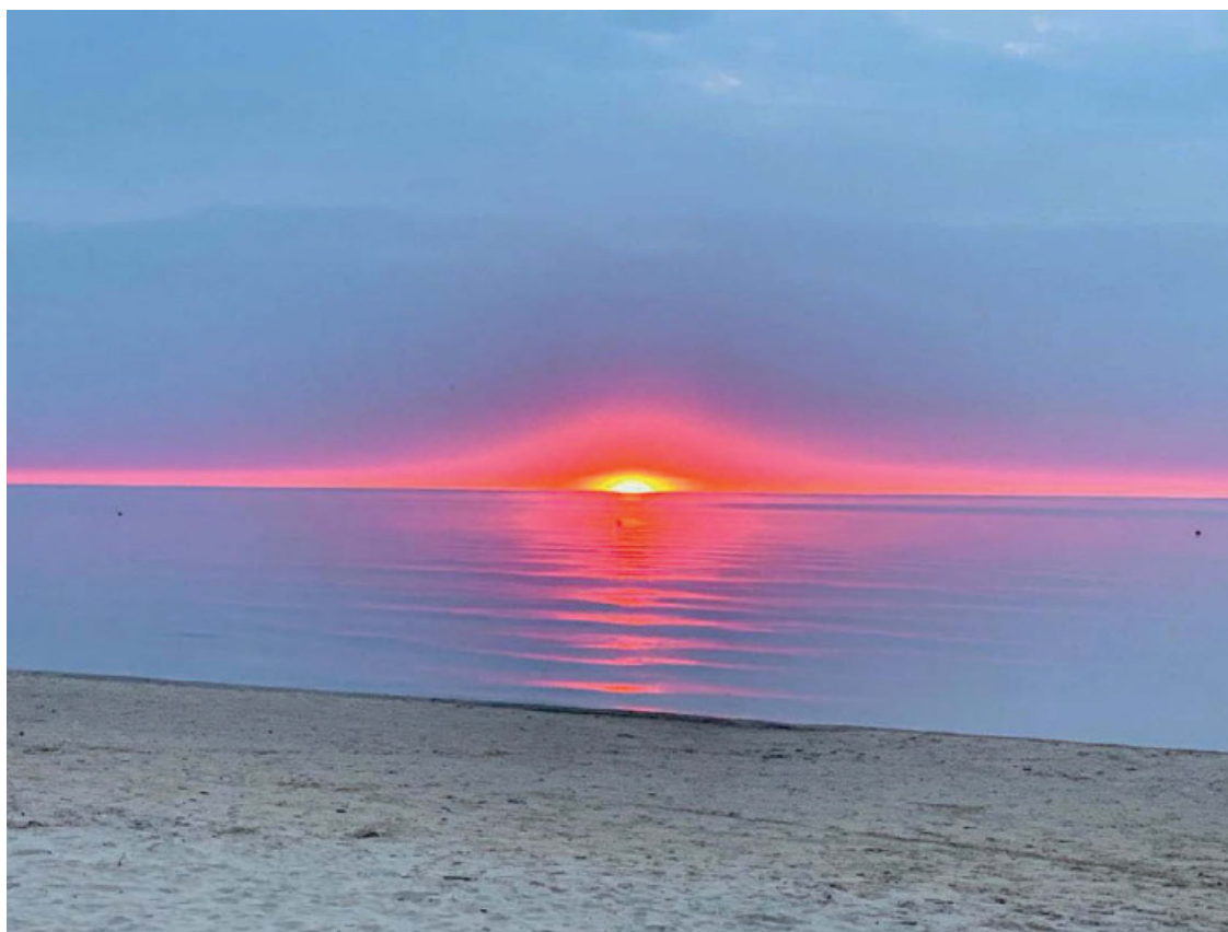
Фото Дмитрия Исаева, Латвия, Юрмала, июнь, 2019 г.