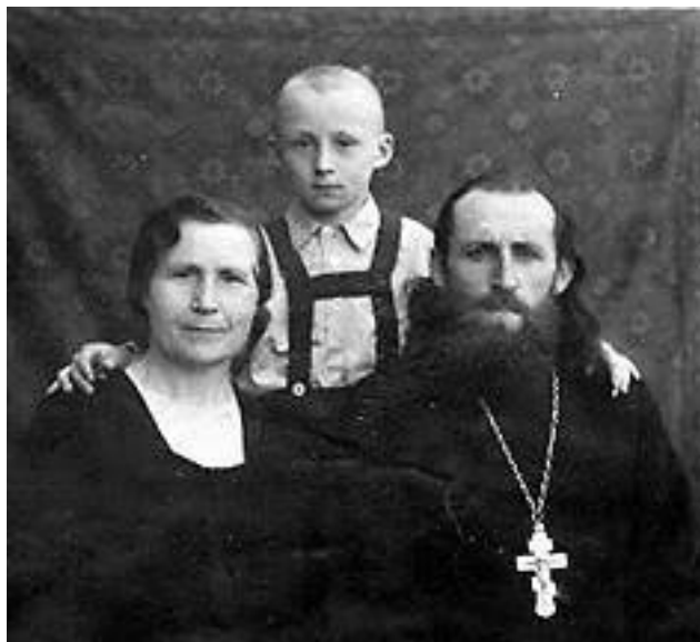
Родители в селе Охово, 1947 год

В феврале 1946 года, по просьбе прихожан села Охово, отец был назначен настоятелем церкви Рождества Пресвятой Богородицы в этом селе. Прихожане с радостью встретили «своего батюшку».