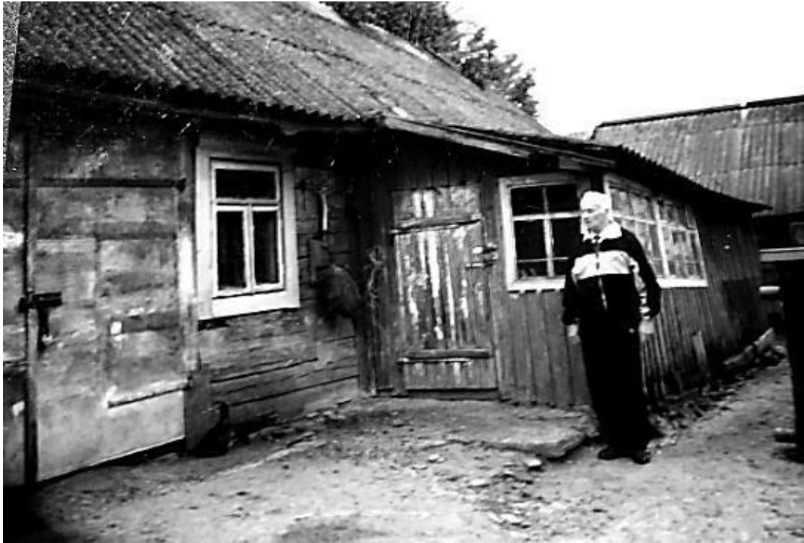
Снимок домика в с. Охово сделан в 2005 году, когда я посещал места моего детства.

В сарае содержались коза и куры. Был небольшой огород, где отец выращивал немного картошки и овощей. Кроме этого прихожане делились с батюшкой картошкой, хлебом и молоком. В деревне не было электричества, радио. Священнику было запрещено продавать дрова, поэтому обогревались русской печью, которую топили торфяными брикетами, а растапливали «косточками», собираемыми в лесу. Питьевую воду носили из соседнего хутора в 300 метрах от нашего дома, где был очень глубокий колодец.