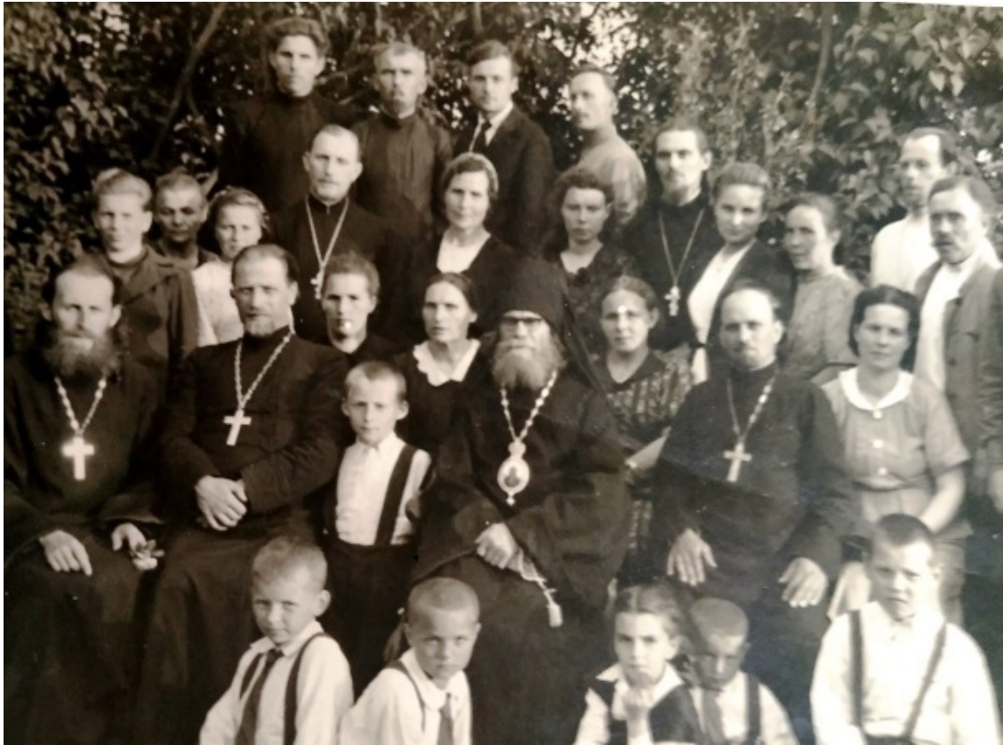
На храмовом празднике в с. Охово

На всю жизнь запомнил я, семилетний мальчик, мамину христианскую воспитательную работу, проведенную со мной. Случилось так, что это послужило мне серьезным нравственным уроком. Дело в том, что наш церковный дом находился на хуторе у кладбища. Кладбище было заросшее вековыми деревьями и кустарниками. В лунную ночь из окна дома были видны могильные кресты, а при сильном ветре был хорошо слышен шум от деревьев. Когда ночью родителей вызывали к умирающему прихожанину, а чаще – в одну из соседних деревень: отца, как священника, а маму, как медицинского работника, я оставался один в доме, мне было очень страшно. Казалось, что волки «могут прыгнуть в окно» и «бандиты-грабители прячутся за дверью или под кроватью». В послевоенные годы был разгул бандитизма.