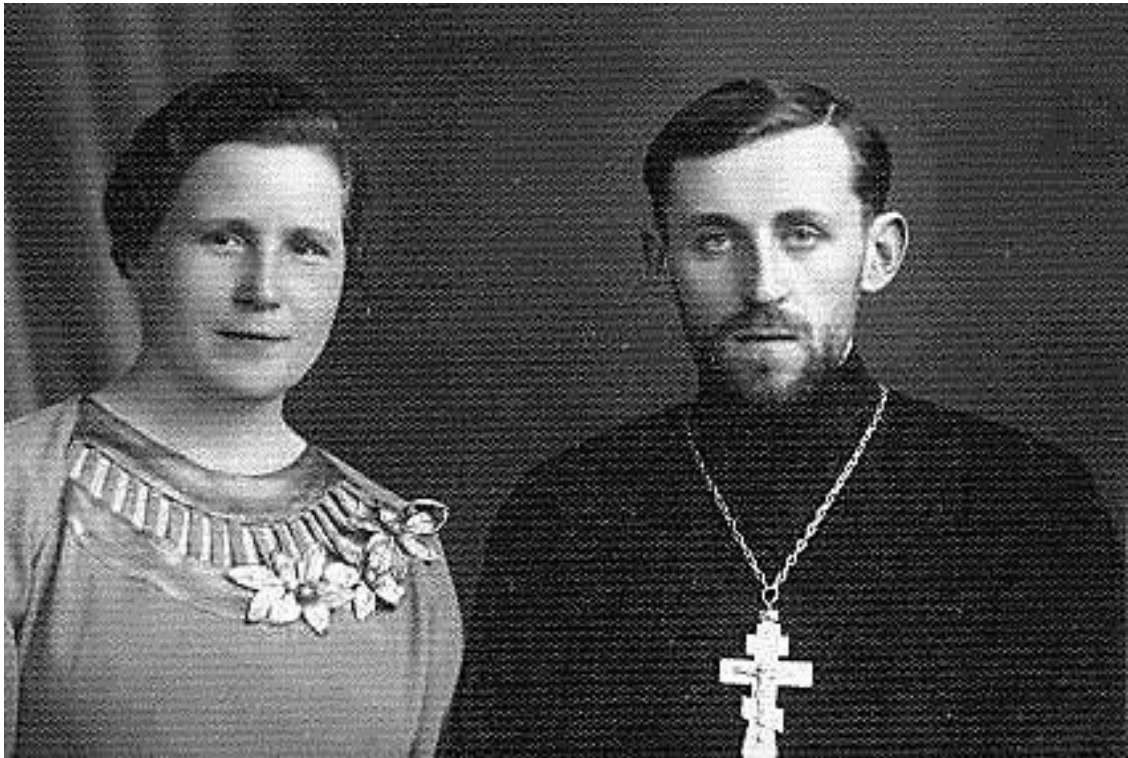
Мои родители. 1936 год

города Пинска, из которого до деревни можно было добраться только пешком или «конной тягой».