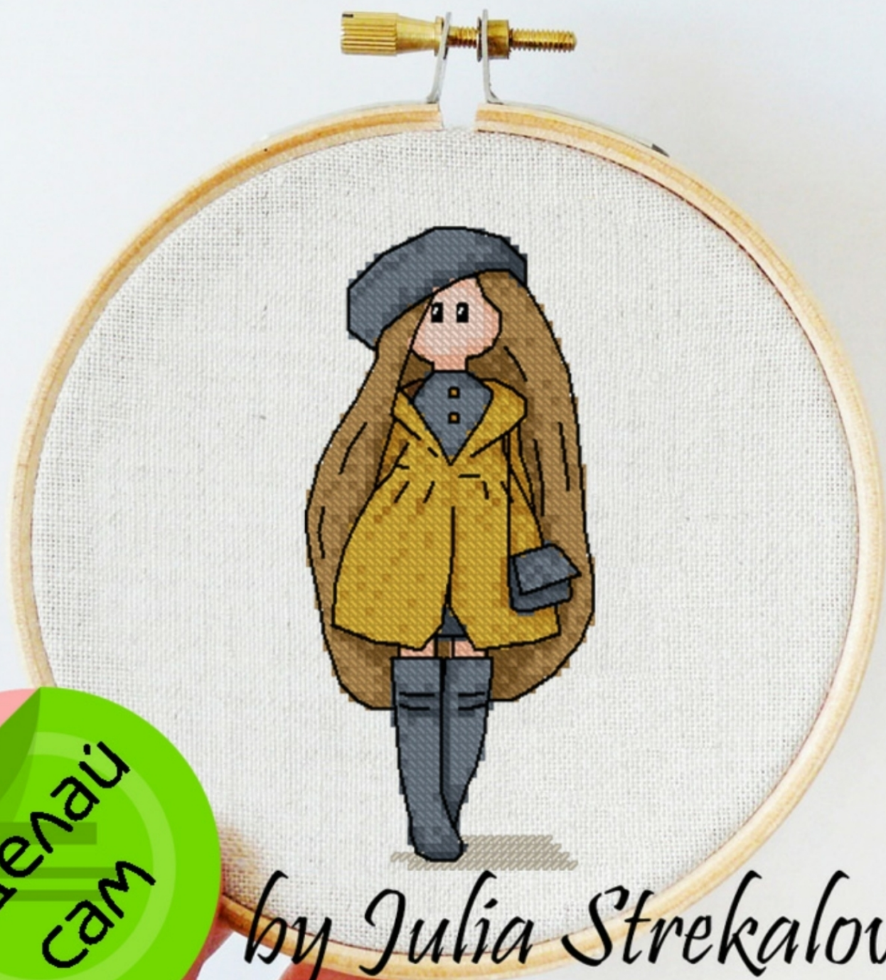
Схема для вышивки крестиком