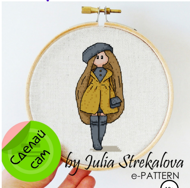
Схема для вышивки крестиком