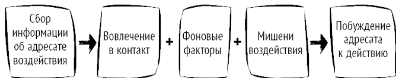
Рис. 2. Модель скрытого управления

противления со стороны убеждаемого человека помогает знание механизма воздействия на него при скрытом управлении. Этот механизм описывается следующей моделью (рис. 2).