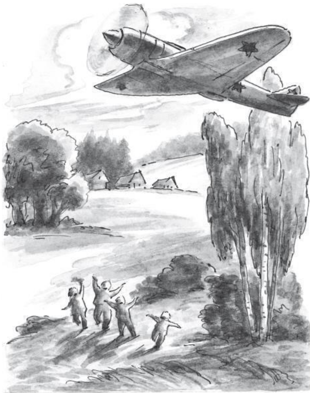
Рисунки А. Рытман