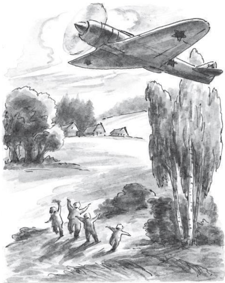
Рисунки А. Рытман