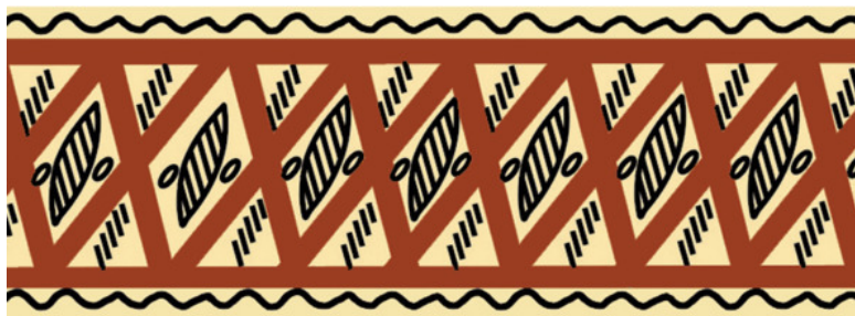
Рис. 8. Зарисовка фрагмента старинной палашельской прялки

Мезенской росписью украшали деревянные предметы быта – прялки, короба, лукошки, ложки. Мастера использовали только два цвета – чёрный и красно-коричневый. Краски изготавливали из природных материалов особым способом, растирали красную береговую глину или брали сажу и смолу лиственницы. Часто древесину пропитывали льняным маслом. Чтобы дольше сохранить рисунок, изделия покрывали олифой (на основе семян конопли) с еловыми маслами. Это придавало фону очень красивый, благородный золотистый цвет. С таким покрытием казалось, что рисунок находится как будто под стеклом.