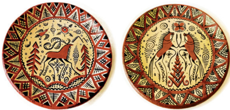
Рис. 10. Работы автора в стиле мезенской росписи

При этом сами изображения статичны, и лишь благодаря многократному повтору возникает ощущение динамики. И эта динамика может быть символичной. Например, несколько животных в ряд читались как движение светила по небосводу. Если красный конь олицетворял солнце, то ряд коней обозначал уже движение дневного светила по небу – слева направо, покадрово, как в мультфильме. Изображения животных и птиц при этом очень необычны, стилизованы.