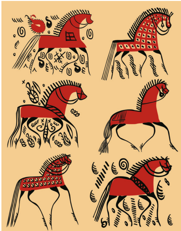
Рис. 23. Знаки на конях