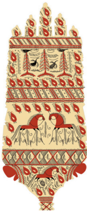
Рис. 7. Зарисовка фрагментов старинных прялок