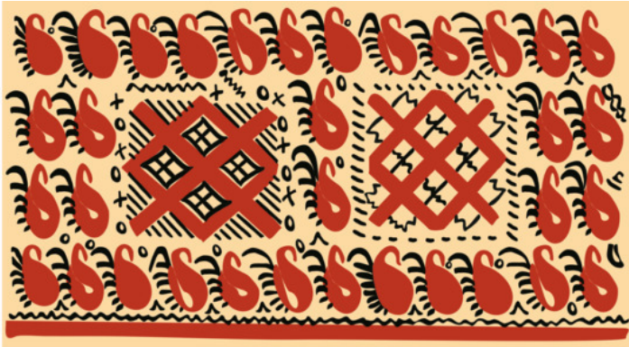
Рис. 1. Зарисовка фрагмента старинной прялки