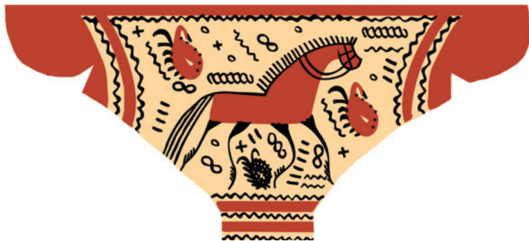
Рис. 11. Зарисовка фрагмента старинной палашельской прялки

Обычно делают три яруса: в нижнем рисуют коней и птиц, в среднем могут быть кони с птицами, над ними олени, а в верхнем – исключительно птицы и так называемое «окно», символизирующее небо и связь с высшими силами. Его изображают в виде рядов прямоугольников, заполненных геометрическими фигурами и окруженных птицами. Получается так: 3 полосы геометрического орнамента и 3 полосы с персонажами (конями, оленями, птицами).