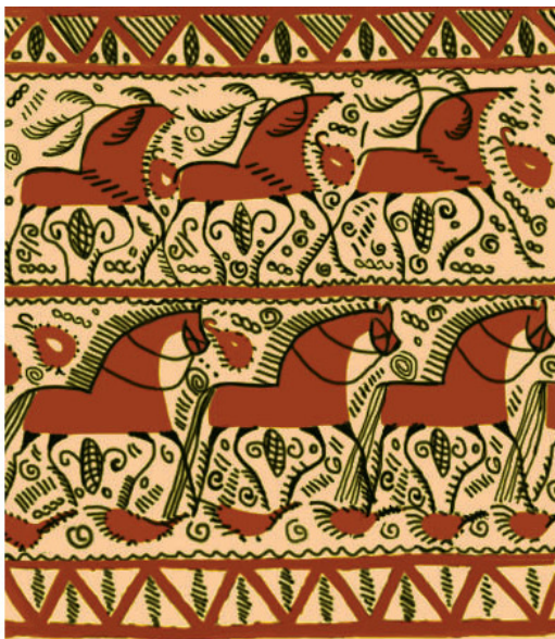
Рис. 3. Зарисовка фрагмента старинной мезенской прялки

Да-а, переработка новой информации, поиск работ современных мастеров и ответов на поставленные вопросы – та еще задача. О традиции для меня оказалось писать гораздо легче, чем о современной мезенской росписи, хотя материала я набрала огромное количество, компьютер просто распух от многочисленных папок с работами разных авторов. Ждут они не дождутся своего часа для публикации.