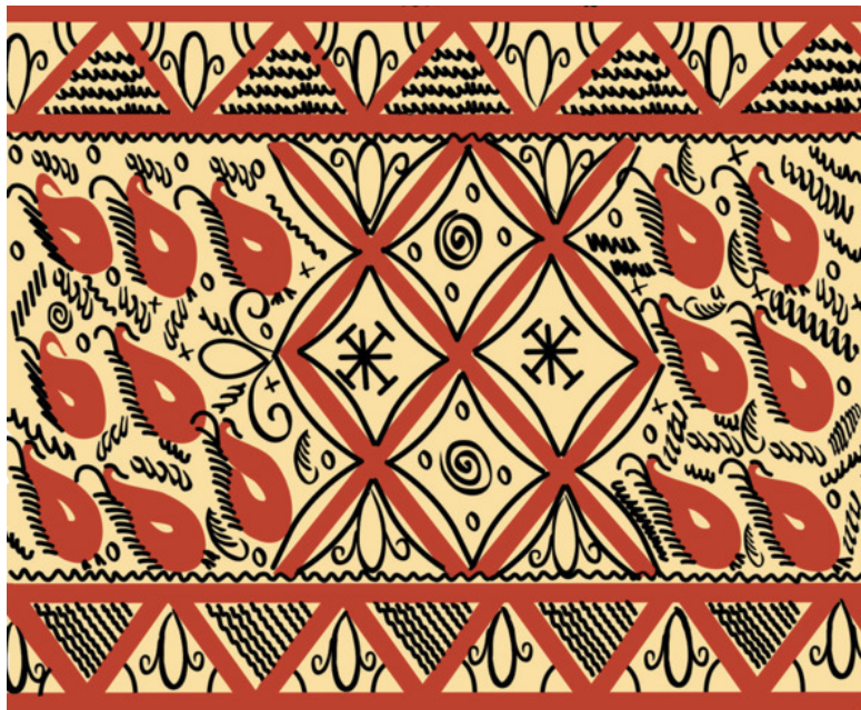
Рис. 15. Зарисовка фрагмента старинной прялки

Однако век промысла был недолог. В селе образовался колхоз «Дружба». С этого момента у местных появился устойчивый сельскохозяйственный заработок, и они практически перестали делать и расписывать прялки. Промысел просуществовал до 1930-ых гг. Производство прялок полностью прекратилось после Великой Отечественной войны. Один из последних образцов среди музейных экспонатов –