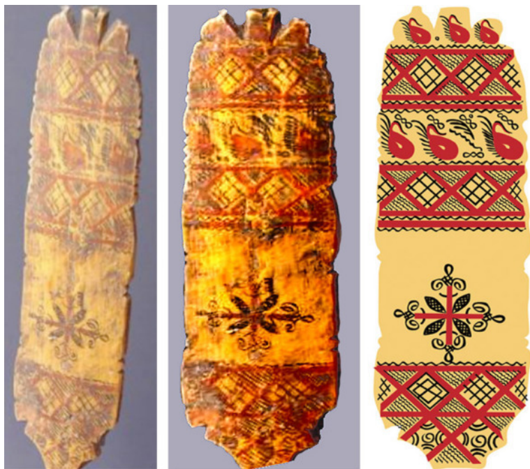
Рис. 4. Восстановление рисунка по фото старинной прялки

тельно зарисовывала их. Это занимало очень много времени. Но мне так нравился результат, когда из тёмной, едва заметной, полустертой росписи появлялся живой, чёткий, яркий рисунок.