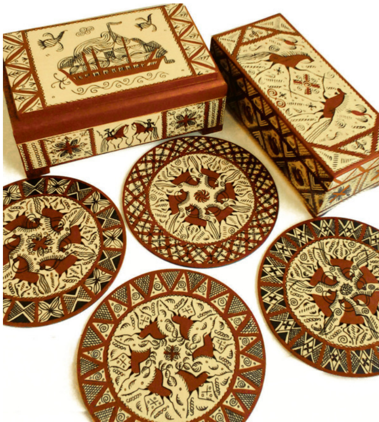
Рис. 2. Работы автора в стиле мезенской росписи

В книге много внимания уделяется подражательным центрам и техникам. Это связано с вопросами моих читателей и попыткой разобраться в сложившейся путанице. Возмож-