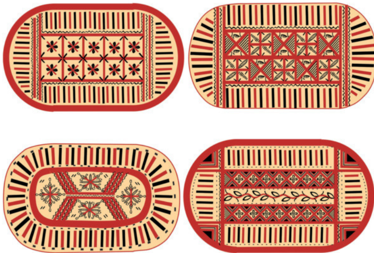
Рис. 16. Зарисовки крышек палащельских коробов

Для росписи прялок, лукошек, посуды, туесов, хлебниц и коробов палащельские мастера использовали характерный геометрический орнамент. Он состоит из клеточек, треугольничков, кружочков, завитков – простеньких, как в школьных тетрадках (помните, как рисовали?). Несмотря на такую простоту элементов, не было и двух полностью одинаковых работ. В настоящих мезенских рисунках во гла-