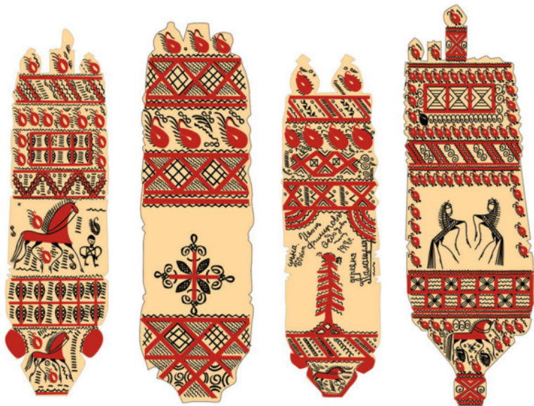
Рис. 25. Зарисовка фрагментов детских прялок

Моя прялочка широка, За ней некому сидеть, Нету парня важного, А прялка не про каждого.