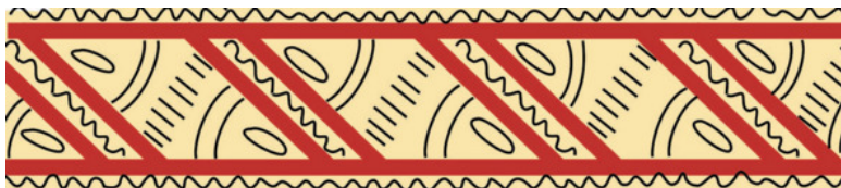
Рис. 22. Зарисовка фрагмента старинной прялки

ливее в их жизни будет любовь и замужество: «какова нить, такова и жизнь». Да и невест родители женихов выбирали по умению прясть, вышивать и ткать.