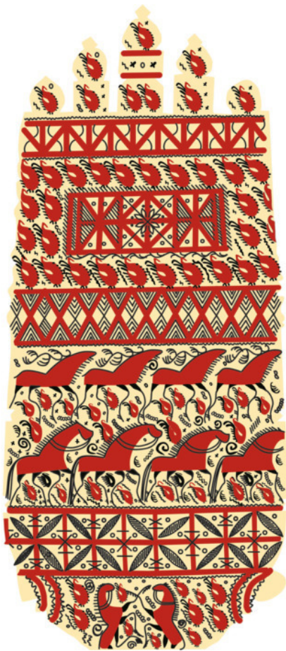
Рис. 20. Зарисовка фрагментов старинных палащельских прялок