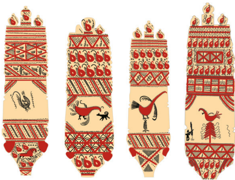
Рис. 24. Зарисовка фрагментов детских прялок

Обычно свою первую прялку девочка получала от отца. Когда она становилась взрослой, то отец делал или покупал для неё новую – резную или расписную. Взрослая прялочка могла достаться и по наследству от старших женщин семьи. Часто прялка была ценным подарком мужа жене, ино-