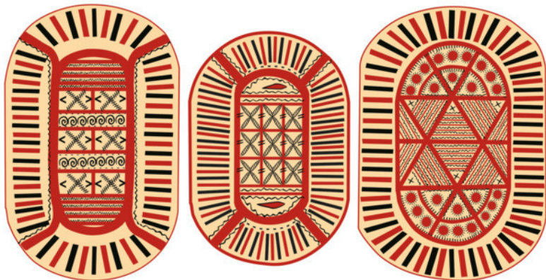
Рис. 19. Зарисовки крышек коробов

И ещё для сравнения: в соседней Вологде прялочки украшали в основном круговыми резными орнаментами. Интересно, что там круглые озера делили на доли-сегменты для зимнего лова. Да и пироги вологодцы разрезали на дольки из центра, а на Русском Севере так не принято. Вот и получается, что в орнаментах отражается наш способ мышления и творческого, и даже геометрического.