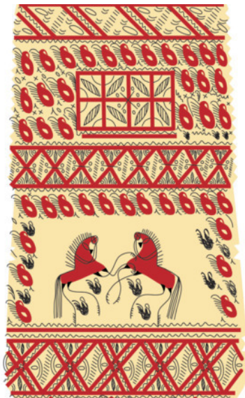
Рис. 5. Зарисовка фрагментов старинных прялок

Сначала нужно подобрать фото, а это не так-то просто: то ракурс не тот, то низкое качество, то не хватает света, то изображение слишком расплывчатое. Часто сама прялка тёмная от времени и старости, олифа почернела, загрязнилась, местами покрытие утрачено. Фотографии нужно привести в порядок. Для их реставрации прибегаю к помощи графической программы Photoshop.