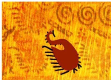
Рис. 6. Восстановление рисунка со старинных прялок