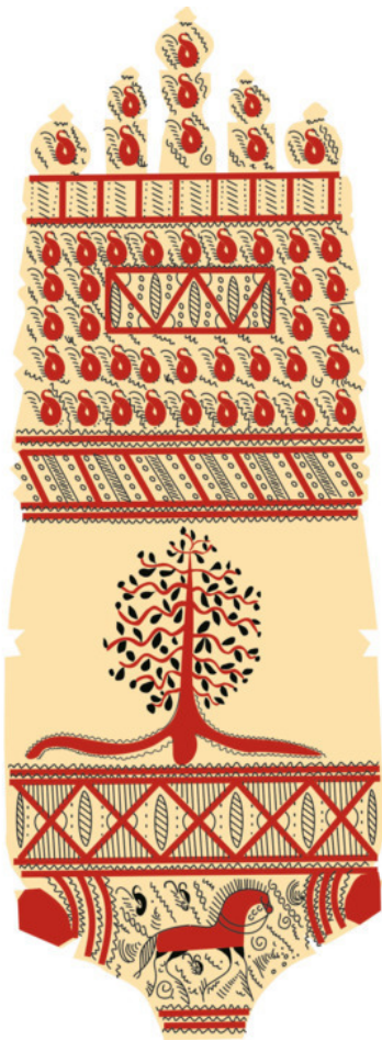
Рис. 21. Зарисовка фрагментов старинных палашельских прялок