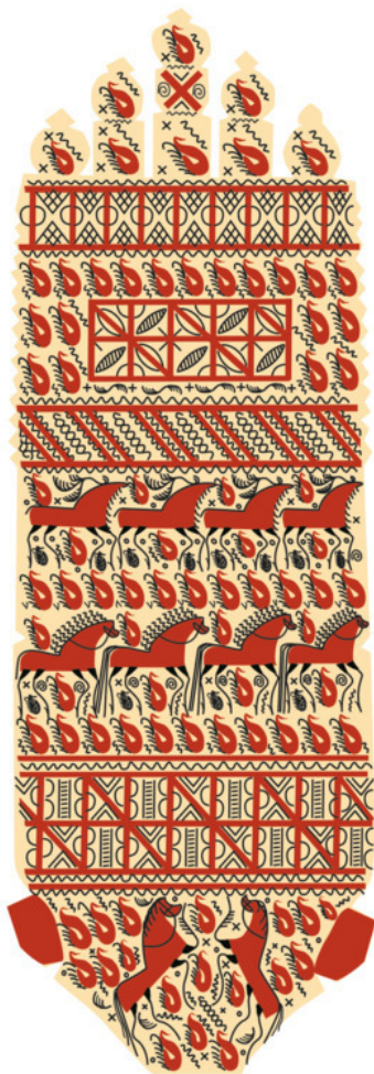
Рис. 9. Зарисовка фрагментов старинных палащельских прялок