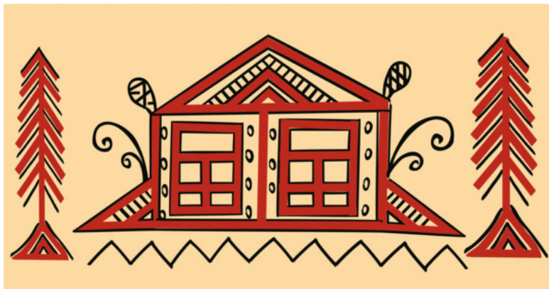
Рис. 13. Зарисовка фрагмента старинной прялки

Мезенская, или палащельская роспись – самая древняя среди северных. Она родом из села Палащелье, расположенного в среднем течении реки Мезень. Отсюда и два названия – мезенская в честь реки и палащельская в честь центра росписи.