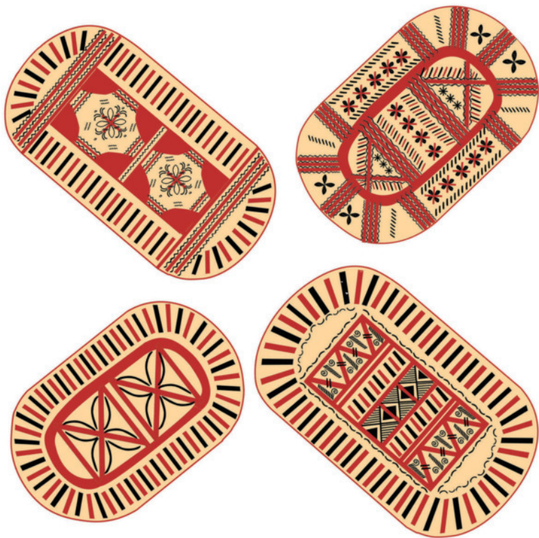
Рис. 17. Зарисовки крышек коробов