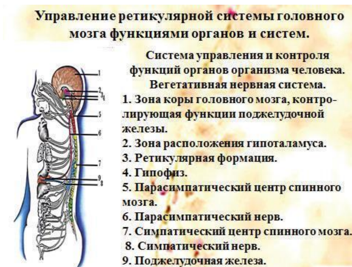
Рис. 2. Управление ретикулярной системы головного мозга функциями органов и систем

ная система не может бесконечно находиться в таком активном состоянии. Истощившаяся иммунная система через некоторое время отключается для восстановления своего потенциала и отдыха. Воспользовавшись паузой, инфекция начинает вновь активно развиваться и делает это гораздо быстрее, чем восстанавливается иммунная система. Как только доза выделяемых инфекцией токсинов превышает допустимую, мозг человека вновь включает иммунную систему, но часто это происходит раньше восстановления её потенциала. И так продолжается до тех пор, пока иммунная система не истощится в борьбе с этой инфекцией и её всплески уже не смогут оказывать серьёзного влияния на развитие инфекции и заболевания. Иммунная система уже принимает это состояние организма как оптимальное. А ретикулярная система головного мозга, запомнив состояние защиты ослабевшей, неадекватной иммунной системы, принимает это состояние за новую норму. И, чтобы не допустить развития инфекции в организме или нового поступления антигенов, она берёт бразды правления в свои руки, не понимая, что вызываемые ею ответные реакции могут быть губительными даже для самой жизни человека. Ретикулярная система головного мозга – это подсознание, тупой автомат, задача которого – инстинктивно, не рассуждая и не думая, быстро реагировать на ситуацию, как ему кажется, во имя спасения жизни человека.