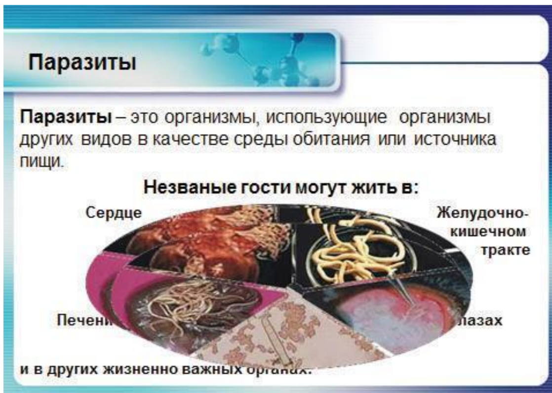
Рис. 3. Гельминты в организме человека

И только сейчас, спустя 25 лет после выхода в свет моей книги «Черви-паразиты», наконец все стали говорить о паразитах, и интернет пестрит предложениями избавить нас от всех паразитов. Многие врачи, присутствовавшие на той конференции, спустя несколько лет (а некоторые и по сей день) продолжают выражать мне благодарность за то, что я открыла глаза им на гельминтную причину многих заболеваний и видов аллергии, что благодаря этому и моим книгам они теперь успешнее диагностируют и лечат трудноизлечимые заболевания пациентов и своих родных.