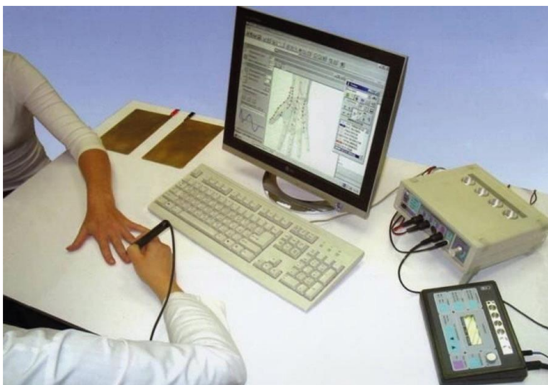
Рис. 4. Метод вегетативно-резонансного тестирования (ВРТ)

Изучив одной из первых метод вегетативно-резонансного тестирования и лечения, имея опыт исследователя и научной работы, в 2000 году я разработала и запатентовала авторскую методику уточнённой вегетативно-резонансной диагностики (ВРД). (Патент на изобретение «Способ вегетативной резонансной диагностики» № 2166907.) Авторскую методику я обсудила и согласовала с учителем – доктором физико-технических наук Ю. В. Готовским, который её одобрил и благословил.