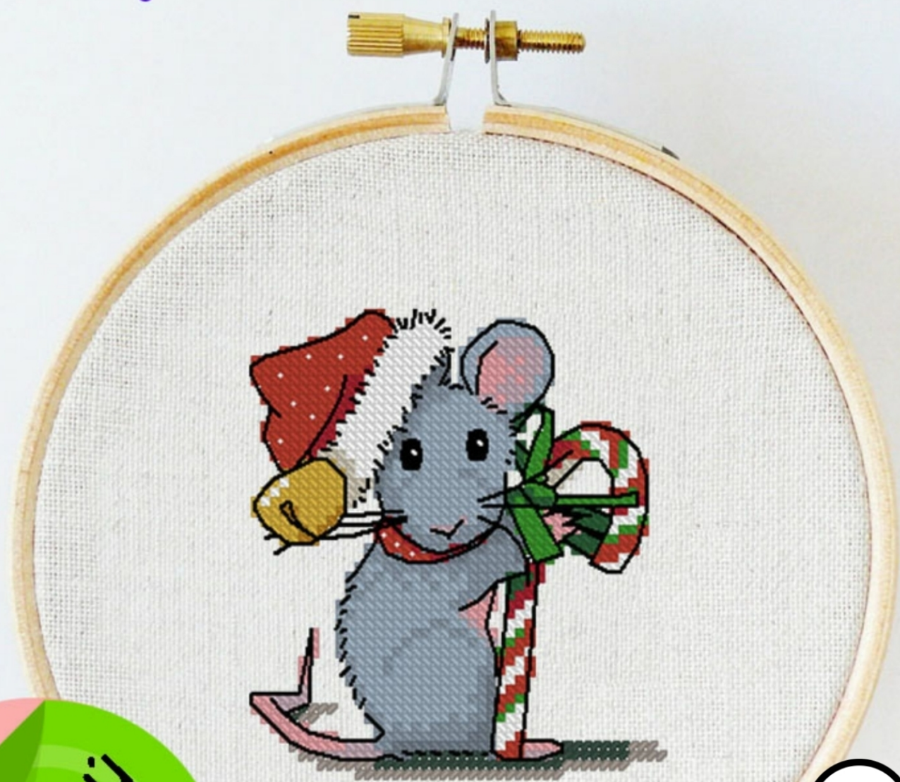
Схема для вышивки крестиком