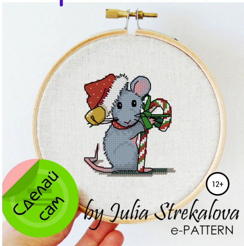
Схема для вышивки крестиком