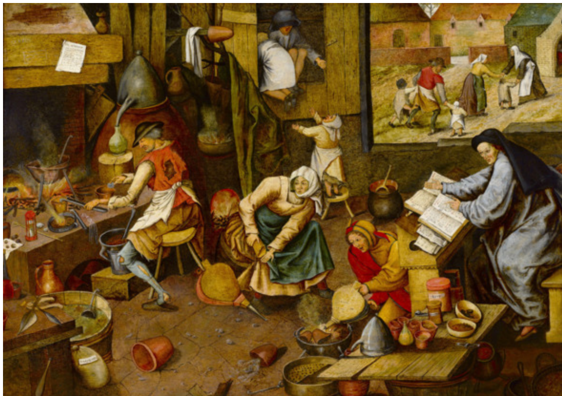
Суматоха в нашей школе в начале ее пути. Оригинал – П. Брейгеля