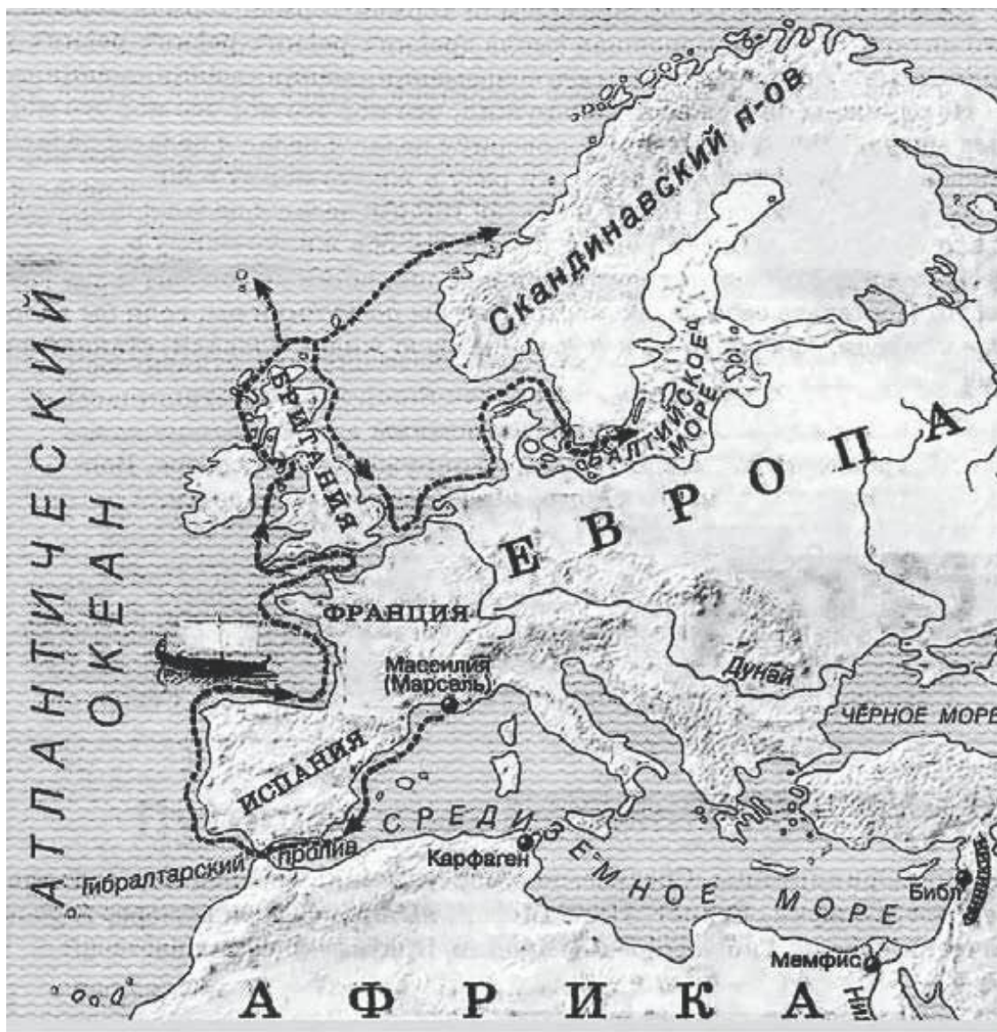
Приблизительный маршрут плавания Пифея

В древнейших гимнах, легендах, сказаниях, мифах запечатлена подлинная память человеческая, хотя в самих этих произведениях содержится немало вымышленного, сказочного, фантастического. Тут и киммерийцы, обитающие в «бесконечной и безотрадной ночи», и киноцефалы – люди с собачьими головами (даже в «Грозе» А. Н. Островского звучит такой отголосок, дескать, «есть еще земля, где все люди с песьими головами», а ведь это уже вторая половина XIX столетия!). Тут и скольльзящие по снегу на лыжах скридфинны, и биармийцы, и гипербореи, живущие в люто холодных краях 6 , тут и карлики, и великаны, обитающие во мраке ночи и «скрепляющие шкуры жилами животных и покрывающие таким образом свое тело».