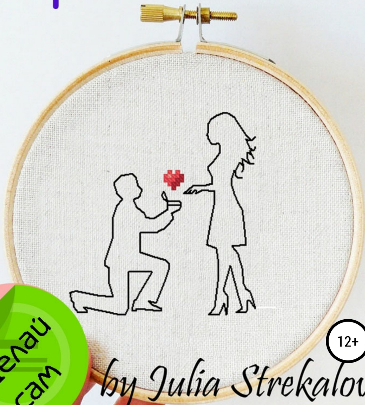
Схема для вышивки крестиком